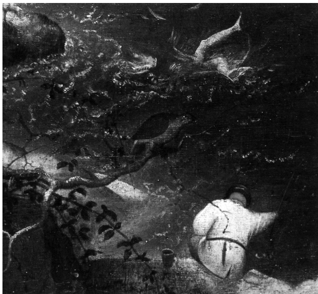
Ilustracja 7. Detal z obrazu Pietera Bruegela (starszego), Pejzaż z upadkiem Ikaru (ok. 1555–1568). Musées Royaux des Beaux-Arts, Brussels.

się po drabinie społecznej. Innymi słowy, chłop ostentacyjnie nie przejawia „potencjalnie fatalnej pychy, by żądać lepszej doli” 54 . A zatem miecz w pochwie widoczny w lewym dolnym rogu płótna może być postrzegany jako element optymalnie zastąpiony przez pług. Z tych względów obraz sugeruje i promuje elementy lub aspekty światopoglądu (z perspektywy ontologicznej, etycznej i społecznej) – zrozumienie historii przekazywanej przez dzieło zakłada przynajmniej częściową znajomość tych elementów i aspektów.