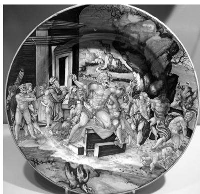
Ilustracja 2. Grupa Laokoon (ok. 1530), krąg Francesca Xanto Avellego, Urbino, Włochy; majolika, szklivo cynowe i ołowiowe, farby podszklivne, 4 x 45 cm. Dar George’a i Helen Gardiner, G83.1.390. Gardiner Museum, Toronto.

I w. n.e.), omawianej także jako typowy przykład przez samego Lessinga. „Brzemiennej momentem” jest tu śmiertelna walka między kapłanem Laokoonem i jego synami a dwoma wężami wysłanymi przez Atenę, by ukarać Laokoon za to, że próbował ostrzec Trojan przed przyjmowaniem do miasta drewnianego konia z greckimi wojownikami ukrytymi wewnątrz. A zatem oglądający, który zna odpowiednie tło narracyjne, może dostrzec w tej rzeźbie znaczący czy kluczowy moment w sekwencji narracyjnej rozciągającej się zarówno w przeszłość, jak i w przyszłość (w której Laokoon i jego synowie giną, Trojanie zaś zostają pokonani przez Greków). Można to także zilustrować majoliką z Urbino we Włoszech (il. 2). Naczynie, datowane