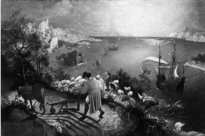
Ilustracja 6. Pieter Bruegel (starszy), Pejzaż z upadkiem Ikara (ok. 1555–1568). Musée Royaux des Beaux-Arts, Brussels (Copyright © Royal Museums of Fine Arts of Belgium, Brussels).

Zgadzam się z tym całkowicie – w obrazie jest jeszcze wiele innych złożoności i subtelności, które warto w tym kontekście przedyskutować 52 .