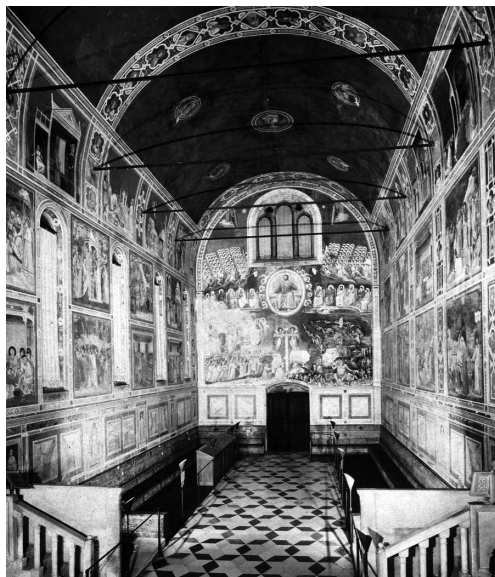
Giotto di Bondone, freski w Kaplicy Scrovegnich, Padwa, Włochy, ok. 1306–1307 r. Assessorato ai Musei Politiche Culturali e Spettacolo del Comune di Padova.