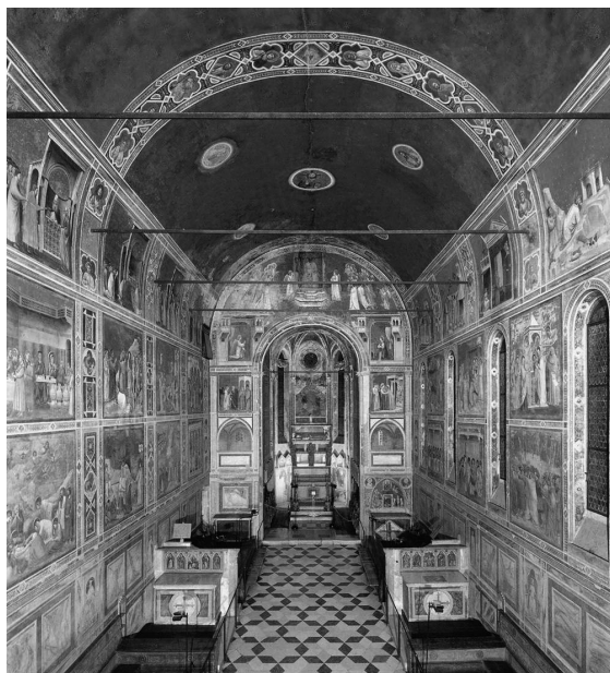
Ilustracja 3. ( tu i na następnej stronie ) Giotto di Bondone, freski w Kaplicy Scrovegnich, Padwa, Włochy, ok. 1306–1307 r. Assessorato ai Musei Politiche Culturali e Spettacolo del Comune di Padova.

na światopoglądy, jakie przywołują w umyśle odbiorcy. Wiele obrazów i innych dzieł sztuki wizualnej powstało z myślą o modyfikowaniu, konfrontowaniu czy nawet odrzucaniu mniej lub bardziej ustabilizowanych światopoglądów. Co więcej, zewnętrzne okoliczności – społeczne, ideologiczne, naturalne (na przykład związane ze zmianami klimatycznymi czy epidemiami), polityczne (wojny, inwazje) – stanowią zewnętrzne źródła zmian w światopoglądach, narracje obrazowe zaś mogą być instrumentami służącymi do modyfikowania i adaptowania światopoglądów w świetle wynikających stąd stanów nierównowagi. Jednakże zrozumiałość obiektów obrazowych wymaga przynajmniej częściowo wspólnego systemu przekonań. A zatem mniej lub bardziej świadome czy intencjonalne wyrażenie światopoglądu w obrazie (albo za pomocą obrazu) może być rozumiane jako uczestnictwo w bardziej ogólnych (społecznych czy kulturowych) symbolicznych próbach potwierdzania (lub zmieniania) światopoglądów. Dlatego też, gdy Vidal mówi o ludzkiej – psychicznej i społecznej – potrzebie światopoglądów, to sugeruje, że zapewniają one „wrażenie sensu życia, uczucie nadziei i zaufania, możliwość spojrzenia na życiowe troski z odleglejszej perspektywy i poczucie przynależności do większej całości” 48 . Vidal podkreśla wagę narracji obrazowych w procesie powstawania, modyfikowania i (mniej lub bardziej stopniowego) zastępowania światopoglądów.