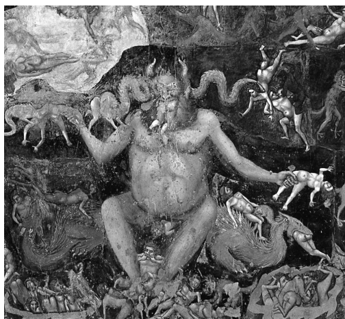
Ilustracja 5. Detal z fresku Giotta w Kaplicy Scrovegnich: Sąd Ostateczny (Potępieni) . Assessorato ai Musei Politiche Culturali e Spettacolo del Comune di Padova.

W wypadku Pejzażu z upadkiem Ikar (il. 6) Pietera Bruegla (starszego) opowiedana (czy przywoływana) historia nie jest tak jawnie obecna jak we freskach Giotta, ale także ona może zostać zanalizowana w odniesieniu do wyrażanego światopoglądu (lub światopoglądów), który przedstawia, rozważa i krytykuje. Poniekąd wbrew tytułowi sam Ikar jest na obrazie ledwie widoczny – w prawym dolnym rogu, gdzie w wodzie widać tylko jego bezradnie rozrzucone nogi (po pełnym pychy locie zbyt blisko słońca, które stopiło wosk jego sztucznych skrzydeł – zob. il. 7). Elementem dominującym w tej scenie jest chłop – obojętny na dramatyczną sytuację rozgrywającą się poniżej (lub jej nieświadomy). Na podstawowym poziomie projektowanie i interpretacja obrazu mogą być powiązane z kluczowymi aspektami światopoglądu, takimi jak przyczynowość (na przykład działanie prawa grawitacji) i czasowość linearna (na przykład sytuacja Ikaru w chwili już po upadku; bruzda zoranej ziemi jako skutek pracy chłopca). Co więcej, przedstawione obiekty można łatwo podzielić na ożywione i nieożywione, na ludzi i nieludzi. Podobnie reprezentacje obiektów i przestrzeni wyraźnie ujawniają głębię, przestrzenne rozróżnienie na pierwszy i drugi plan. Te aspekty są jednak stosunkowo łatwe do wychwycenia w porównaniu z głębszymi implikacjami światopoglądów. W tym sensie obraz Bruegla jest wysoce polisemiczny. Jak wskazuje historyk sztuki Robert Baldwin: