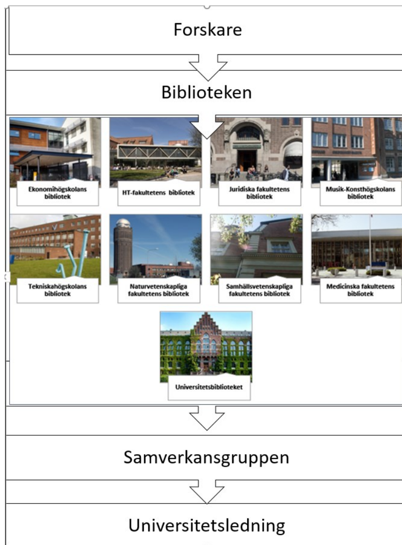
Figur 2. Organisationsformen biblioteken erbjuder är det användarnära stödet.