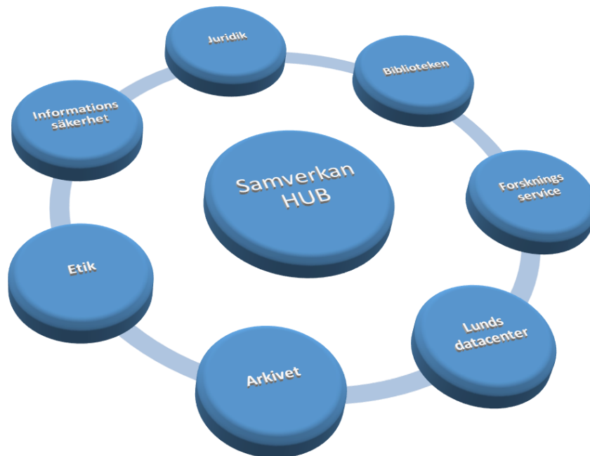
Figur 5. Samverkande kompetenser som behövs för forskningsdataprocessen.

Oavsett hur LU väljer att organisera sin e-infrastruktur, är det viktigt att det finns förutsättningar för att hantera de funktioner som behövs. Kompetensen för detta finns hos forskningsbibliotekarierna, arkivarier, jurister, forsknings- och innovationspersonal samt IT-personal. Biblioteken har etablerade kontakter med dessa personalgrupper och fungerar redan som en samordnare i uppbyggnaden av forskningsdatainfrastrukturen, men skulle vilja växa i den rollen.