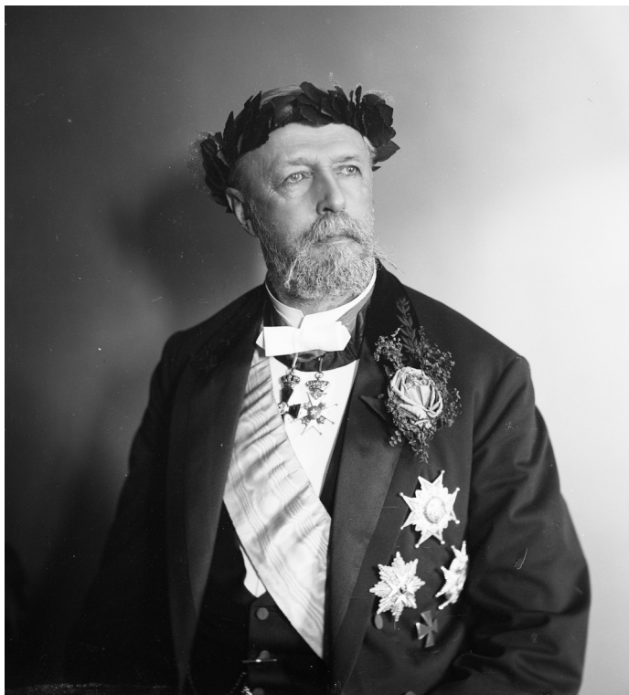
Oscar II med lundensisk hederslager runt hjässan, här dock inte vid den ursprungliga promoveringen 1868 utan fångad av lundafotografen Lina Jonn när han 25 år senare erhöill en "förnyad lager".