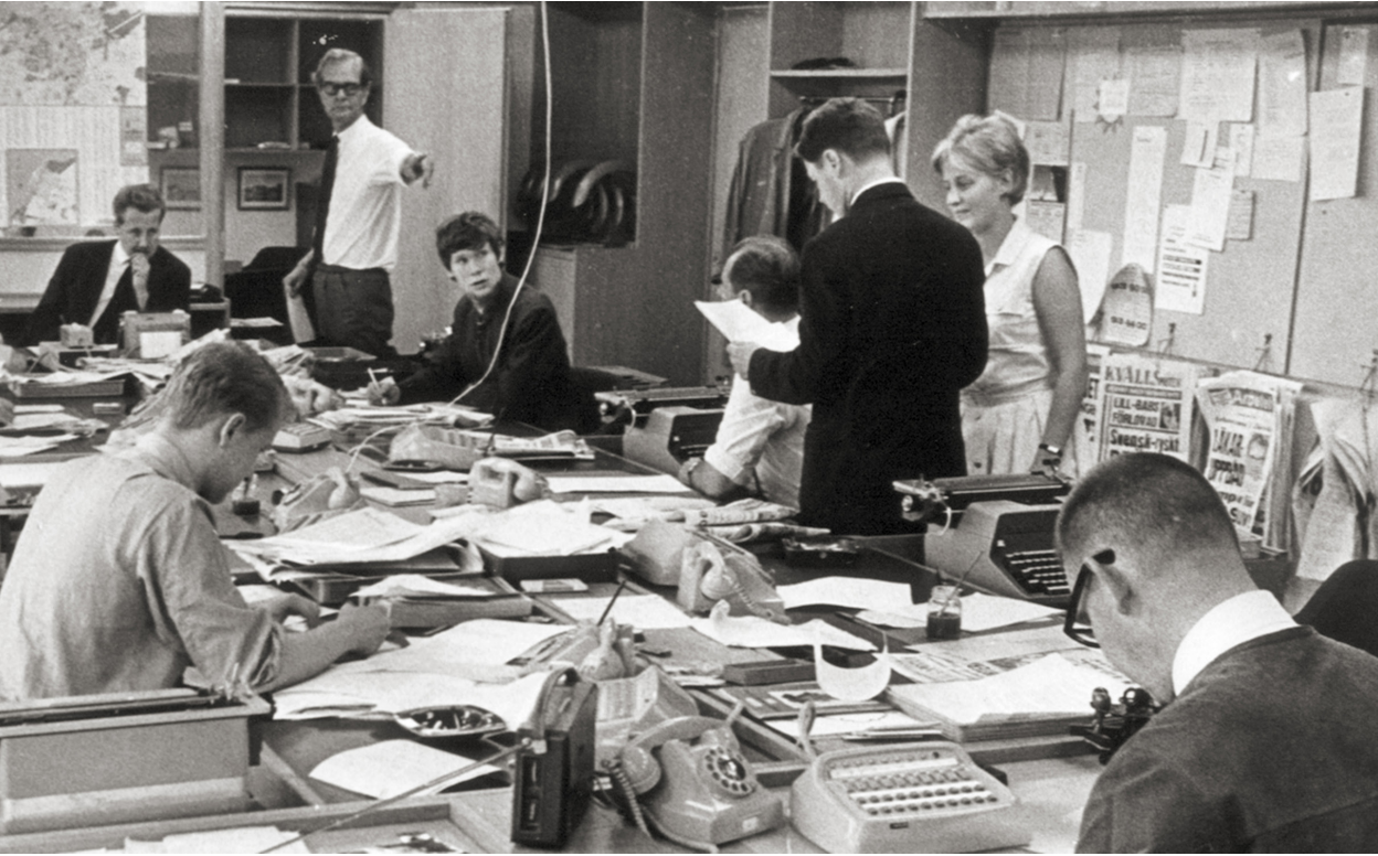
● SYDSVENSKANS CENTRALREDAKTION, 1970.

präglade år hade de bedrivit studier i Lund och många av dem ville gärna fortsätta att vara en del av den lärdomskultur som de hade skolats in i. Sydsvenskans kultursida fungerade här som en sorts sambandscentral för den humanistiska kunskapen.