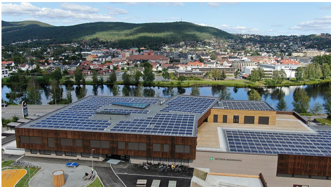
Vestsiden ungdomsskole i Kongsberg ble ferdigstilt skoleåret 2019/202.

Vestsiden Ungdomsskole i Kongsberg (Inderberg, Leikanger og Westskog 2023) (delstudie 6 som har tatt i bruk innovative energiteknologier i skolebygget. Blant annet har det blitt installert solceller på taket, batterilagring, avansert styringssystem, samt planer for hydrogenlagring. Studien gir kunnskap om hva som bidrar til at nye energiløsninger tas i bruk i offentlig sektor.