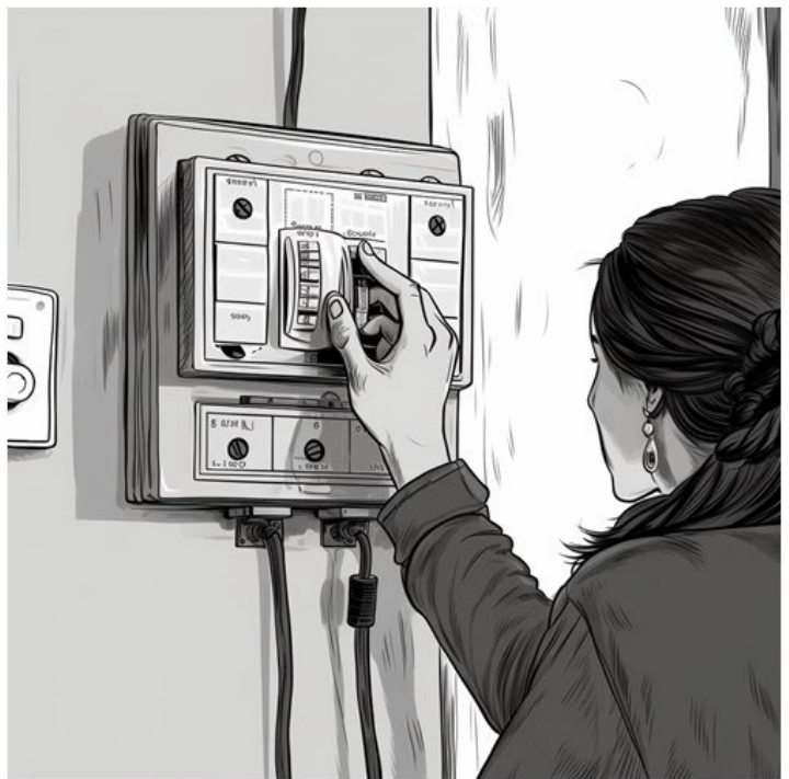
Midjourney/ Creative Commons Noncommercial 4.0 Attribution International License.

begge landene har installert smarte strømmålere, og dette vil bli overvåket av Vassdrags- og energidirektoratet/Reguleringsmyndigheten for energi (NVE/RME) og Energimarknadsinspeksjonen (Ei) (Ei, 2017, p. 8; NVE, 2023). Bakgrunnen for å innføre effekttariffer i begge land er scenarier som viser økt behov for sluttbrukerfleksibilitet i årene fremover. Etterspørselen etter elektrisitet, og viktigere, etterspørselstopper, vil øke