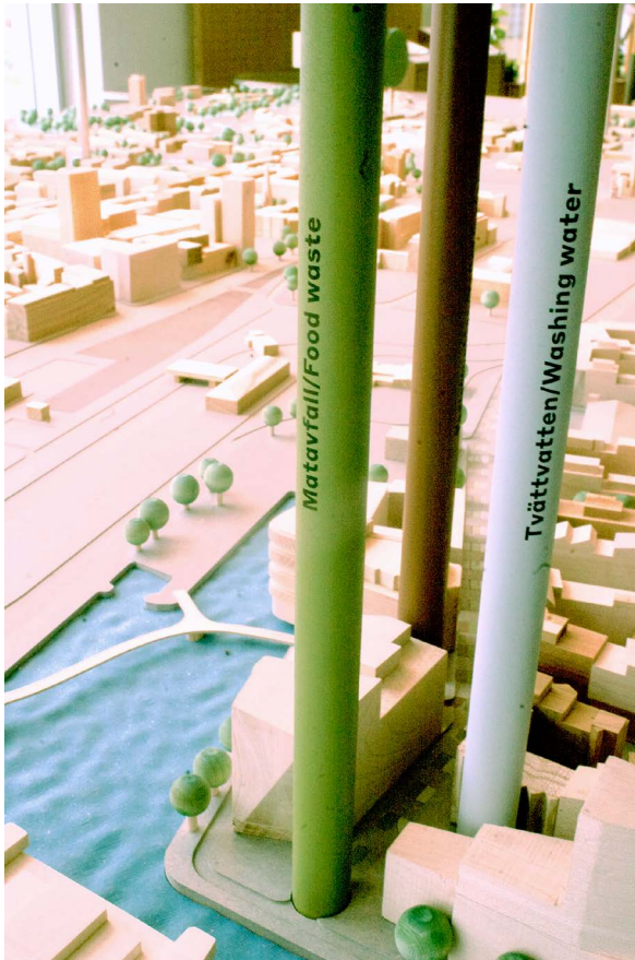
"Tre rör ut". Miniatur av vattenåtervinnings-systemet i utställningen.

Zuo, Q., Zhang, Z., Ma, J., Zhao, C., & Qin, X. (2023). Carbon Dioxide Emission Equivalent Analysis of Water Resource Behaviors: Determination and Application of CEEA Function Table. Water (Switzerland) , 15(3). https://doi.org/10.3390/w15030431