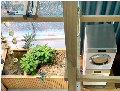
Installationen av en tvättmaskin intill en inomhusodling av blommor, örter och grönsaker, visar symbiosen mellan hushåll och vattenåtervinning i showroom.