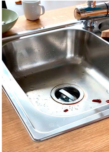
Matavfallskvarnen i diskbänken.