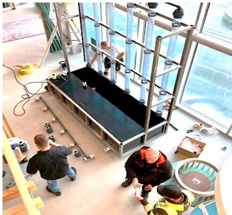
Anläggningen för mikroalgodling installeras under våren 2022.