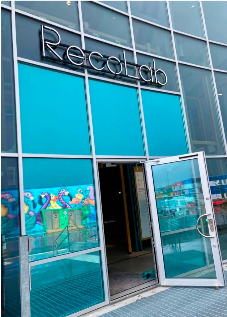
Entrén till RecoLab där återvinning av vatten testas i större skala.

innovativa vattenhanteringen utvinner resurser ur avloppet, till exempel ger den tre gånger så mycket fosfor och sju gånger så mycket kväve jämfört med konventionell avloppshantering. I forskningsmiljön sker tester av rening av gråvatten, för nyttiggörande som processvatten eller som framtida dricksvatten i staden. Det finns även en potential för utvinning av värme samt ökad produktion av biogas från ett koncentrerat och separerat flöde av svartvatten och matavfall.