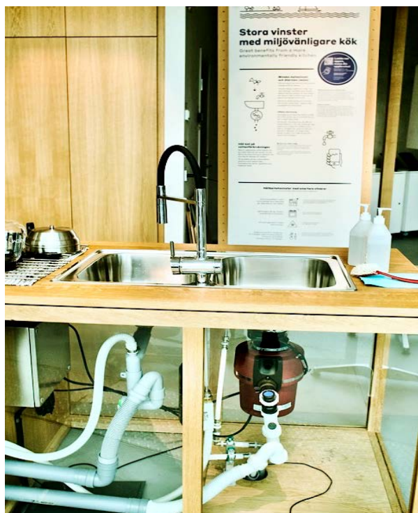
I RecoLabs showroom visas ett tvärsnitt av matavfallskvarnen upp, tillsammans med en beskrivning av vinsterna med ett ”miljövänligare kök”.

De många frågor som respondenterna ställer i intervjuerna visar att de boende fortfarande behöver och vill lära sig mer om tekniken. Ett antal boende gav uttryck för nyfikenhet på hela systemet: ”det är jättekul, så då kanske man kan få lära sig mer om hur hela systemet funkar...” Här kan man notera att ett fungerande handhavande av tekniken är viktigt för att hela systemet ska fungera. Några boende hade själva tidigt stött på problem med matavfallskvarnen, medan andra vid ett par tillfällen hade drabbats av att andra boende i samma hus hade orsakat stopp i systemet. En kommunikationsinsats i form av en broschyr uppmärksammade boende på vikten av att spola vatten i en mindre mängd, i samband med att kvarnen används. Insatsen föreföll lösa dessa problem, och de allra flesta hade därefter inte upplevt återkommande stopp: ”jag har lärt mig hur man kan köra dem där för om de går torrt brinner de upp och går sönder” . Flera beskriver att det handlar om att lära sig använda tekniken på rätt sätt.