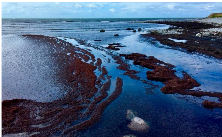
Det mesta av vattnet på jorden är saltvatten. Vattenflöden på sydkusten i Skåne.