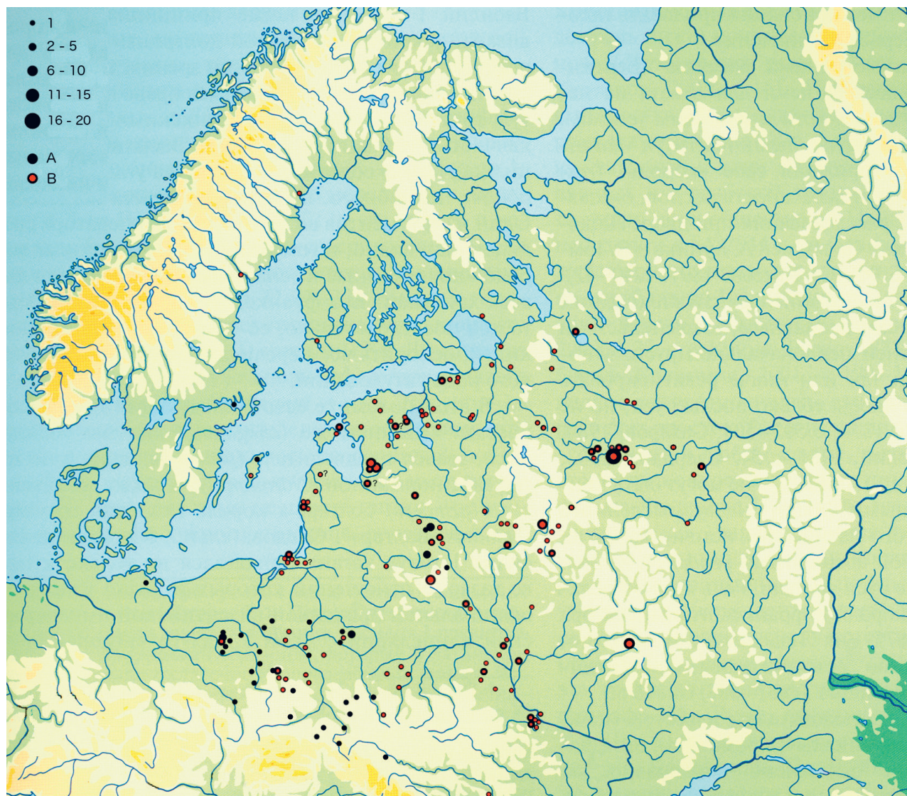
Figur 3. Rusiska stridsyxor i Europa under tidig medeltid, ca 950 till 1150. A = yxor utan kindhål; B = yxor med kindhål. Kartan baserar sig på följande dokumentation: Paulsen 1939; Nadolski 1954; Paulsen 1956; Kirpichnikov 1966; Kivikoski 1973; Lehtosalo-Hilander 1982a, 1982b; Makarov 1990; Lysenko 1991; Heindel 1992; Sitykhau 1997; Kotowicz & Swiatek 2006; Drozd & Janowski 2007; Terskij 2008; Tomentchuk 2008; Kotowicz 2011; Kurasinski & Skóra 2012; Makarov et al. 2013; Plavinskij 2014. Karta Mats Roslund med grundkarta från Makarov 2012: 15.

dessa har angetts till slutet av 900-talet, men koncentrationen ligger framförallt i 1000-talet. Dateringen är intressant eftersom två rurikidprinsar var ingifta i piasterernas kungahus i första och andra halvan av århundradet, Sviatopolk Vladimirovich (ca 980–1019) med en dotter till Boleslav I, och Iziaslav av Turov (1024–1078) med en släkting till Boleslav II. Piasterernas kungar var också de gifta med rurikidernas döttrar. Ömsesidiga stridigheter över gränsområdet rikena emellan kan också ha fört yxor mellan hirdarna.