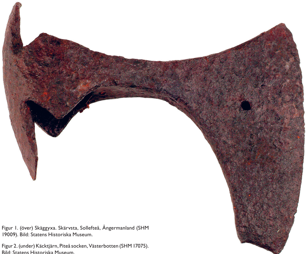
Figur 1. (över) Skäggyxa. Skärvsta, Sollefteå, Ångermanland (SHM 19009).