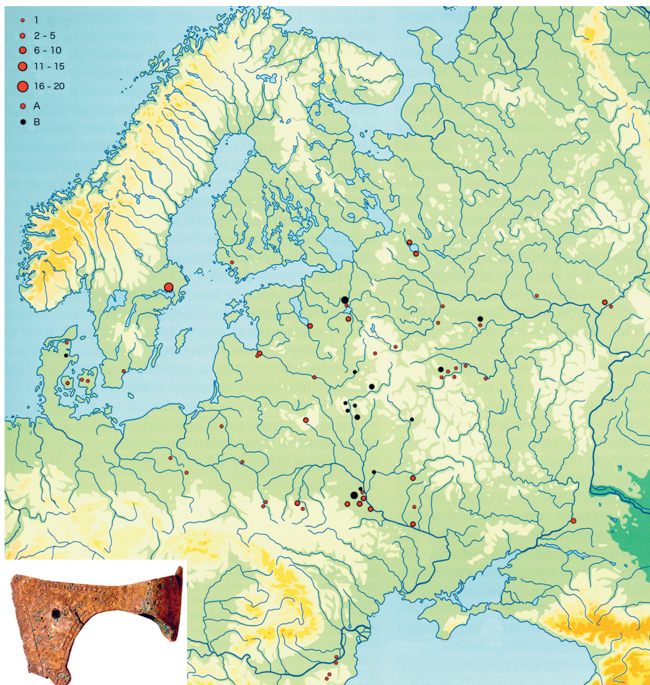
Figur 4. Miniaturyxor av Makarovs typ I i Europa. A = fynd med exakt platsangivelse; B = fynd endast med angivet landskap (oblast/"län" eller rajon/"kommun"). Kartan baserar sig på följande dokumentation: Paulsen 1939; 1956; Makarov 1990; 1992b; Roslund 1995; Edberg 1999; Zacharov 2004; Kucypera et al. 2010; Korsjun 2012. I Korsjuns publikation redovisas ytterligare fyra yxor från odefinierade orter i västra Ukraina, samt tio från Ryssland. Dessa har inte placerats in på distributionskartan. Nyttillkomna är fyra yxor i Danmark, där tidigare endast en var känd (Hjælsølille). Ytterligare två är kända från detektorhemsidan www.fibula.dk , men de är hittills utan proveniens. Karta Mats Roslund med grundkarta från Makarov 2012: 15.

(Makarov 1992b; Kucypera et al. 2010). Spridningsbilden är glesare än för de stora stridsyxorna. Koncentrationen till det nord – sydliga flodstråket mellan Novgorod och Kiev utmärker sig. Likaså går en anknytning in i det polska området. Några få hittas invid Donau i det Bulgariska riket. Ett tätare kluster kan anas i de volgafinska meria- och muromgrupperna mellan Volga och Oka. Av särskild vikt är kontexterna vid Beloesjön i Ryssland. I mansgravar från slutet av 1000-talet har befolkningen lagt ner både riktiga