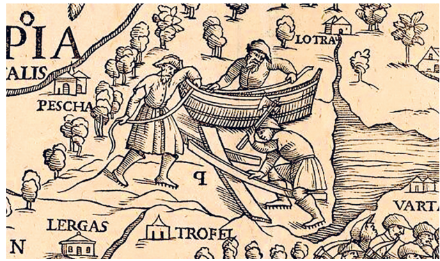
Figur 5. Sydd båt avbildad på Olaus Magnus ”Carta Marina”.

I sökandet efter möjliga vägar genom svagt befolkat land mellan Ladogasjön och Bottenviken är det möjligt