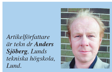
Artikelförfattare är tekn dr Anders Sjöberg, Lunds tekniska högskola, Lund.

ttersom metoden bygger på att RF-profilen mäts över hela hålets djup behöver inte heller något foderrör monteras i borrhålet. Detta är två markanta förenklingar i arbetsutförandet som skiljer sig från normala borrhålmätningar. Vanligtvis måste mät hålet borraras och fodras tre dagar innan monteringen av givaren kan ske, enligt www.rbk.nu . Denna förenkling innebär att mättekniker som använder OE-metoden bara behöver åka ut till mätplat-