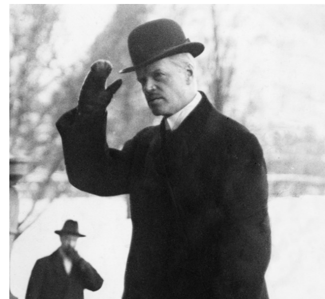
Justitieminister Karl Gustaf Westman: inte på läsarnas sida.

I denna ännu gällande tryckfrihetsförordning försökte man införa försäkringar mot den typ av missbruk som ägt rum under kriget. Censur förbjöds även i krigstid och de sakkunniga betonade den i regeringsformen uttryckta principiella rätten att sprida skrifter. Den rättsliga konstruktionen gör också att tryckfriheten kan utökas men inte inskränkas utan grundlagsändring. En nyhet var den så kallade meddelarfriheten som ålägger journalister att skydda uppgiftslämnarens identitet. Denna meddelarfrihet har successivt reducerats, senast 2022.