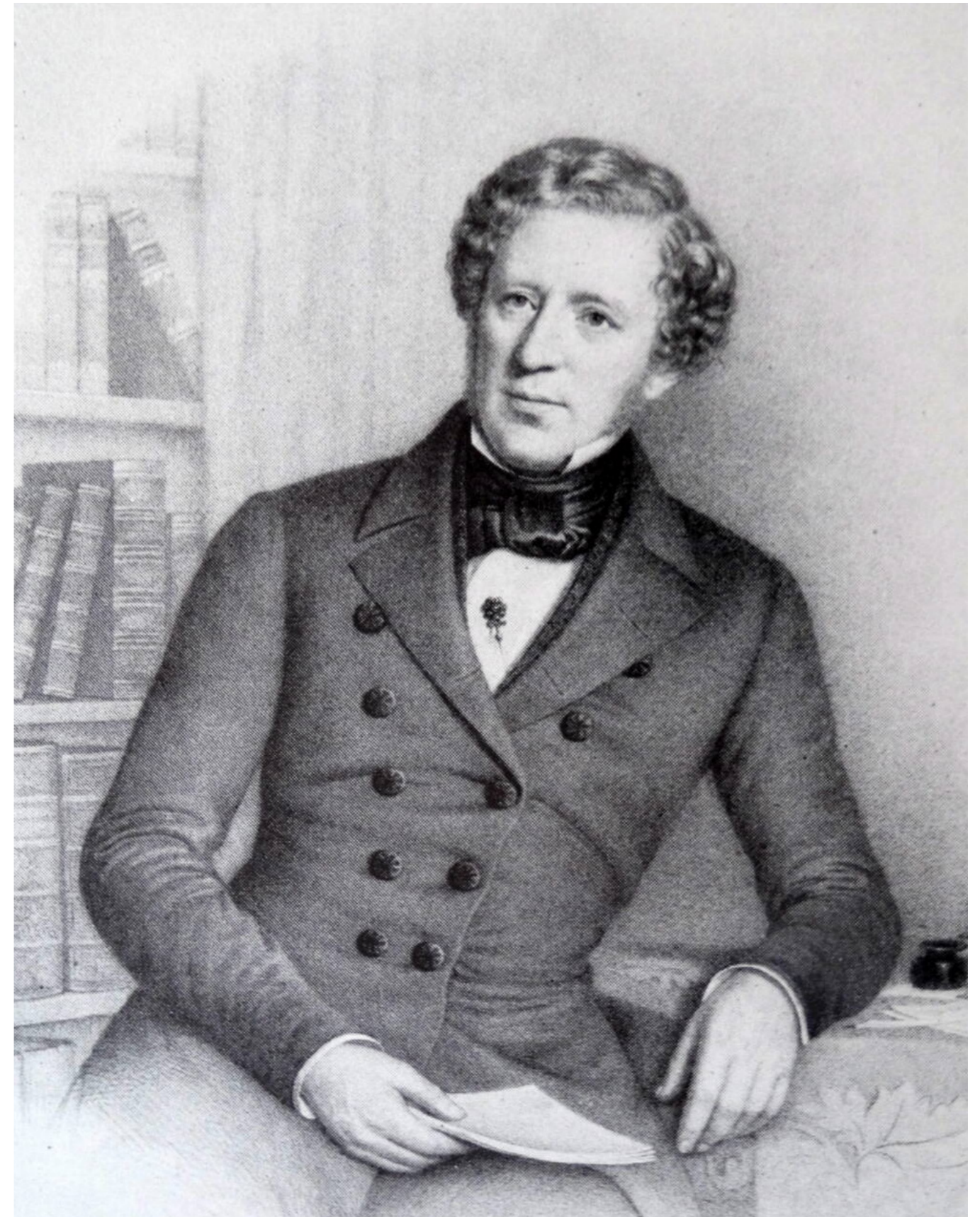
Censurfriende: Lars Johan Hierta.

Redan 1939 lät regeringen via Justitiiekanslern väcka 19 åtal mot dagstidningar varav 17 ledde till fällande dom. Året därpå väcktes 15 åtal, men 12 av dem ogillades och regeringen måste hitta andra vägar att undertrycka de tidningar som ansågs äventyra rikets säkerhet. I februari 1940 infördes det så kallade transportförbudet, som innebar att tidningar och tidskrifter kunde förvägras distribution med allmänna transportmedel – post, järnväg, buss – om de tidigare hade fällts för tryckfrihetsbrott. Detta började genast tillämpas mot de fyra tidningar som ägdes av Sveriges