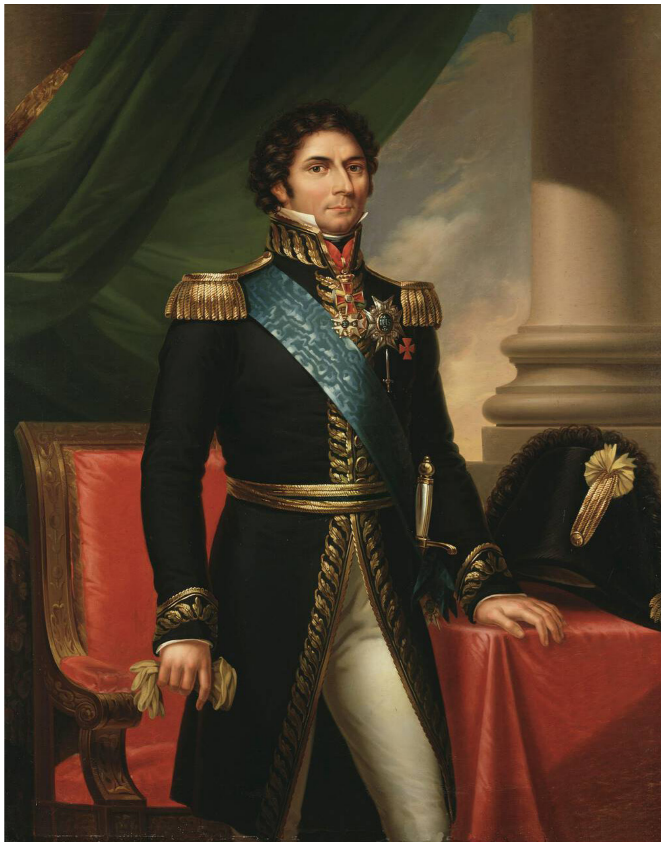
Censurivrare: Karl XIV Johan.