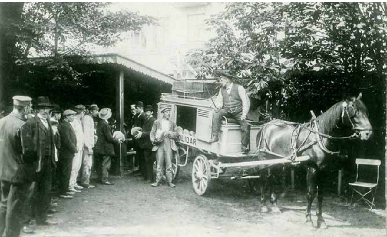
Brödutdelning åt de strejkande i Malmö Folkets park 1909.

16 län. Kommerskollegiums rapport betonar samtidigt hur denna sorts omfattande begränsningar i allra högsta grad var politiskt motiverade: