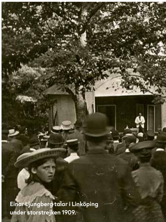
Einar Ljungberg talar i Linköping under storstrejken 1909.

Storstrejken samordnades av en nationell sammanslutning av fackförbund – Landsorganisationen (LO) – där drygt 162 000 medlemmar samlades i 2 172 avdelningar. 3 Arbetarna företrädde politiskt av ett eget parti och hade etablerat en rad allierande kulturella och politiska