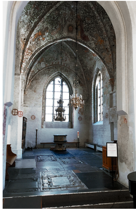
Figur 1a & b. S:t Petri i Malmö med vitkalkade väggar och valv i långhuset, men färgrika kalkmålningar i Krämarkapellet. Foto: Jes Wienberg, augusti 2022.

Det är en utbredd uppfattning att kyrkornas väggar och valv målades vita vid reformationen. Uppfattningen återfinns i böcker, artiklar, på hemsidor och i många andra sammanhang. Ändå har det framhållits gång på gång att reformationens överkalkning är en myt. När blev då kyrkornas bilder överkalkade – i Malmö, i Skånelandskapen och i Norden? Och varför överlever myten?