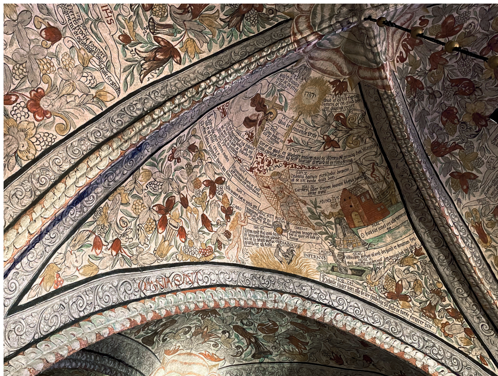
Figur 3. Kalkmålningarna i Ronneby från 1586 – människan mellan himmel och helvete. Foto: Bodil Petersson, juli 2021.