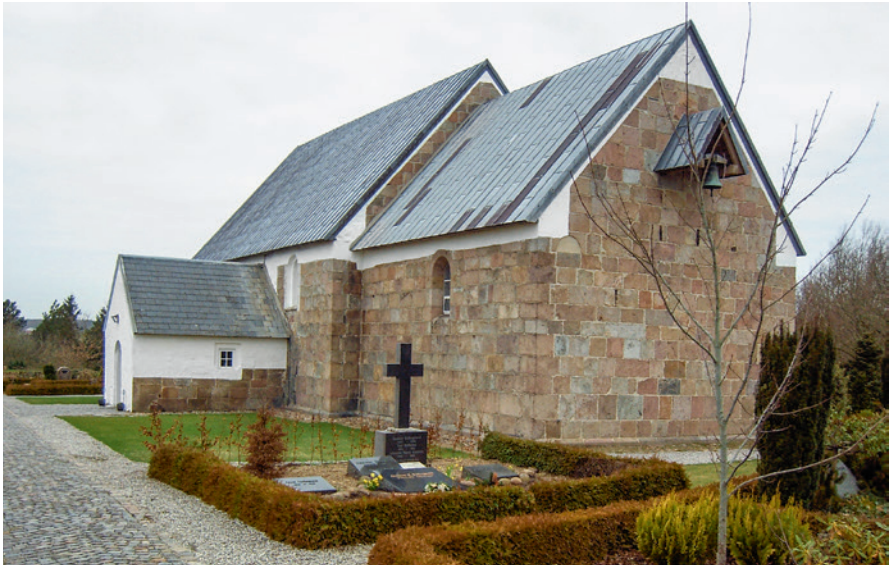
Fig. 1. Hover Kirke i Vestjylland.