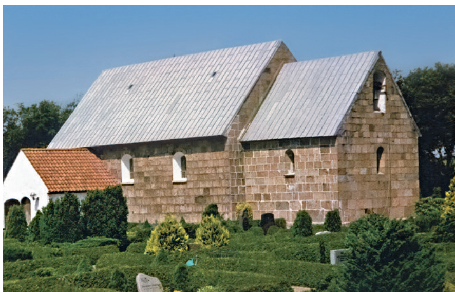
Fig. 2. Sædding Kirke i Vestjylland. – Foto: J. Wienberg, juli 1994.