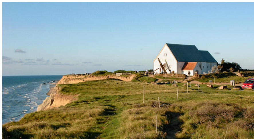
Fig. 5. Mårup Kirke i Nordjylland, som fik sengotiske tilføjelser, en tresidig afsluttet øst-udvidelse og et vestårn, men som blev reduceret omkring 1700. Ødekirken blev undersøgt, nedtaget og fjernet i perioden 2008-15 i anledning af truslen fra havet. – Foto: T. Bertelsen, Over Byen Arkitekter, København, august 2008.

I Østdanmark, som var domineret af aristokratiske godser, fik en del kirker tidligt tårn. I Vestdanmark, hvor der var færre godser, forblev tårne sjældne. Først når kirker var blevet et kollektivt ansvar, begyndte bønderne at prioritere tårnbyggeriet. 19 De fleste kirker har siden gennemgået talrige forandringer, hvor tilføjelsen af et sengotisk tårn er et typisk fænomen. En baggrund for det omfattende byggeri i 1400-tallet og frem til reformationen kan være en økonomisk højkonjunktur, hvor forfaldne kirker nu atter blev restaureret og taget