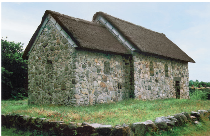
Fig. 6. Hjerl Hedes kullede kirke i Jylland opført 1949-50. – Foto: J. Wienberg, juli 2005. The open-air museum Hjerl Hede's towerless church built in 1949-50.

beliggenhed som den lille Pederstrup Kirke, der knejser ensomt i et vældigt bakkelandskab over Rødsø. Set som helhed virker den kullede, beskedne kirke faktisk bedre som eksempel på en i det ydre næsten uændret romansk landkirke end den så ofte fremdragne Hover i Nordvestjylland. 49