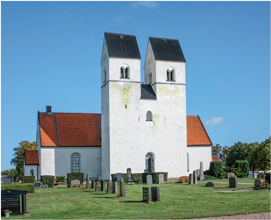
Fig. 3. Färlöv kirke i Skåne med tvillingetårne, hvor en stenbygning fra en storgård er blevet udgravet på marken vest om kirken. – Foto: A. Ohlsson, Ystad, september 2011.

Färlöv church in Scania with twin towers. Remains of a stone building from a manor have been excavated in the field to the west of the church.