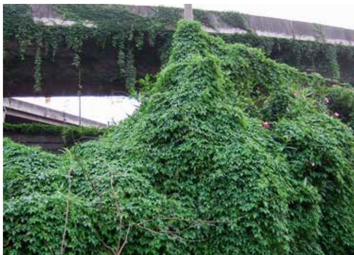
FIGUR 5. Trots stora ansträngningar är det svårt att hålla Ipomoea cairica borta ens från muren som omger vårt universitetsområde i Kanton.

Flera Ipomoea -arter odlas som prydnadsväxter. Mest känd i Sverige är blomman för dagen I. tricolor . Namnet blomman för dagen används ibland också på andra Ipomoea -arter, som purpurvinda I. purpurea och kejsarvinda I. nil (figur 6). Den senare har spelat en viktig roll i forskningen om växters fotoperiodism. Den är liksom flertalet Ipomoea -arter en kortdagsväxt, och en enda sekunds belysning mitt i natten är tillräckligt för att förhindra blomning.