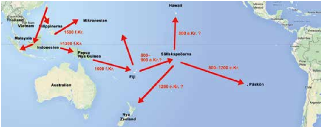
FIGUR 1. Polynesiens befolkande enligt Matisoo-Smith (2015).

levande människor och från arkeologiska fyndplatser, men också på andra sätt, till exempel via medförda växter.