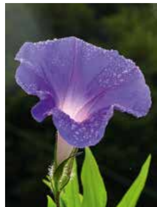
FIGUR 6. Blomman för dagen, purpurvinda och kejsarvinda ( Ipomoea tricolor , I. purpurea , I. nil är omtyckta prydnadsväxter.