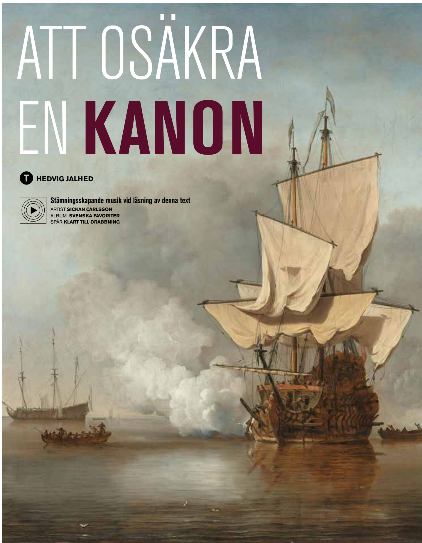
BILD: RIKSMUSEUM, AMSTERDAM, The Cannon Shot, Willem van de Velde (II), c. 1630

ARTIST SICKAN CARLSSON ALBUM SVENSKA FAVORITER SPÅR KLART TILL DRABBNING