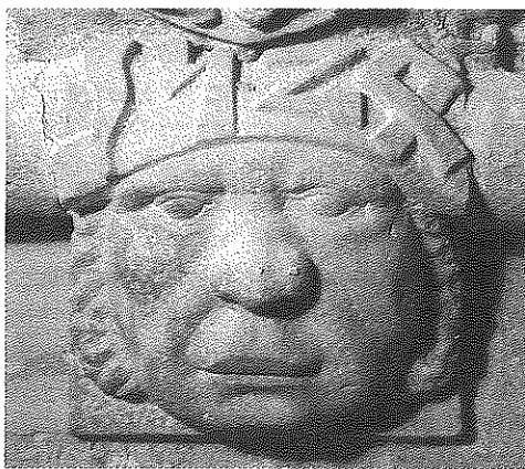
Bild 7. Porträtt i västra valvbågen, daterat 1524.