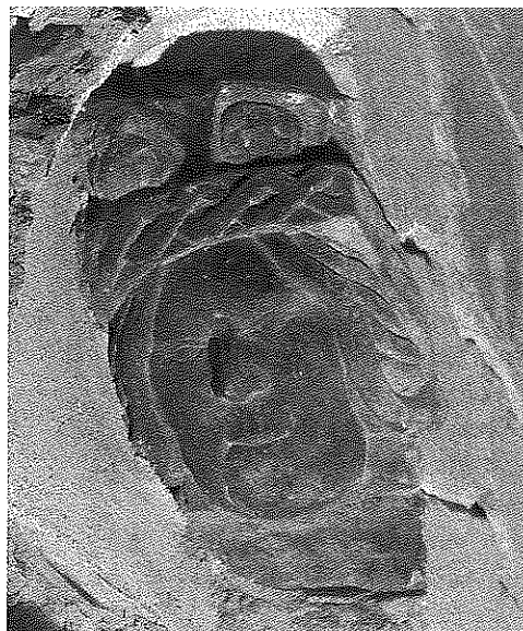
Bild 2 och 3. Ansiktena i den forna fönsterbågen, belägna 14 meter ovan golvet.