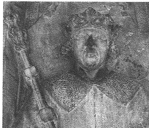
Bild 9. Van Dürens porträtt av kung Hans från Köpenhamns slott 1503. Näsan avslagen och ersatt med en som inte motsvarar originalet.

del, syns vid en närmare granskning ett nästan groteskt ansikte vilket föranledde Weibull att beteckna den som en teatermask. 16 Om den självvironiske och folkligt humoristiske byggmästaren överhuvudtaget efterlämnade något självporträtt, bör detta vara det mest sannolika. Jag håller det emellertid för mer troligt att detta är ett postumt porträtt av den 1513 avlidne kung Hans, vilken på samtliga kända porträtt, inte minst de gjorda av van Düren, uppvisar en snarlik frisy. Pannbandet och siffrorna tycks istället för en bindel snarast föreställa en stiliserad krona. Kronans form uppvisar likheter med den på det förmodade porträttet av drottning Sophie i fönsterbågen, dels med avseende på graden av abstraktion, dels med tanke på att båda i likhet med Kristians baret är tvärt avhuggna i sidorna. Det finns också fysiska likheter med van Dürens övriga porträtt av kung Hans. Det äldsta av dessa pryder en av de bislagsstenar som uppställdes framför trappan till Köpenhamns slott 1503 (bild 9), vilket Rydbeck 1907 med övertygande argu-