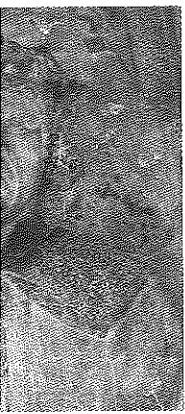
...ing Hans från Köpen- och ersatt med en som

Dürens produk- trättet i takvalvet i bislagsstenen är pryder den östra som befinner sig i till 1513 (bild 8). trätt är detta fram- rundmall; en face t med en furstlig d den på bislags- krage. Porträttet till identiskt skulp- risyren, ögonens de tunga ögon- dform, den breda kinderna och läp- ppet tyder således a person på samt- tt, avbildade med ellanrum och med de personliga an- 8 och 9).