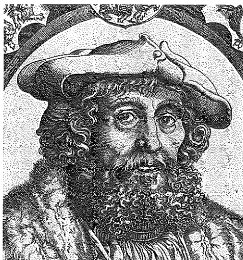
Bild 6. Kristian II enligt gravyr från 1529, utförd efter tecknad förlaga av Jan Gossaert. 15

enhuggarmärken. lander familjens ård som oansen- reibulls antagande tt regentpar mer taren tidigare på med avbilder och/ le förevigat både ans och drottning i att det måste ha d modeller, men öre 1513 utan från rättet har i själva ka likheter med ter ärkebiskopens nu inte krönte 53 ).