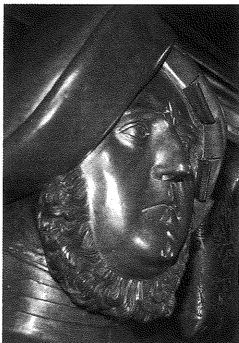
Bild 4. Fredrik som hertig av Schleswig-Holstein-Gottorp. Porträtt i brons från den kenotaf i Bordesholms klosterkyrka som tillverkades i samband med hans första hustru Annas av Brandenburg död 1514.