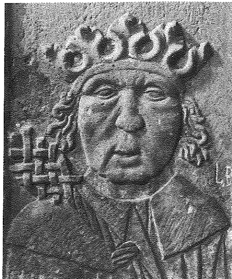
Bild 8. Van Dürens förmodade porträtt av kung Hans på brunnskarret i kryptan, daterat 1513.