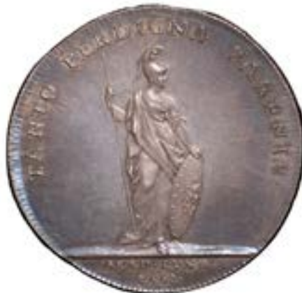
1733 års medalj (åtsida och frånsida)