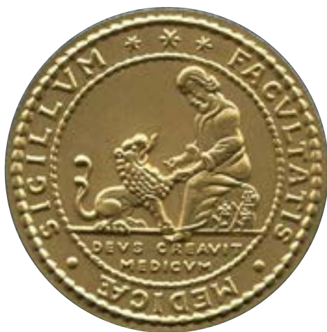
Medicinska fakultetens medalj i guld.

Juridiska fakulteten har – bortsett från broschyrens formulering "personer som särskilt gynnat och stött juridisk forskning och utbildning vid Lunds universitet" – ännu inget särskilt reglemente om på vilka grunder de båda medaljerna i sammanlagt fyra olika valörer ska delas ut. Fakultetens motto kan kanske vara vägledning nog? Suum cuique [tribuere], [att ge] åt var och en sitt .