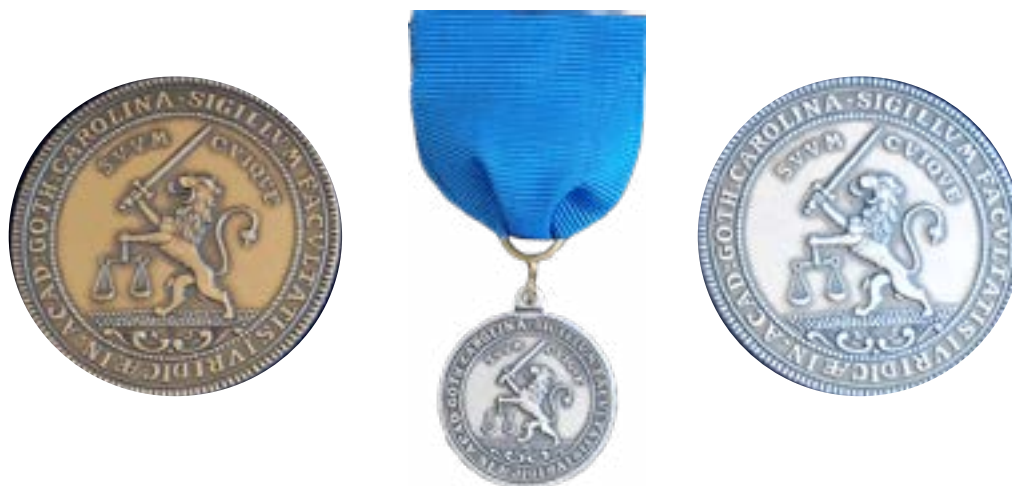
Juridiska fakultetens medaljer