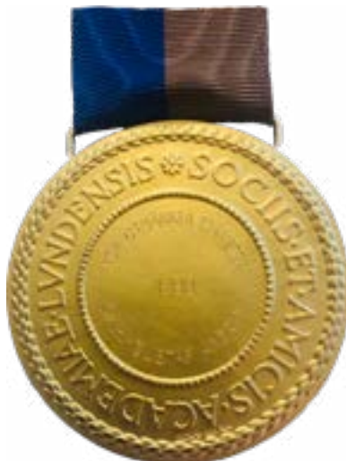
1960 års belöningsmedalj i guld