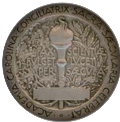
1918 års medalj i silver