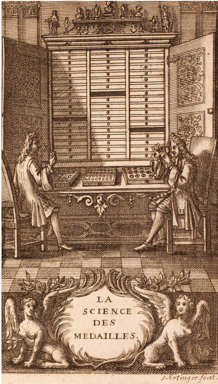
6. Franz Ertinger, Louis Jobert La Science des medailles , Paris 1739, gravyr (1710), Foto: Bayrische Staatsbibliothek, München.