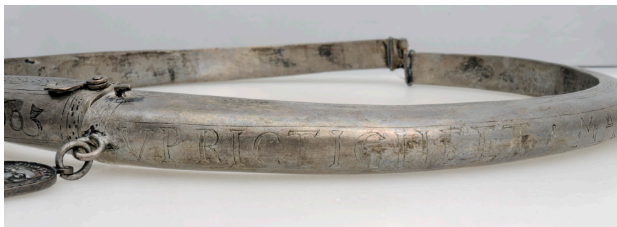
3. Okänd konstnär, gjuten i silver, Foto: Gabriel Hildebrand. Ekonomiska Museet, Kungliga Myntkabinettet/SHM (CC BY).