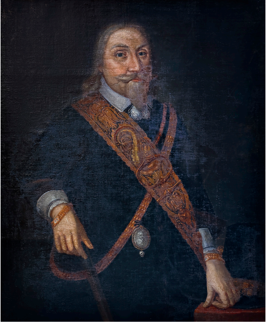
4. Okänd konstnär, olja på duk, 1634, Adelsnäs, Foto: Lars Heijdenberg.

Under kungens levnadstid tillverkades det en uppsjö av medaljer som avbildade honom. Kungens popularitet bidrog till att många ville äga en bild av honom och efter hans död avtog inte kravet på konterfej. 11 De kunde användas för att ära den döde kungen, framhäva att Gustav II Adolf hade stridit för Gud och den rätta tron och därigenom också fungera som ett konfessionellt ställningstagande.