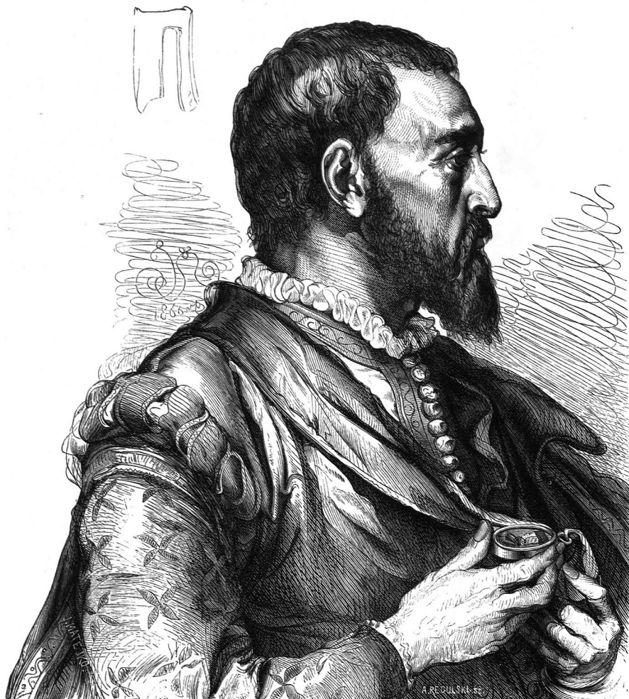
2. Jan Matejko, Jan Tęczyński , ca. 1866, Foto: Wikimedia Commons.

genom verklighetstroga porträtt och att de hade myntats till speciella begivenheter, exempelvis en seger. Metallen, guld, silver och brons, bevarade på så sätt både ansiktet och händelsen för framtiden som nu kunde studeras av renässansens lärda män och kvinnor. 5 Mynten betraktades som historiska källor och gav även anledning att sträva efter att skapa en liknade hållbar historieskrivning. Medaljen, ett portabelt monument i miniatyr, skulle vara lika varaktig som metallen den gjordes i och med hjälp av inskriptioner, klädsel, heraldik och emblem skulle föremålen berätta för betraktaren vem