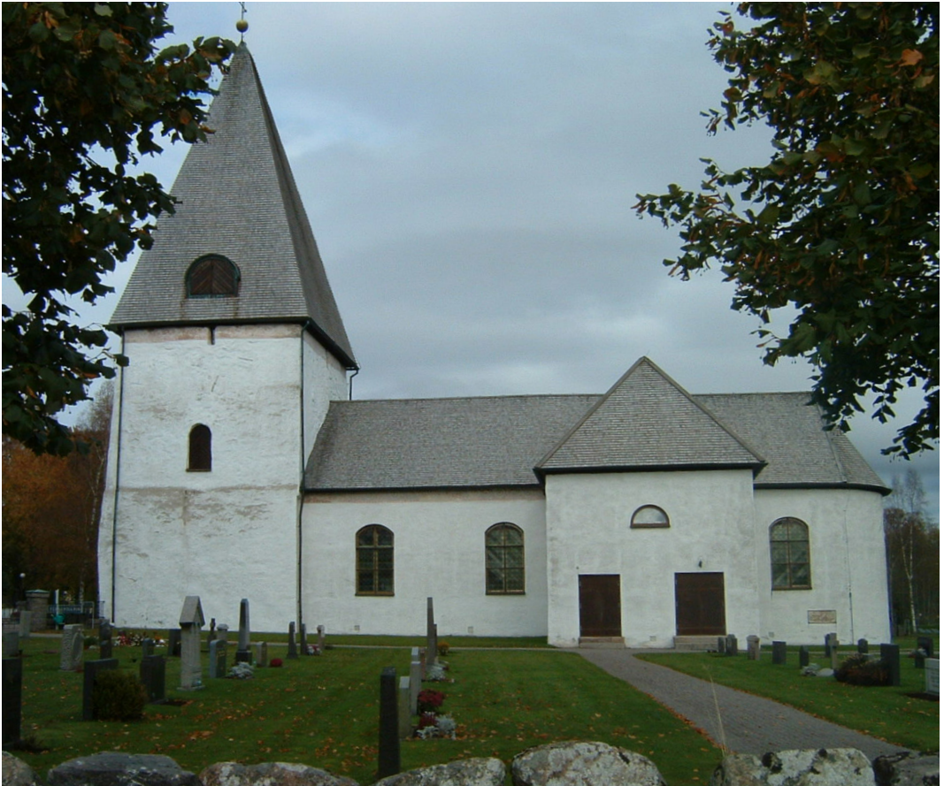
Bergunda kyrka med det imponerande senmedeltida västtornet. Foto Martin Hansson 2004.

men tornet kan ha uppförts av Arvid Trolle. 26 Om en sådan tolkning stämmer byggdes tornet nog tidigast i samband med att släkten Trolle förvärvade Bo Stenssons sätesgård i kyrkbyn. Tornet är då en tydlig materialisering av det maktskifte i lokalsamhället (kyrkbyn) som ägt rum. Möjligen skedde tornbygget samtidigt som det stora stenhuset på Bergkvara uppfördes på 1470-talet. 27