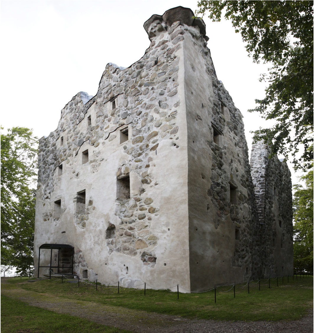
Ruinen av stenhuset vid Bergkvara. Foto Jörgen Ludwigsson, 2011.

högsta klass, värdigt en man med ambitioner och makt som sträckte sig utanför landets gränser. Den både symboliska och konkreta militära makt som Arvid Trolles Bergkvara utstrålade i sin samtid kan inte överskattas. Arvid Trolle dog 1505, men Bergkvara fortsatte att fungera som lokalt maktcentrum långt fram i tiden. Inte ens i hemsocknen Bergunda var dock Bergkvara den enda sätesgården.