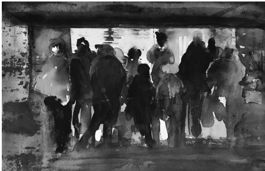
Fältetnografi 1: Att närma sig ett fält. Köbildning utanför biståndsbutiken.

Trots ihärdigt regnande är kön till butiken lång idag denna tisdag. Tio i tolv går människor ur sina bilar och kön blir ännu längre. Vi hukar under regnet. Det småpratas i kön och bland männen (de lite äldre som alltid verkar stå längst fram) kommenteras tiden som går och vilka som ännu inte dykt upp. På slaget tolv öppnas dörrarna. När vi kunder beslutsamt (men ändå stillsamt) väller in tas vi emot av en man ur personalen som räcker oss varukorgar. Han hälsar samtidigt välkommen och det känns lite speciellt att bli tilltalad på det sättet.