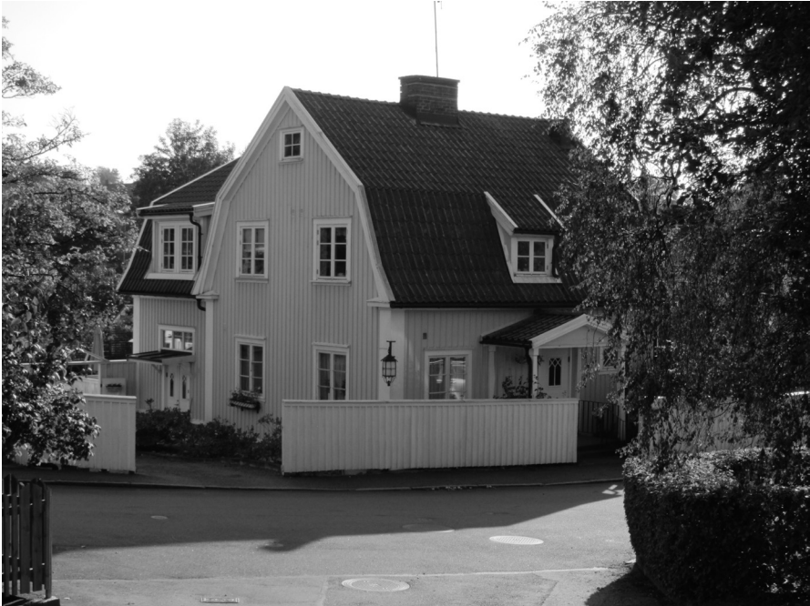
Hus präglad av 20-talsklassicistisk stil med stående lockpanel, spröjsade fönster och signifikanta hörnpilastrar.

verkare och under sin fritid lagt ner många timmar på olika förnyelsearbeten. Alla medger att upprustningen blev både dyrare och tog mer tid än vad de kunde föreställa sig när de förvärvade husen. Flera erkänner att de aldrig kommer att köpa ett annat hus i framtiden som kräver lika omfattande reparationer. Ändå säger sig ingen ha ångrat husköpet, eftersom de är mycket nöjda med att bo i sina gamla Ekebackshus med moderniserade kök och badrum, som i vissa fall fått äldre stilmarkörer, vilket också framgår av ett hemma hos-reportage (Truelsen 2018).