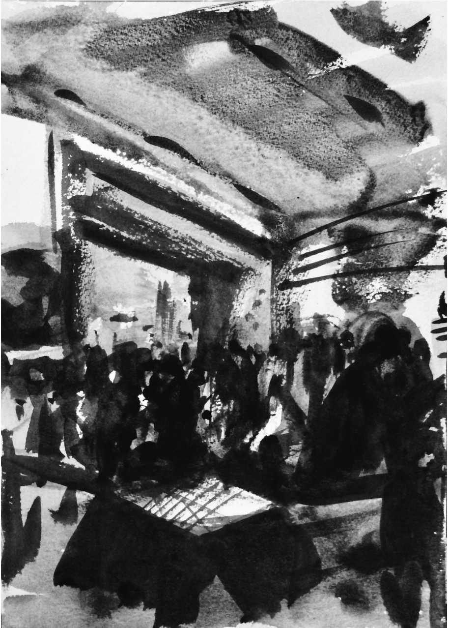
Fältetnografi 2: Begagnatmarknaden kan vara en svårorienterad destination.