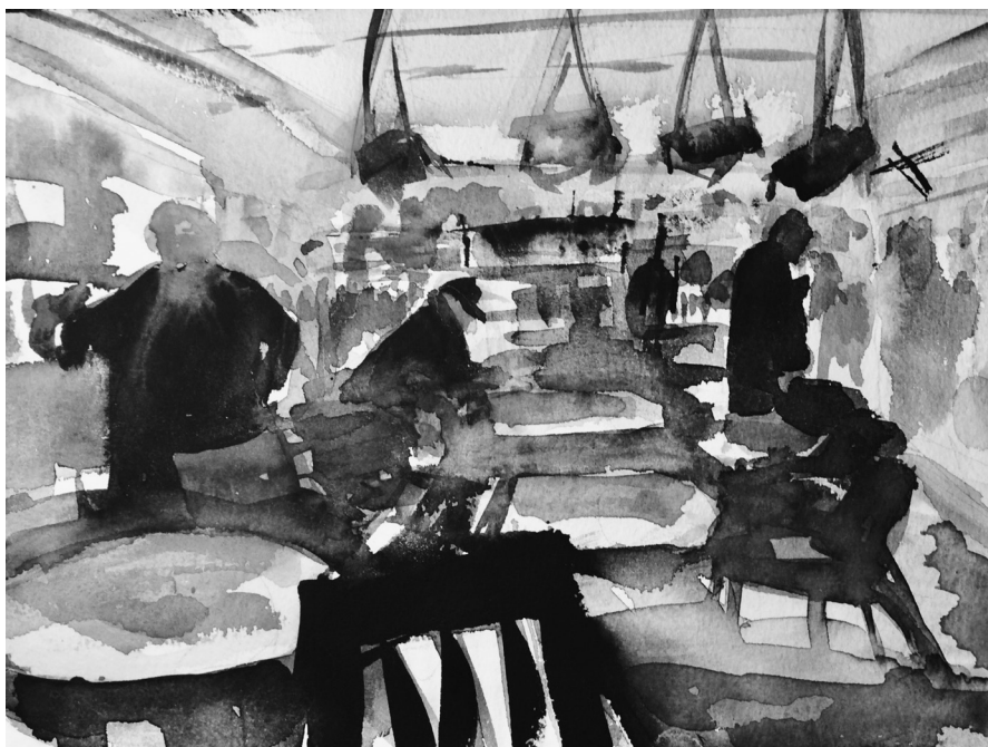
Fältetnografi 3: Möten mellan människor, ting och olika erfarenheter.

av omsättningen hamnar i mer cirkulära system som biståndsbutiker och olika marknader för begagnat och återbruk. Även om återbruk uppfattas som ett hållbart alternativ till överkonsumtion pekar mitt empiriska material på att det både är svårt och tidskrävande att handla begagnat. Och trots den pågående omvandlingen av många biståndsbutiker till mer traditionella butikskoncept upplever många konsumenter att det kan vara motbjudande, eller rent av omöjligt, att ta del av erbjudandet och handla i andra hand. I glappet mellan olika motiv och praktiker får det begagnade olika betydelser. Biståndsbutiken som fysisk destination blir en arena för möten mellan människor och ting, men också för möten mellan olika intressen, förutsättningar och villkor.