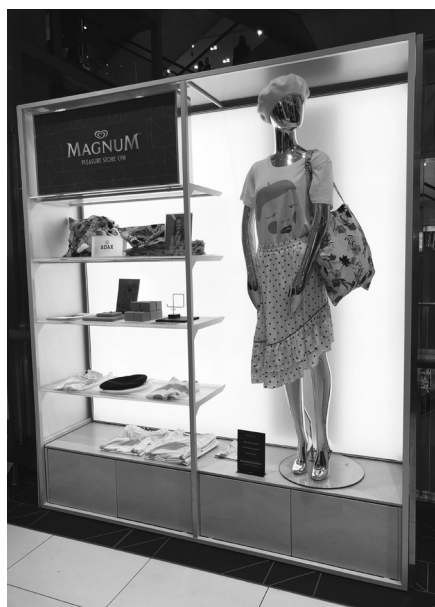
Magnum Pleasure store, Magasin, Köpenhamn 2018. Bettet hänger med på vänstra bilden.

unna sig att ge sig hän i konsumtion av feminina lyxattribut som designerkläder och smycken. Det är en del i vad reklamforskaren Michelle Lazar (2016, 2009) kallat "entitled femininity" och som ofta förekommer i samtida reklam där samband upprättas mellan att unna sig konsumtionsvaror och en form av feminism, ofta kallad postfeminism, där konsumtion ses som en (kvinnlig) rättighet till självförverkligande (se också McRobbie 2007, Negra & Tasker 2007). Men genom att bjuda in kvinnor (eller konsumenter) till att skapa sin egen glass kan kampanjen tolkas som att den vill ge ett budskap om att sudda ut distinktionen subjekt/objekt och produktion/konsumtion. Konsumenten blir det subjekt som skapar glassen och är då inte längre en passiv konsument av en produkt skapad av marknaden; att vända på den roll som kvinnor oftare tilldelats än män, det vill säga rollen som passiv konsument, kan på så vis ges mening som lyx. Genom att skapa osäkerhet kring skillnader mellan objekt och subjekt blir kampanjen därmed också ett sätt att försöka hantera de komplexa betydelser av femininitet som samtiden – och inte minst betydelser av lyx – innehåller.