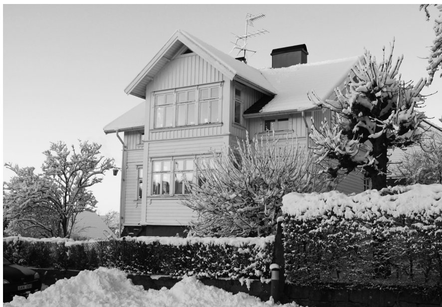
Materialiteten är bärare av ett dolt kulturarv kring levnadsvillkorens förändringar över tid.

med skilda förutsättningar och nådde olika långt. Å ena sidan har jag hört talas om en sjökaptan som köpte en färdigbyggd villa på 1920-talet, å den andra en arbetarfamilj som bodde i en enkelstuga med flera barn innan ett större hus blev uppfört på tomten, vilket i likhet med stugan förverkligades genom självbyggeriverksamhet. Samma skötsamhetsideal som präglade hyresgästerna i landshövdingehuskvarteren praktiserades på Ekebäcksberget (jfr Brembeck 1988:32–34). Ett sätt att få in mer inkomster var att hyra ut lägenheter. Men hyresintäkterna kan inte ha motsvarat förväntningarna då 1930-talets depression bidrog till arbetslöshet och ryktet om fattigdomen på berget spred sig (jfr Olsson 1996:64). Vid en rundvandring i dagens Ekebäck är det svårt att föreställa sig den misär som en del hushåll då var drabbade av. Lättare är det att finna spåren efter de strävsamma arbetarfamiljernas mödosamma insatser för att anlägga stenmurar och trädgårdar på kuperade tomter. Gamla hus och ting utan personliga provenienser eller tydliga anspelningar på vardagslivet ger en vag känsla av något mycket avlägset, samtidigt som dessa fysiska artefakter är påtagligt närvarande. Materialiteten är bärare av ett dolt kulturarv kring levnadsvillkorens förändringar över tid.