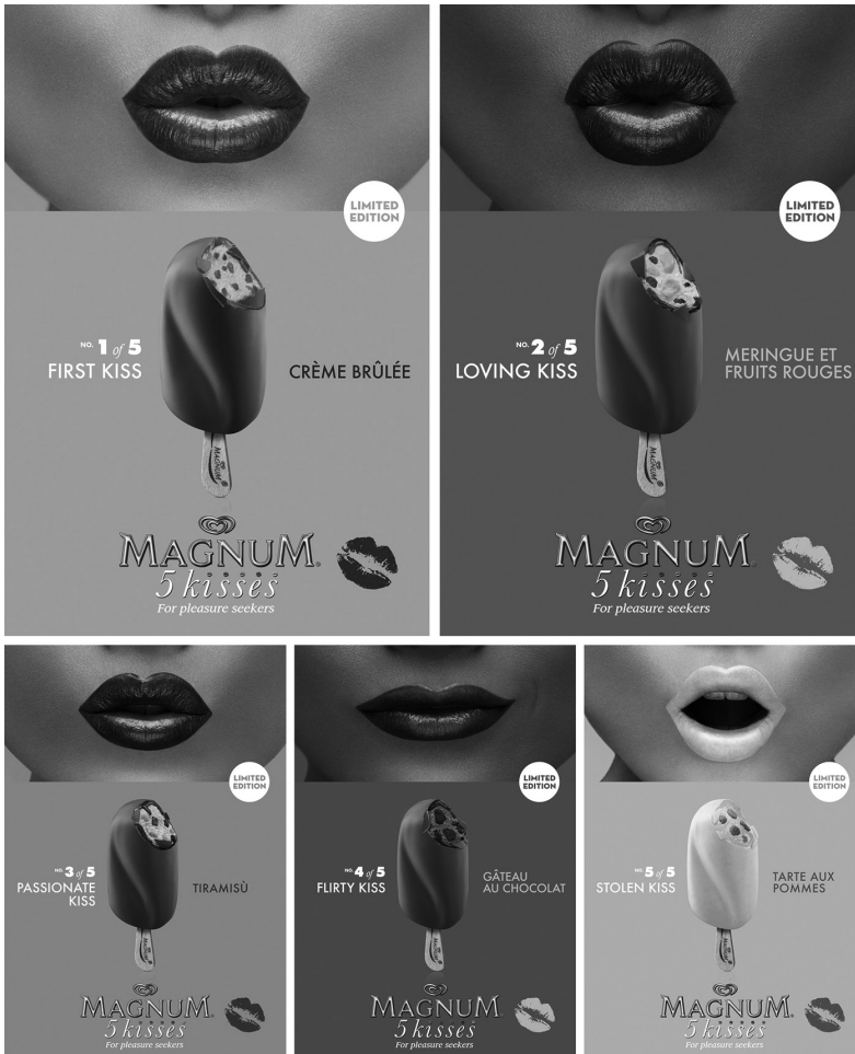
”5 kisses”.

het, utan identitet är, i enlighet med den emotionella lyxens budskap om frihet från sociala hierarkier, flytande och föränderligt. Därför behöver vi konsumenter många produkter för att representera oss. Många femininiteter är alltså en lyxmarkering, både genom att mängd i sig betecknar lyx och att valbarhet och frihet från sociala konventioner gör det. Genom att presentera olika kvinnotyper framställs femininitet vidare som något som i sig är föränderligt och där konsumenten tilltals som individ med kontroll över det sociala spelet. Det är återigen den emotionella lyxens budskap om att inte låta sig begränsas av sociala konventioner