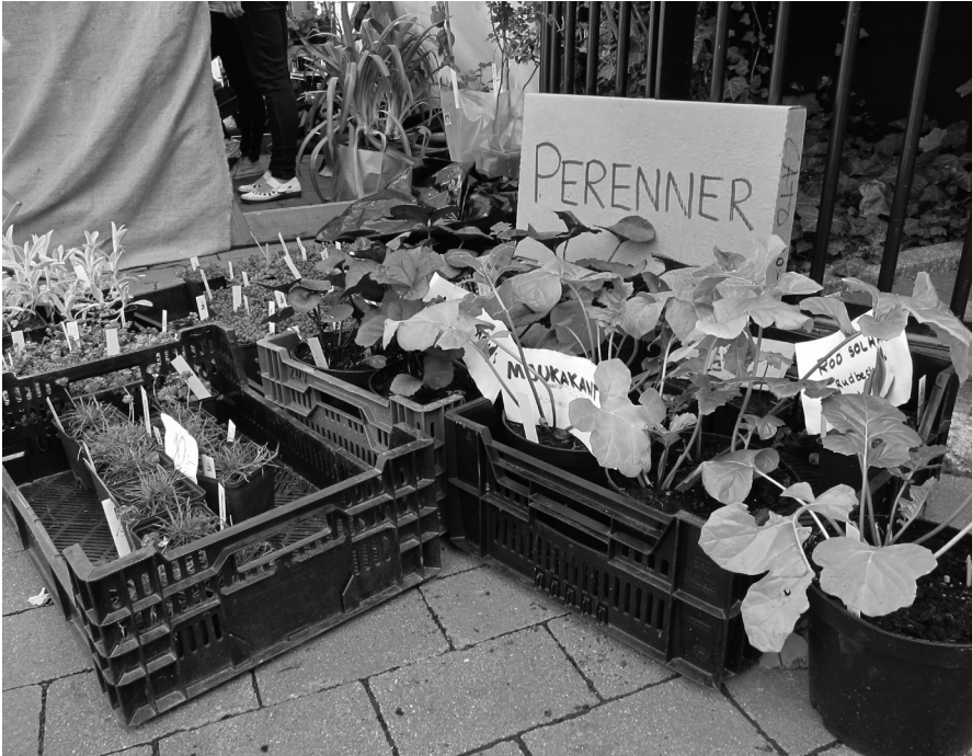
Delade växter kan skänkas bort, bytas eller, som här, säljas.

svenska är det lätt att dessa båda företeelser (dela och dela med sig) glider in i varandra, i och med att även uttrycken liknar varandra. Hade vi skrivit denna text på engelska hade förmodligen inte släktskapet mellan att dela ("split"/"divide") växter och att dela med sig ("share") framstått som fullt så uppenbart. Vi kommer i det följande att kortfattat diskutera delande som vardagsekonomisk aktivitet för att sedan presentera exempel på hur det i vårt material talas om hur, vad, med vem och varför man delar och diskuterar hur dessa utsagor om delning kan tolkas.