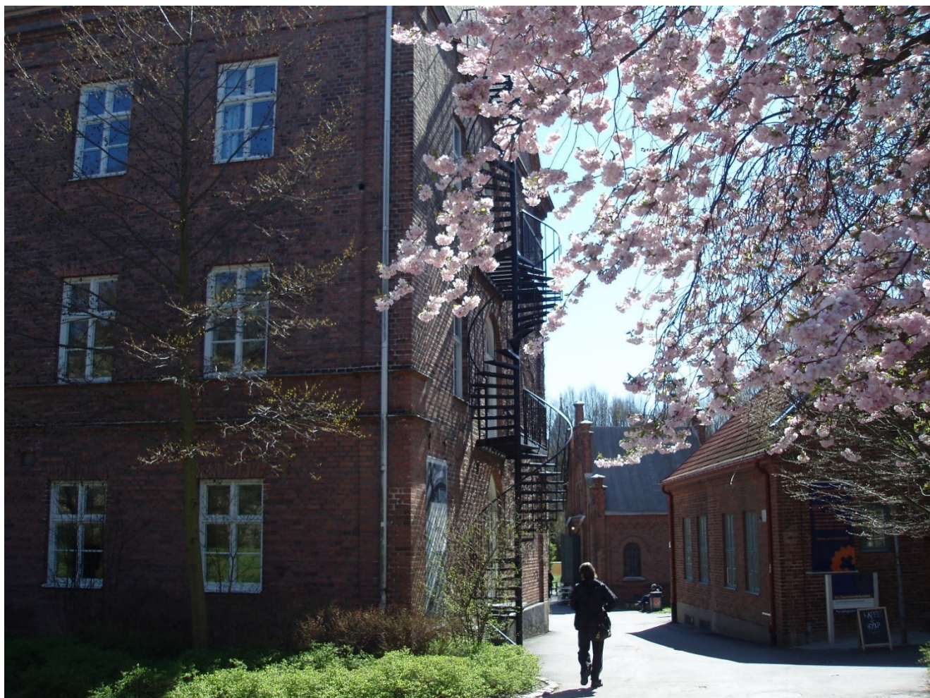
Sociologiska institutionen, Lunds universitet 20 april 2016.