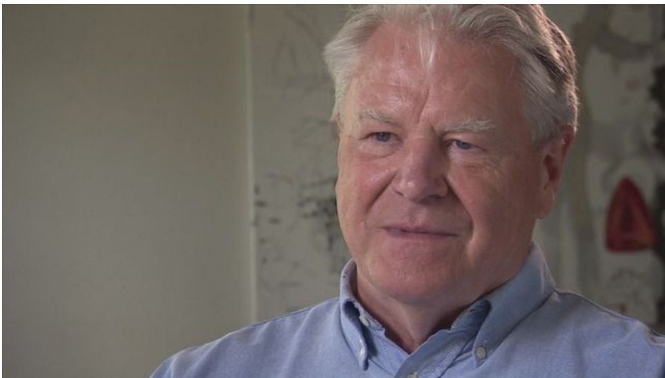
(Anders Kjellberg, sociologiska institutionen 31/5 2014)