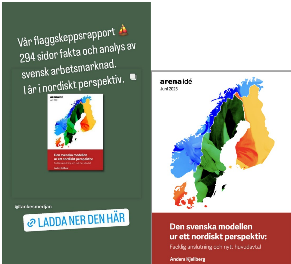
”Flaggskeppsrapporten” på Arena Idé:s hemsida: