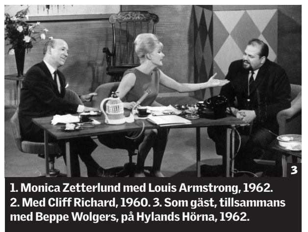
1. Monica Zetterlund med Louis Armstrong, 1962. 2. Med Cliff Richard, 1960. 3. Som gäst, tillsammans med Beppe Wolgers, på Hylands Hörna, 1962.

"Spritmisbruk, skolios och scen-skräck är sataniskt verksamma, och slutkapiteln är dystert läsning."