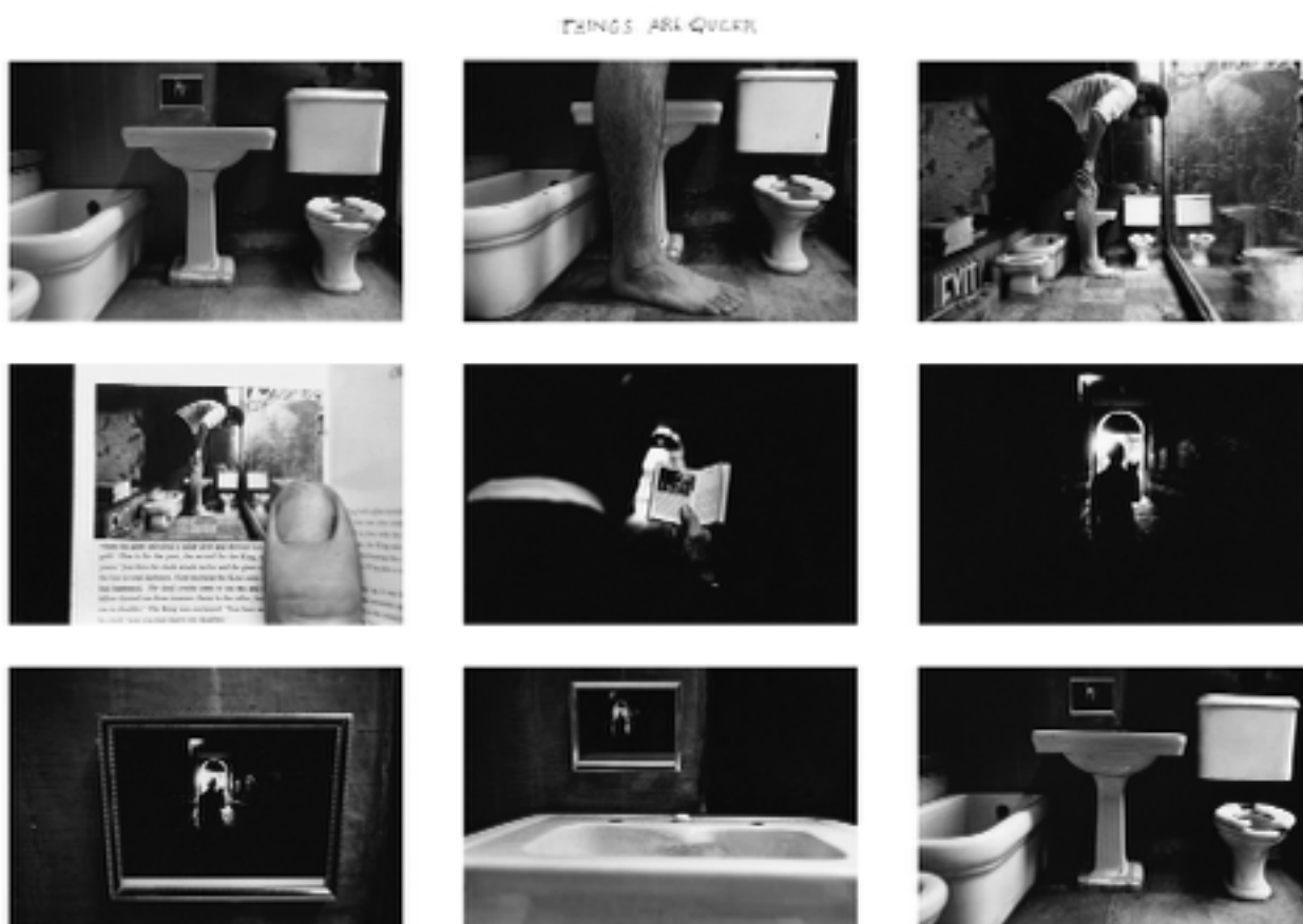
Michals, Duane: Things are queer , 1973, nine gelatin silver prints, each paper 5x7 inches

För Michals resulterar varje försök att fotografiskt fånga det multisensoriska varat i världen i en avkroppsligad illusion av närvaro. De förfjärande krafterna i fotografiet använder Michals för att belysa det absurda i en enbart visuell representation av verkligheten, och för att tänja begreppet ”verklighet” till att inkludera det märkliga och det tvetydiga. Resultatet är en stor mängd fotografier som utforskar en mellanliggande region mellan värld, kropp och fototeknik, där allt är känt men på samma gång obekant. Michals bildvärld befinner sig på en plats av betydelseglidning och förskjutning av innebörd. Här är saker proportionslösa jämfört med en allmän förståelse av tingens ordning: deras betydelser är hala och queera.