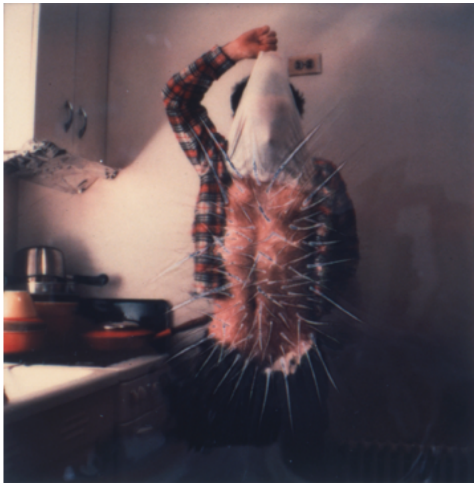
Samaras, Lucas: Photo-Transformation, May 4, 1974.

delar, kommunicerar en frustration över fotografiets begränsade befogenheter att förmedla något utöver visuell information av kroppen och jaget.