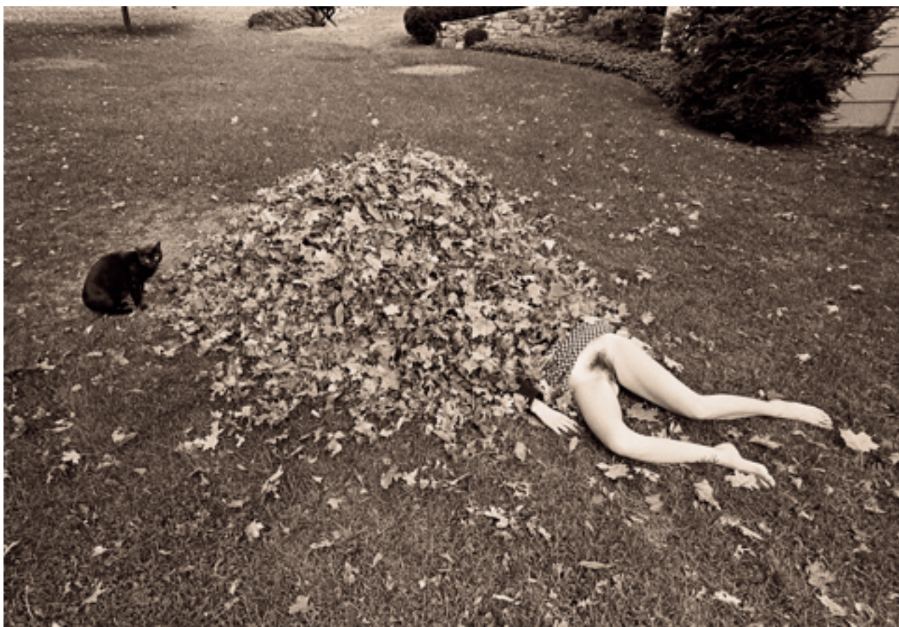
Krims, Les: Pussy and Crime Scene Fiction with visible Tampon String, 1969.

kitsch, detaljer som signifierar "Americanness", cynisk humor och politiska anspelningar. Iscensättningarna verkar vara noggrant beräknade, och det visuella intrycket av bilderna är skarpt, även om budskapet som förmedlas genom dem ofta är obehagligt tvetydigt och undflyende.