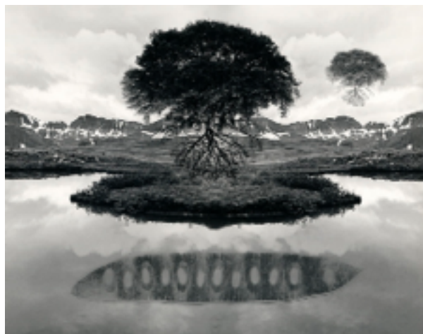
Adams, Ansel: Oak tree, Sunset City, Sierra Foothills, CA, 1962. Uelsmann, Jerry: Untitled, 1969. © Jerry Uelsmann

© 2013 The Ansel Adams Publishing Rights Trust