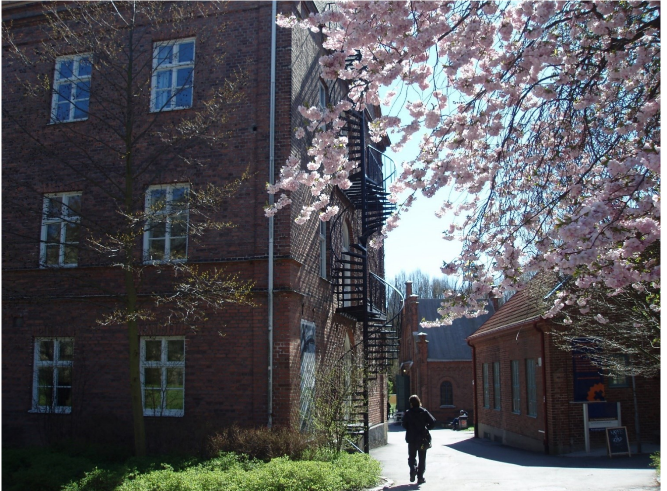
Sociologiska institutionen, Lunds universitet 20 april 2016.