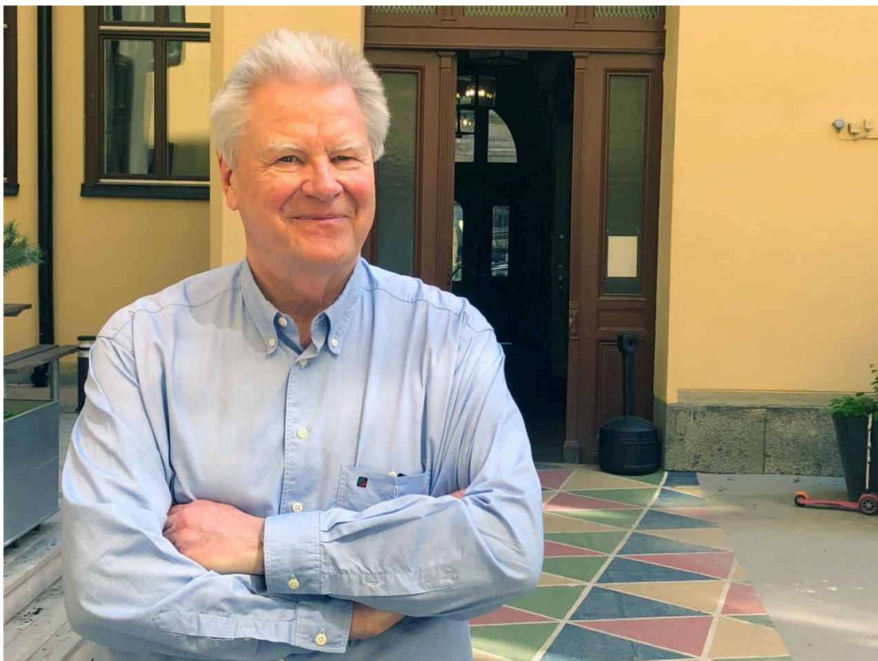
Foto ur artikeln i Arbetsvärlden 14/6 2021: ”Expert: ”De förbund som inte skrivit på borde ta sig en funderare”” https://www.arbetsvarlden.se/expert-de-forbund-som-inte-skrivit-pa-borde-ta-sig-en-funderare/ under pressträff på Arena Idé 21/5 2019.