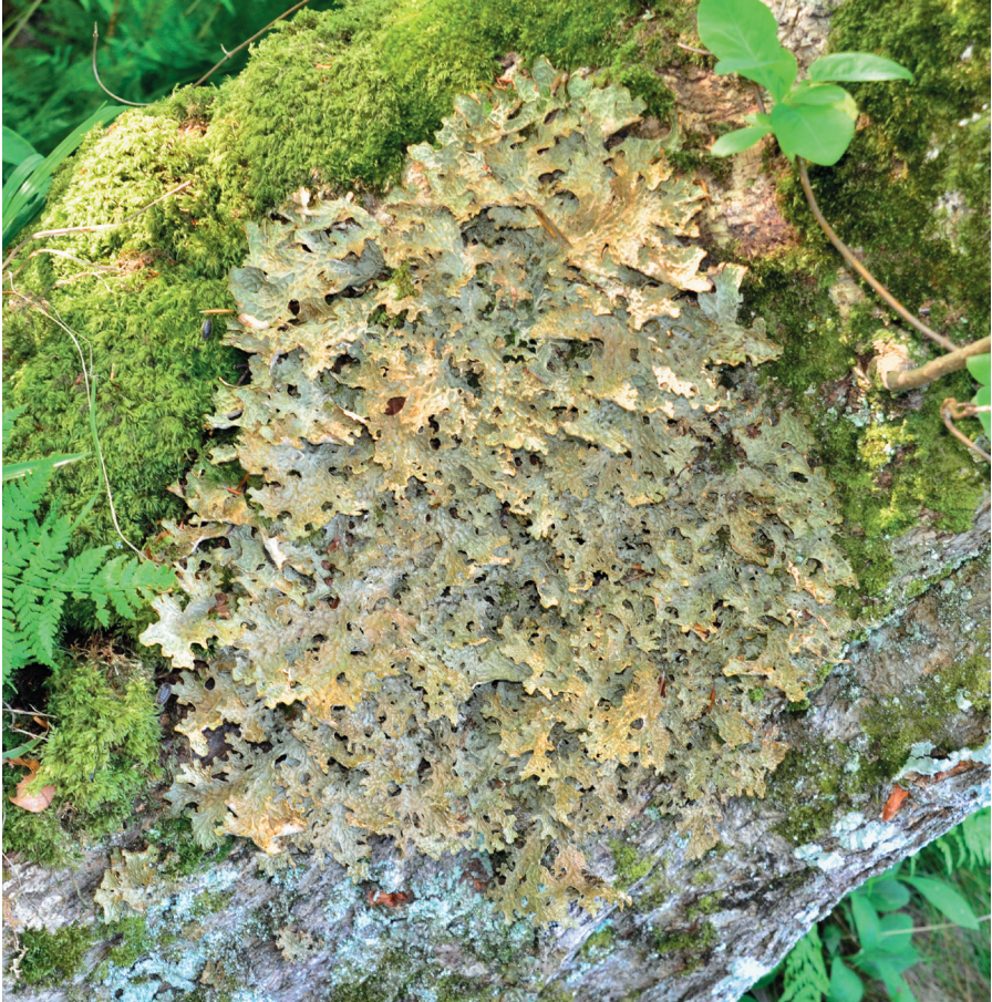
Fig. 2. Lunglav på lönn på Kullaberg, där arten ännu är ganska rikligt förekommande på en plats.

kraftig tillbakagång för lunglaven i Skåne redovisades av Hallingbäck & Olsson (1981) som återfann arten på sex av 25 lokaler.