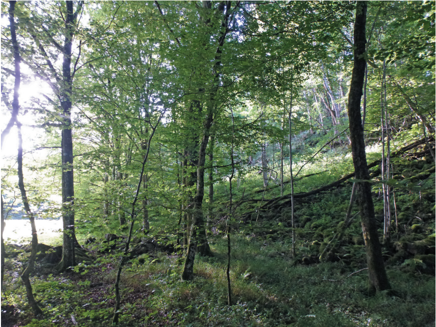
Fig. 3. Lungglavlokalen på Allarps bjer är typisk – brant, fuktig nordsluttning med ganska bra ljusinsläpp.