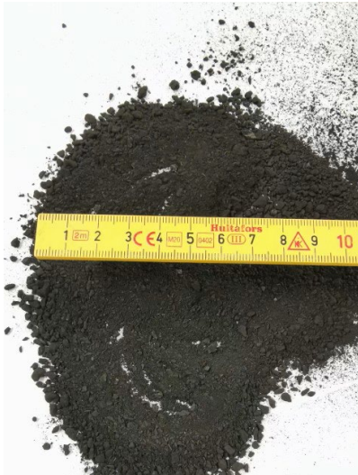
Figur 2. Malen tångbaserad biokol.