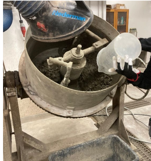
Figur 3. Produktion av biokolsbetong i labbet.

Suarez-Riera, Restuccia och Ferro (2020) bytte ut 2% av cementet mot en träbaserad biokol och fann då att böjhållfastheten ökade med mer än 15% jämfört med en betong utan biokol. De konkluderar också att även om en förbättring i hållfastheten med biokolsinblandning inte hade uppnåtts, skulle biokolsbetongen ändå ha tillräcklig hållfasthet för de flesta byggapplikationer och samtidigt kunnat bidra till minskning av avfall (trärester som annars hamnat på deponi) och en förbättring av den miljömässiga hållbarheten av betongen. Det finns således fler skäl för användning av biokol i betong, där en förbättring av betongens hållfasthet bara är ett av skälen. Även andra materialegenskaper hos betongen kommer att påverkas vid inblandning av biokol såsom fuktegenskaper, härdningsförloppet, frostbeständighet, etc.