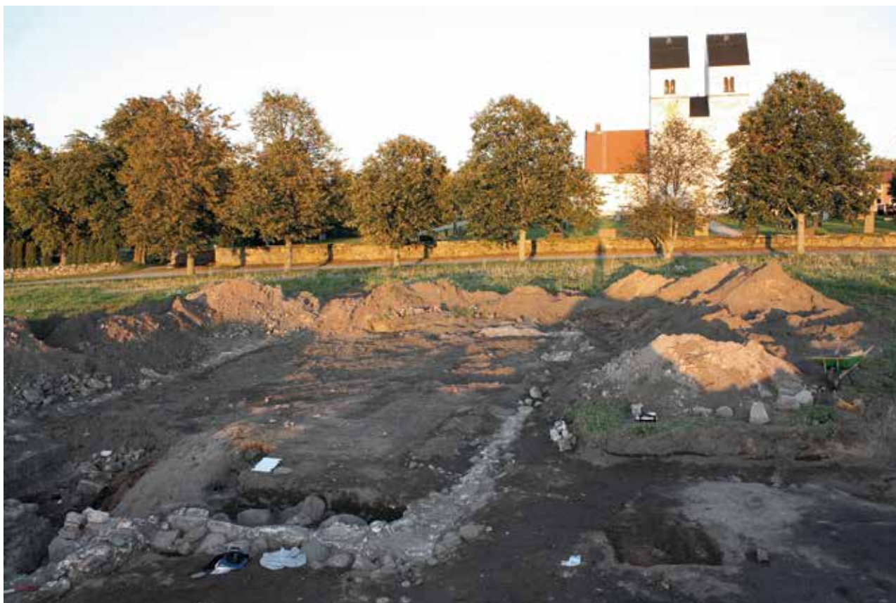
Figur 2. Stenbyggnaden väster om kyrkan. Foto: Anders Ohlsson, 2011.