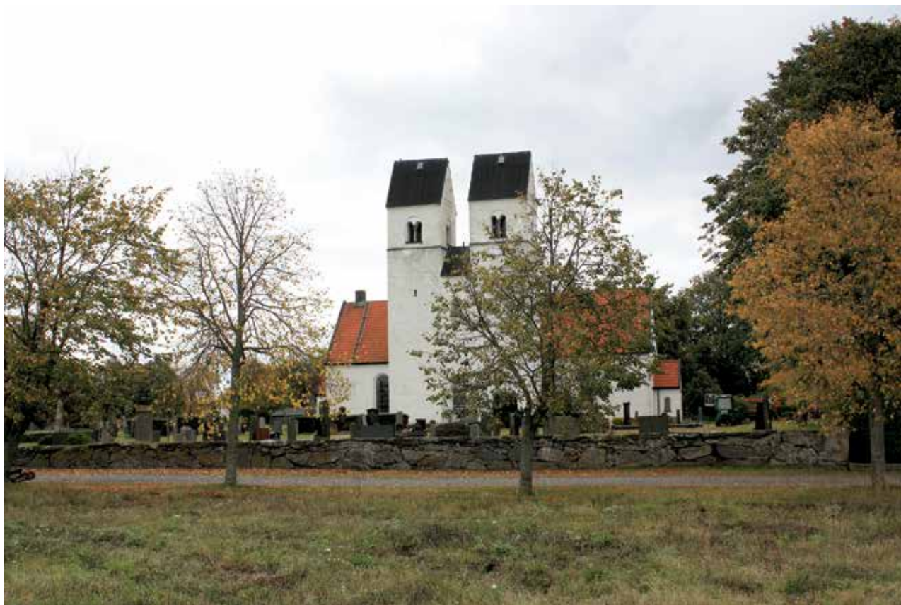
Figur 1. Färlövs kyrka.