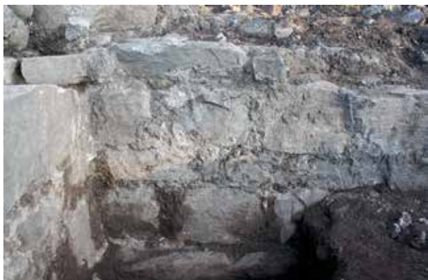
Figur 3. Inside av husets nordmur. Foto: Anders Ohlsson, 2011.