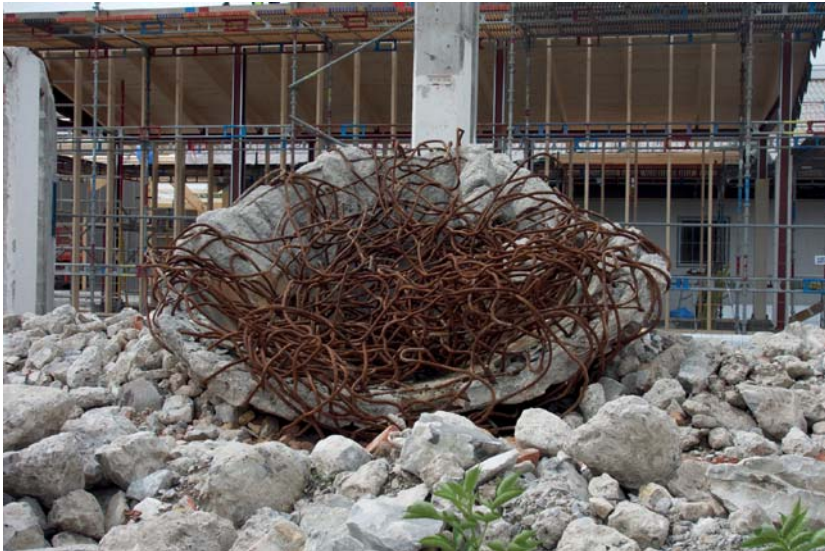
De raka strukturerna till det pågående bygget av ridhuset på Klagshamns udde utgör fond till delar av ruinparkens mer yviga uttryck.

Tanken om att materialitet är integrerad i ett längre tidsligt och materiellt kontinuum där människor väljer att avgränsa den till olika objekt, respektive inordna den i olika faser kan vara ett sätt att närma sig frågor