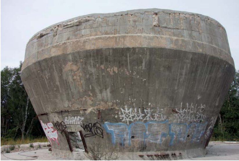
Några meter av nederdelarna till de höga silobyggnaderna har bevarats.