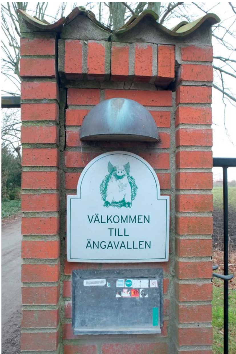
En glad gris med en kornkrans om halsen hälsar besökaren välkommen på en av gårdens grindstolpar.