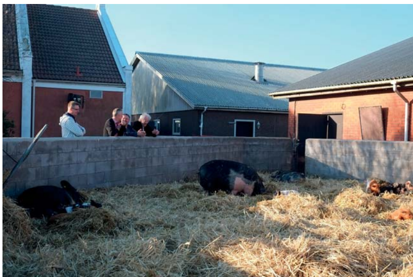
Bakom restaurangen kan besökare titta på suggor med kultingar i inhängnader.