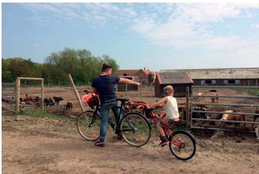
Besökare tittar på grisar i en hage belägen ett stenkast från restaurangen.