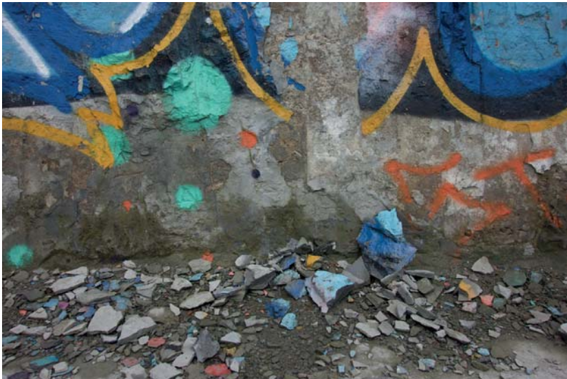
Lager av färg, puts och betong täcker insidan av de gamla silobyggnaderna.

En sommarmånad som augusti blir kontrasten mellan grå betong och grönska runtomkring extra påtaglig. Denna kontrast mellan det gråa en gång byggda och det ofta gröna växande är en av grundtonerna i ruinparker och miljöer där naturen medvetet tillåts ta över, eller där ett område eller en miljö ges tillbaka till naturen, som landskapsarkitekten bakom ruinparken uttryckte det. Transmutationsprocessen genererar ett skifte i