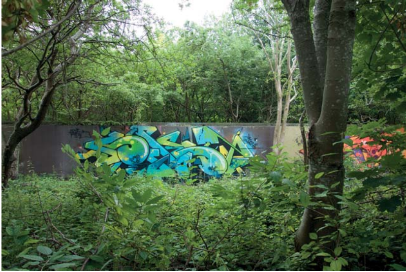
I den frodiga grönskan skymtar strukturer från tidigare industriella aktiviteter.

impediment, brownfields, periurbana landskap, mellanrum, gränzoner, efemära platser, förändringsområden (Saltzman 2009:8).