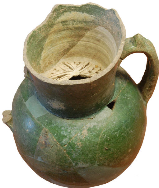
FIG. 3. Grönglaserad kanna med två handtag och keramiknät som skydd i halsen. Zizamuseet i Palermo.

I början av 1000-talet började det politiska sönderfallet för Siciliya. År 1072 hade normanderna erövrat Palermo, och 1091 höll de hela ön. Den islamiska befolkningen fanns kvar, men från 1130-talet minskade dess inflytande samtidigt som det syditalienska fastlandet sammanfogades politiskt med ökungadömet. Fredrik II förflyttade vid mitten av 1200-talet stora grupper av muslimer till Lucera i Apulien efter många år av inbördeskrig. Där etablerade de ett väl fungerande samhälle med viktiga positioner inom kejsardömet. Det slutliga dråpslaget kom år 1300 när Charles II av Anjou tvingade Luceras muslimer att lämna över sina rikedomar. Sålda som slavar fick de se den sista moskén i Italien rivas och ersättas med en katedral instiftad till den Heliga Jungfrun, Santa Maria della Vittoria.