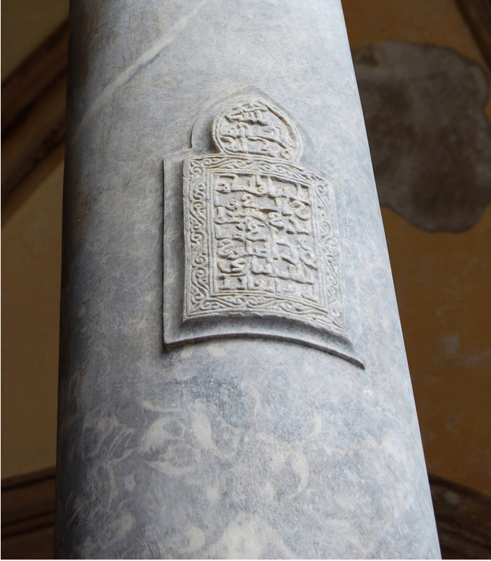
FIG. 2. Kolonn i portalen till katedralen i Palermo bärande arabisk skrift med citat ur Koranen. Återbruket av byggnadsdetaljen ger en inblick i de överlagrande traditionerna. Kolonnen var ursprungligen från en antik romersk byggnad. Den har troligen därefter använts i en bysantinsk kyrka som senare byggts om till moské. Slutligen placerades den i ingången till den romersk-katolska domen.