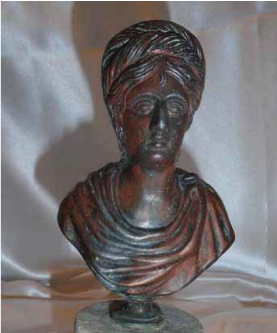
Bust i metall som kan föreställa Pompeja, Caesars första hustru.

besökt honom i hans hem i Rom. Han frikändes trots allt, men alltsedan den dagen var Cicero och Clodius dödsfiender.