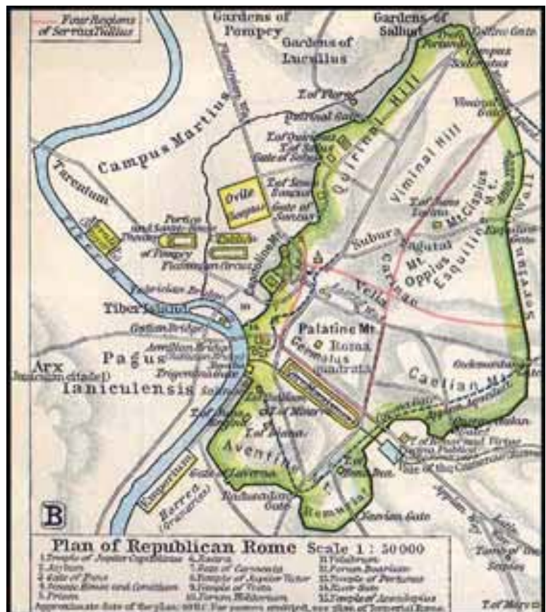
Karta över Rom som staden såg ut på Clodius tid.

Clodius startade sin bana i det militära och tjänstgjorde bl.a. under L. Licinius