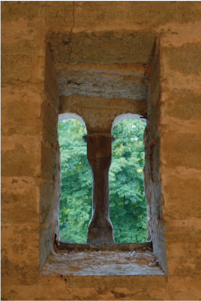
Fönsteröppningen i den kammare som enligt traditionen kallas för Ingrid Ylvas.

var i Sverige under medeltiden. Från danskt område finns emellertid statistik över hur ofta kvinnor respektive män förekom som stiftare. Wienberg har i sin undersökning utgått ifrån kalkmålningarna i Roskilde stift. Materialet visar att av 16 stiftare från den romanska perioden var 4, d v s 25%, kvinnor. Under den gotiska perioden var 4 av 18 stiftare, d v s 22%, kvinnor. För Lunds stift är siffrorna likartade. Under den romanska perioden var 5 av 17 stiftare kvinnor, vilket gör 29% .