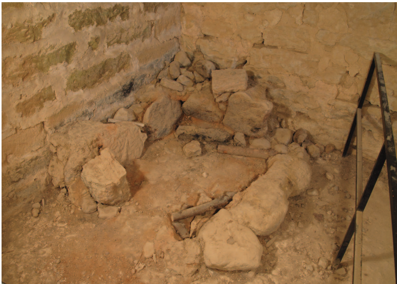
Rökugnen i det stora rummet på andra våningen.

byggnationen. Det kan då ha varit den kvarvarande släkten som kollektiv såväl som någon enskild medlem. Vissa omständigheter pekar mot det senare.