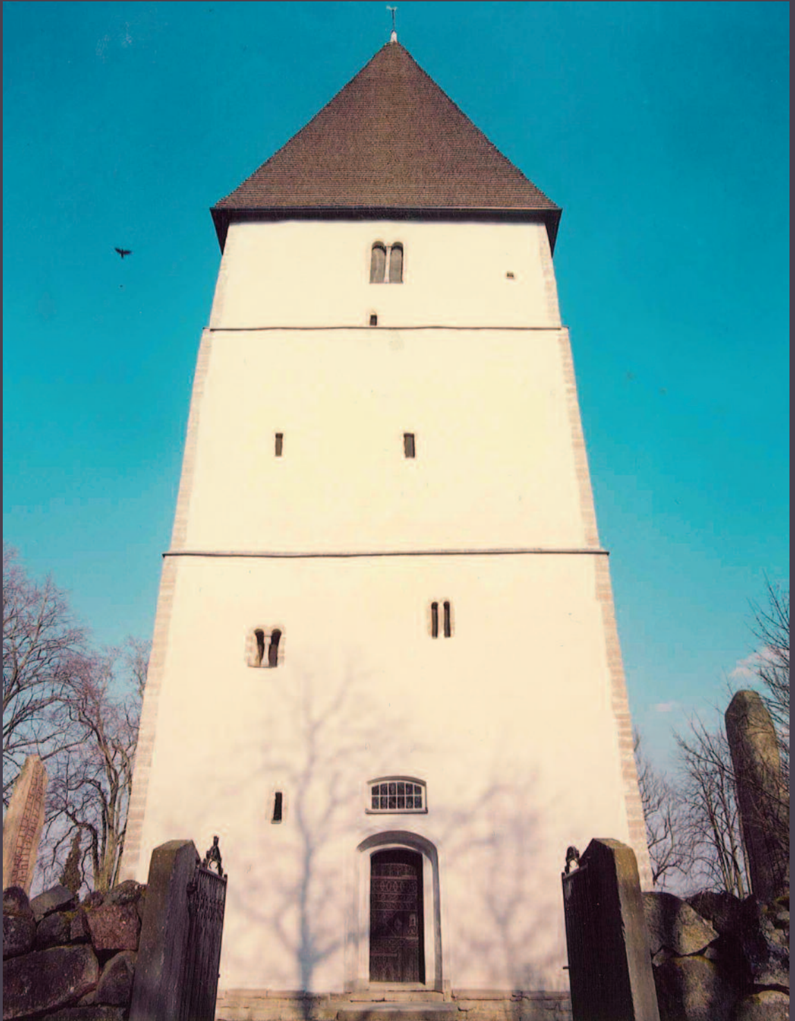
Det mäktiga kyrktornet i Bjälbo.