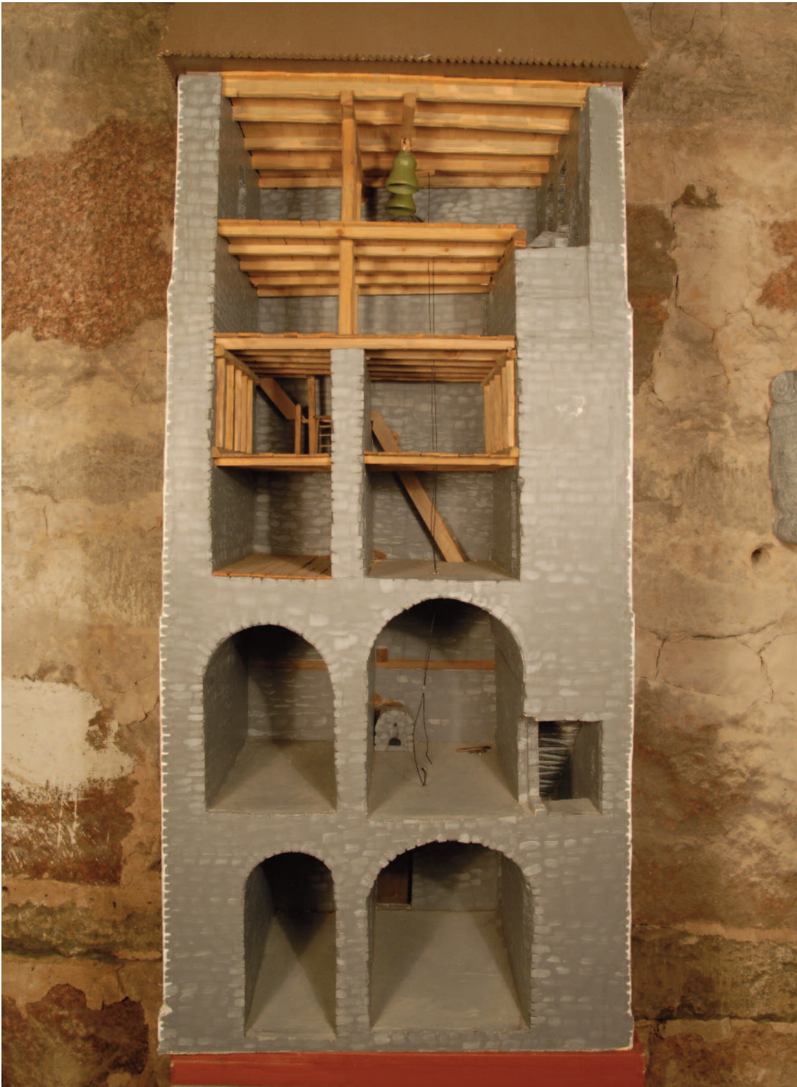
Tornet till Bjälbo kyrka i genomskärning. Modell av Mats Gilstring.