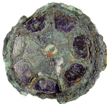
Fig. 7. Anglo-saxiskt spänne i cloissonnéteknik. Trädgårdsmästaren 9-10 nr 13863. Skala 2:1.