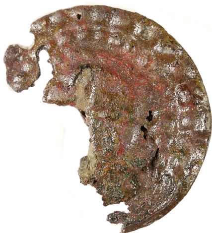
Fig. 3. Det äldsta daterade ottonska spännet i Sigtuna. Professorn 1 nr 14620. 1000-talets första fjärdedel. Skala 2:1.