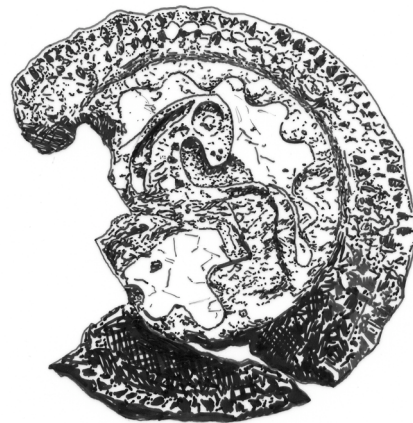
Fig. 2. Agnus Dei-spänne. Fjärrvärme- grävningen 1991–92, Fnr 19. Skala 2:1. Ritning Jacques Vincent.