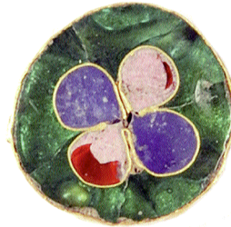
Fig. 4. Emaljdetalj i cloissonnéteknik. Bysantinskt eller italienskt arbete. Trädgårdsmästaren 9-10 nr 3035. Skala 4:1.