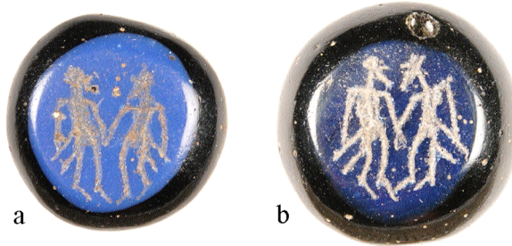
Fig. 6. Alsengemmer. a) Professorn 1 nr 4168, b) Professorn 1 nr 4334. Skala 2:1.