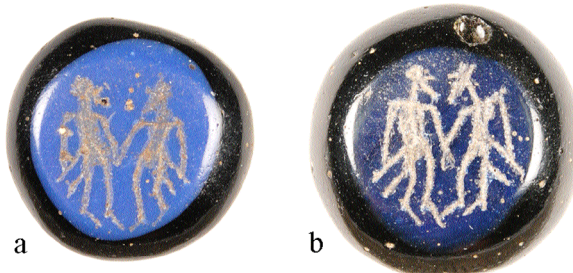
Fig. 6. Alsengemmer. a) Professorn 1 nr 4168, b) Professorn 1 nr 4334. Skala 2:1.