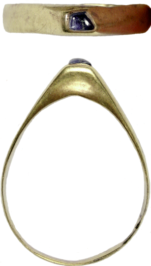
Fig. 5. Stigbygelring. Professorn 1 nr 807. Skala 2:1.