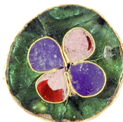
Fig. 4. Emaljdetalj i cloissonnéteknik. Bysantinskt eller italienskt arbete. Trädgårdsmästaren 9-10 nr 3035. Skala 4:1.