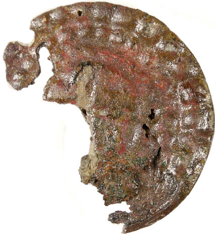
Fig. 3. Det äldsta daterade ottonska spännet i Sigtuna. Professorn 1 nr 14620. 1000-talets första fjärdedel. Skala 2:1.