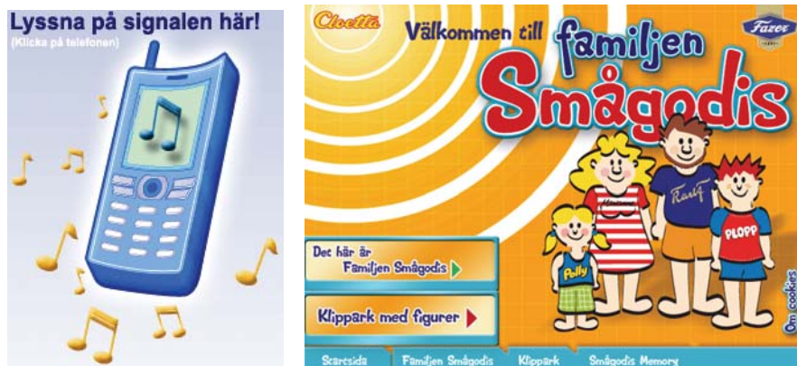
Bild 3. Hemglass erbjuder besökaren att kostnadsfritt ladda ned företagets välkända signaturmelodin till mobiltelefonen (Källa: http://www.hemglass.se ) och Familjen Smågodis hos Cloetta/Fazer erbjuder dig utöver spelmöjligheter, "kuliga klippark" på familjen och deras röda (Dumle-)bil.

är hem & skola samt Friskis & Sveltis. Inte helt förvånande gillar hon Marianne-karameller, men också t.ex. Geisha ( http://www.smagodis.nu ).