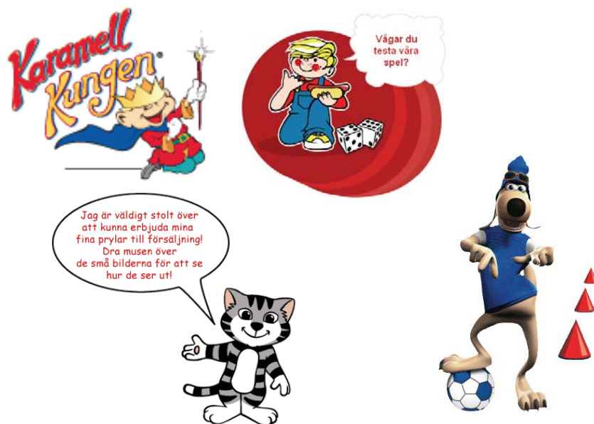
Bild 2. Exempel på varumärkesmaskotar: Karamellkungen, Tiger (Milko), Dennis (Scans Hotdog) och Doglass (Hemglass).

m.m.) med exponering av varumärkesmaskotar (t.ex. Tigern Tony, Karamellkungen, kalven Calvin, Dumlegubben) och tävlingsinbjudningar (Rittävling: rita godismöbler, rösta om bästa reklamfilm, utse din favoritsmak).