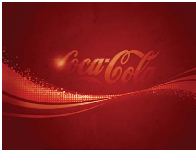
Bild 4. "Behöver du en visuell stund för att ändra humöret?" Hämta en cool Coca-Cola skärmläckare eller ladda ned en bakgrundsbild till din dator.

en "Fixar du att komma in på topp-listan? Passa på att utmana en kompis!" Barnen förvandlas på detta vis till varumärkenas lakejer och går industrins ärenden. Uppmaningarna kan för den unge konsumenten synas oskyldiga och vänligt upplysande, men handlar knappast om välgärningar från den kommersiella aktörens sida. Här utnyttjas alltså barnen som en kanal för vidare reklampåverkan i kamratgruppen. Kamratpåverkan ("peer pressure") kan till och med upplevas starkare än den massmediala.