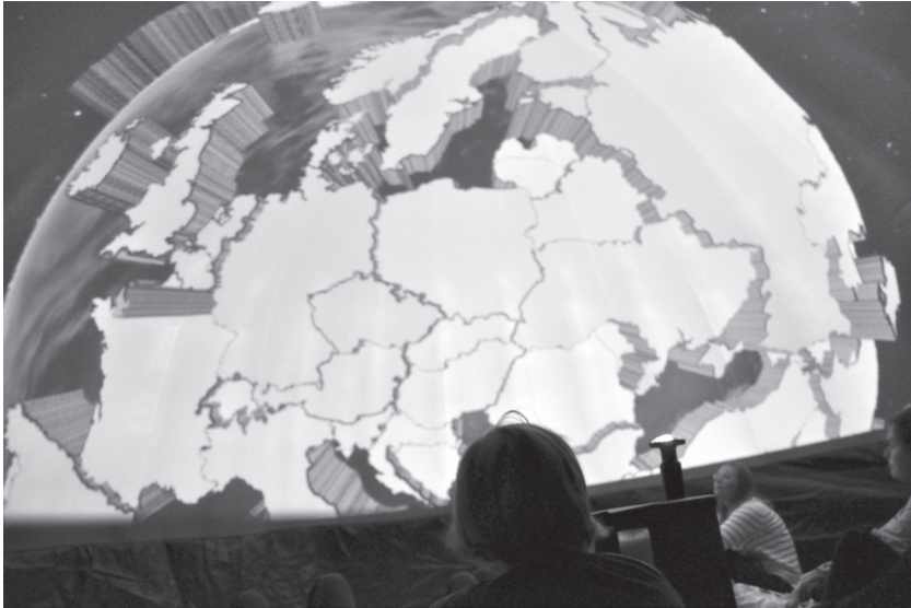
Figur 2. Detta är en typisk bild för Klimatvisualiseringar där länders utsläpp omräknat till koldioxidequivivalenter och relaterat till per capita, total mängd per år och över industrialiserad tid visas som staplar på en jordglob. Komplexa skeenden reduceras till en statisk återgivning av ett rum.

som visas, till exempel grafer, stapeldiagram och liknande, hade fungerat lika bra på en platt skärm; icke desto mindre utgör dessa traditionella vetenskapliga figurer den största delen av modulerna. Man vill förmedla vetenskap med så tydliga figurer som möjligt, och resultatet är att man producerar välkända vetenskapliga figurer i ett rum som byggts för att göra mycket mer, enligt sina egna marknadsföringstexter. Entydighet verkar vara målet, allt för att budskapet ska nå fram, men resultatet är att visningarna också blir ganska platta. Det var något annat man ville uppnå i domen, nämligen att ge ”upplevelsen av att befinna sig omsluten av ljud och bild för att detta lämnar ingen oberörd”. 18 I en rapport av forskargruppen bakom projektet beskrivs de visuella utmaningar Klimatvisualiseringar står inför: