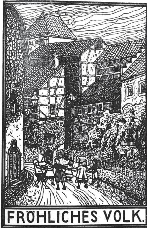
Illustration 3: Försättsblad för en sångavdelning i Deutsches Lautenlied 1928

ett tidigt stadium med Führer -principen ("ledarprincipen"), som i sin tur bland annat hade utvecklats av aktörer som propagerade för Wandervogel -rörelsen under slutet av 1800-talet. Principen gick i stort sett ut på att gemenskapen – från sin egen mitt – valde den mest lämpade och personligt kvalificerade personen till att leda gemenskapen. I nationalsocialismen visade sig sedan Führer -principens antidemokratiska, diktatoriska – och för utbildningen av ett befälsmottagande system gynnsam – karaktär.