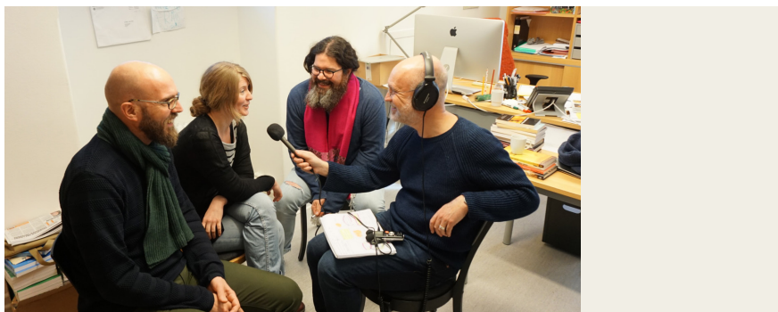
Poddproduktion i Lund