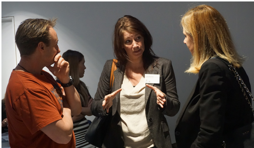
Studenter i en diskussion i en paus