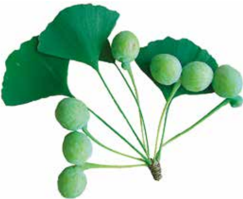
FIGUR 1. Ginkgons frön har ett köttigt yttre skikt som innehåller smörtsyra och de luktar väldigt illa när de fallit av. Därför brukar ofta enbart hanträd planteras. Från Fischer m.fl. (2010).

Liksom hos många barrträd avsondrar fröämnet hos ginkgon en pollineringsdroppe, i vilken de vindburna pollenkornen fastnar. Så länge fröämnet är opollinerat fortsätter avsondringen i takt med avdunstningen, men så fort pollinering ägt rum