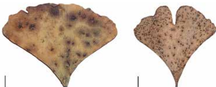
FIGUR 3. Vissna ginkgoblad med sporsamlingar av Bartheletia paradoxa . Skallstreck 1 cm. Från Scheuer m.fl. (2008).

Forskare har utarbetat många geniala metoder för att få kunskap om hur världen var beskaffad i gångna tider. Man har lagt