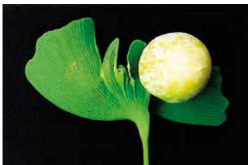
FIGUR 2. Sällsynt kan en missbildning uppstå hos ginkgon som kallas "o-ha-tsuki". Fröna bildas då direkt på bladen, precis som de gjorde hos några av ginkgons sedan länge utdöda förfäder.

En annan följeslagare till ginkgon är basidiesvampen Bartheletia paradoxa (Scheuer m.fl. 2008). På det levande trädet förekommer den som vilande sporer, men när bladen vissnar om hösten tillväxer den mycket snabbt i de fallna bladen (figur 3). Denna svamp är i lika hög grad som ginkgon ett levande fossil. Den växer bara på ginkgo-blad, och har överlevt till nu endast tack vare att ginkgon överlevt. Ginkgoträdet har