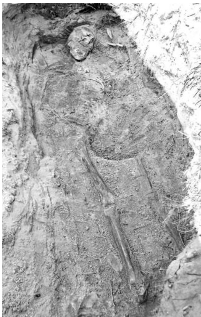
Fig. 2. Individ 3 i botten av grav A259, en man i 20-årsåldern. —Person 3 in grave A259, a male of c. age 20.

dess båda kroppar fanns rikligt med lösa skelettdelar, bland annat delar av ett krossat kranium (individ 2) liggande närmast föst åt gravens ena sida. Den osteologiska analysen påvisade spår efter ytterligare en individ i graven (individ 4) bland de lösa benen. Åtminstone tre av de döda hade lagts med huvudet i nordväst.