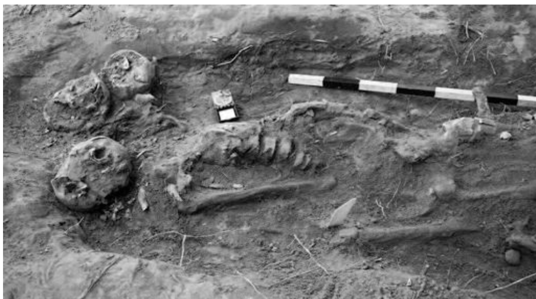
Fig 3. Individ 5 överst i grav A273, en man i 30–35-årsåldern, låg på höger sida med armarna bakom ryggen, troligen bakbunden. —Person 5 in grave A273, a male in his thirties, lying on his right side with his hands probably tied behind his back.

sonen, som vid den osteologiska undersökningen visade sig vara en man, låg på sidan med huvudet kraftigt bakåtböjt och ansiktet vänt åt söder. Man kunde tydligt se hur hans högerarm var tillbakavriden och låg så att den gick in under ryggraden för att på ryggen förenas med vänsterarmen. Med största sannolikhet var personen bakbunden när han begravdes (fig. 3).