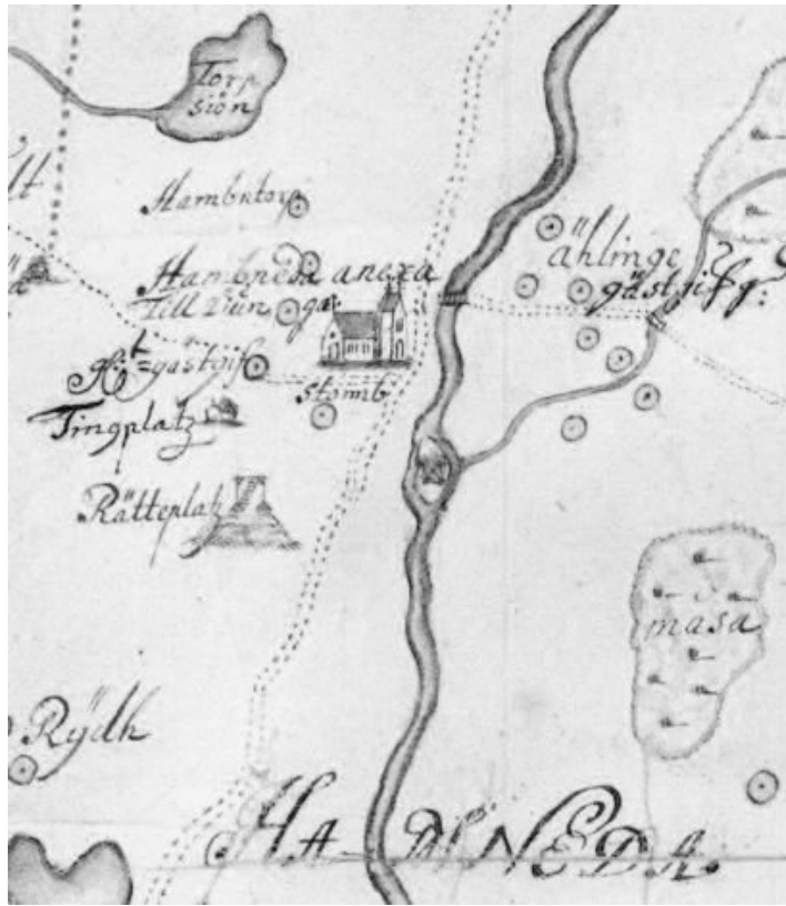
Fig. 1. Utdrag ur häradskartan över Sunnerbo härad 1685 med kyrkan, tingsplatsen och avrättningsplatsen i Hamneda markerade. »Rätteplatz» är markerad med en galge. —Excerpt of a 1685 map of Sunnerbo hundred. The church, the assembly site and the execution site is marked, the latter with a gallows.

den medeltida kyrkan, men 500 meter norr om den tidigare utpekade galgbacken. Topografin på platsen är ganska plan, men omedelbart norr om fyndplatsen höjer sig terrängen i en markant åsrygg som sträcker sig ett par hundra meter åt nordost längs den gamla landsvägen. De påträffade gravarna låg där åsryggen planade ut. Av äldre kartor att döma verkar platsen för gravfyndet ha legat på byns inägor och nyttjats som äng. När häradskartan upprättades 1685 var avrättningsplatsen fortfarande i bruk och där är den följaktligen utmärkt. På de första detaljerade kartorna över Hamneda, från 1696, 1697 och 1702 finns dock inga noteringar om någon galgbacke i byn. Tingsplatsen och galgbacken hade ju flyttats till Ljungby på 1690-talet. När kartorna upprättades några år senare fanns ingen anledning att notera de tidigare lägena.