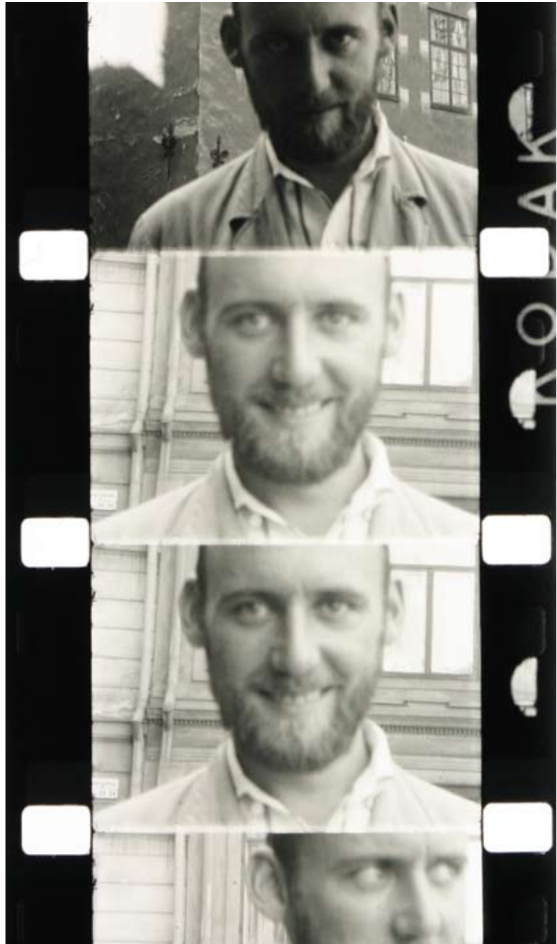
Hans Nordenström, 1927–2004, filmfragment utan titel (odat.)