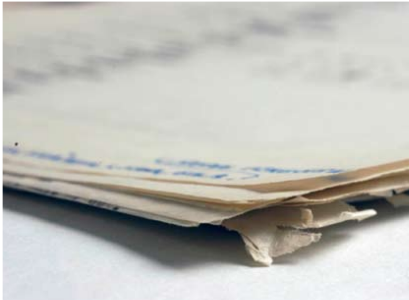
Manuskript till pjäsen "Kaspers död" (1941). Ingmar Bergmans Arkiv.

Den institution där jag själv arbetar, Ingmar Bergmans Arkiv, bevarar bland annat handskrivna manuskript, maskinskrivna regimanus, anteckningsblock, brev, med mera. Med andra ord: nästan uteslutande papper. Är då Ingmar Bergmans Arkiv ett filmarkiv? Papperslappar är uppenbarligen inte film. Men vad är det då?