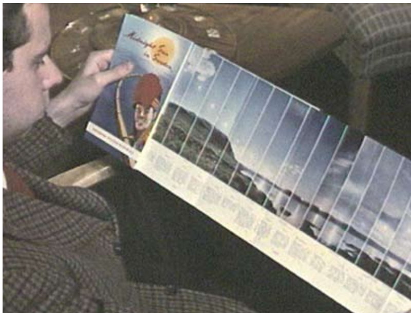
Film som resa. Broschyrerna lockar.

dast till bilderna från Stockholm; därefter spelas antingen svensk folkmusik eller symfonisk musik i det glada och käcka allegrotempo som utmärker ett antal decenniers resefilmer och som i en filmmusikkatalog potentiellt skulle kunna kallas ”resmusik”. Den mer internationella framtoning som ges Sverige och Stockholm genom den smek samma valsen återkommer inte mer i filmen; efter denna inledning är det så gott som enbart allmoge, natur, förgången tid och föreställd svenskhet som gäller, både bildligt och musikaliskt.