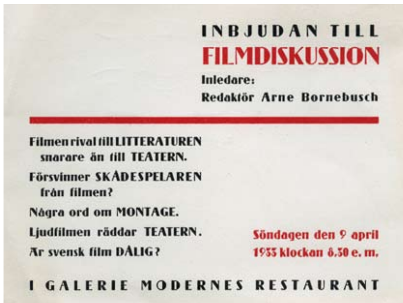
Inbjudan till mötet vid vilket Svenska Filmsamfundet bildades.

veckling: kartor, diagram, filmfotos, affischer, annonser, dräktskisser och dräkter, manuskript, filmmusik, olika typer av kameror, projek-tionsapparater och belysningsattiralj.” 15