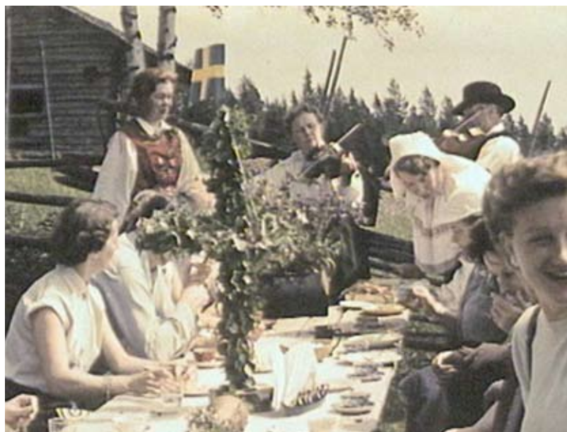
Svenskhetssymboler i överflöd.

gen konstruerad och osynlig gräns men i filmen får den en materiell och närmast magisk karaktär. Norrland och bilder därifrån upptar en stor del av filmen, och det var frekvent även i de Sverigefilmer som visades för svenskamerikanerna i diasporan. Denna fokusering beror till viss del just på arrangörerna: SJ och Svenska Turistföreningen. Som Snickars framhållit, gick tågets och turistföreningens intressen och utveckling hand i hand. För Norrland blev järnvägen viktig. För nationen Sverige innebar den en väg till sammanhållning och enande, och turistföreningens strävanden att framhäva Norrland blev möjliga tack vare järnvägen. Som Snickars skriver övergick Norrland ”under 1890-talet till att uppfattas som en nationell sevärdhet”, och film efter film verifierar detta. 18 Snickars diskuterar också ingående de nationalromantiska bilder som emanerade under slutet av 1800-talet, ofta i samarbete med just Svenska Turistföreningen, och hur de ingick i en visuell kultur som övertogs av filmen. Påfallande är just att i princip samma bilder figurerar nu över femtio år senare.