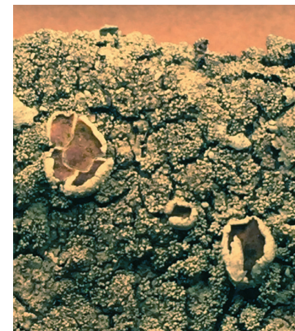
Fig. 2. Samma exemplar som i figur 1 i förstoring. Det största apotheciet är 4 mm i diameter.

Grötlingboudd, 650 m SSV om Hallinge, insamlat så sent som 2014 av Odelvik m.fl., lånades in från Riksmuseet (S-F260339). Det ombestämde till X. conspersa efter att dess kemi undersöktes med tunnskiktskromatografi, TLC, enligt Orange m.fl. (2001). Bålen innehöll constictinsyra, stictinsyra, norstictinsyra och usninsyra, vilket överensstämmer med kemin hos X. conspersa , medan X. tinctina innehåller salazinsyra, consalazinsyra, norstictinsyra och usninsyra (Elix & Thell 2011). Den bleka undersidan hos den gotländska kollekten är visserligen något otypiskt för X. conspersa men ryms inom artens morfologiska variation. Vi ställer oss tveksamma till ytterligare två geografiskt udda lokaler som rapporterats till Artportalen ( www.artportalen.se ), Gryt i Östergötland och Västergötlands inland, då det saknas belägg. Med hjälp av Adolf Hugo Magnussons studie från 1942 och virtuella herbariet ( www.emg.umu.se ), en databas över alla större herbarier i Sverige, har vi sammanställt utbredningen i Sverige som är helt koncentrerad till Västkusten. Fertila fynd gjordes i universitetsherbarierna i Göteborg (GB) och Lund (LD). Samtliga fertila belägg hade sina geografiska hemvister i Halland och Bohuslän. På vår utbredningskarta är de markerade med brandgula prickar, övriga med blå (Fig. 3). I GB finns 48 kollektor av X. tinctina av vilka 31 är fertila. I LD är två av tolv kollektor försedda med apothecier. Anledningen till den höga andelen fertila belägg i