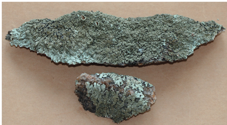
Fig. 1. Fertilt exemplar av Xanthoparmelia tinctina från Halland, Ölmevalla s:n, Åsa, Vassbäcksområdet.