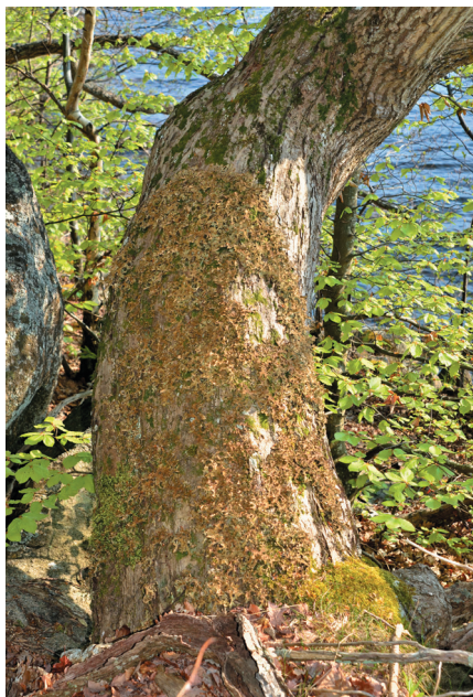
Fig. 2. Idealiskt läge för lunglav – ljus och hög luftfuktighet nära vatten, här vid Ivösjöns norra strand, Orehagen i Vånga socken i nordöstra Skåne (Tabell 1: lokal 7).

Västerut, i Schleswig-Holstein, finns en enda lokal kvar, i Pobüller Bauernwald mellan Flensburg och Husum. Söderut finns den närmast i Rhön, ett bergsområde i gränstrakterna mellan Bayern, Hessen och Thüringen. I Danmark finns den numera bara sporadiskt på Jylland efter att de sista exemplaren på Själland dog ut för några år sedan.