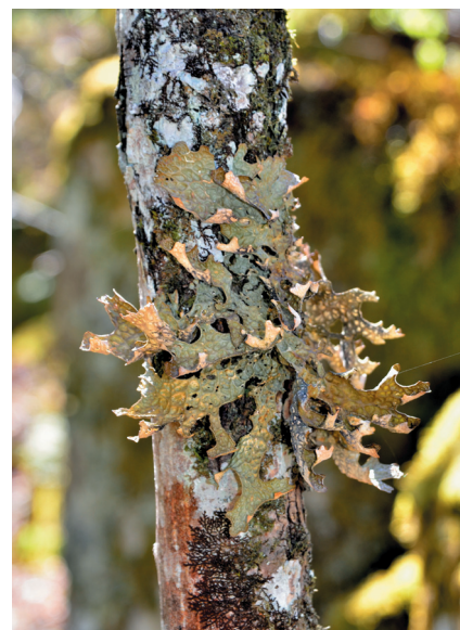
Fig. 4. Lunglaven växer ibland även på mycket tunna stammar. Bilden är tagen på en ung lönn på Skallahultsåsen (Tabell 1: lokal 37), Nättraby socken i Blekinge.

Blekingegränsen, i området runt Ivösjön, lokalerna 7–15 där den återfanns på hela sex lokaler. Det fanns emellertid både exempel på lokaler där lunglaven tycks trivas väldigt bra och platser där den verkar vara på väg att försvinna (Fig. 2–3). I fjorårets undersökning, i den utpräglat nemoral delen av Skåne, fanns lunglaven nästan bara kvar på ovanliga, mer eller mindre spektakulära lokaler, det vill säga utsatta, mycket branta sluttningar som inte förändrats under lång tid och som inte blir för mörka (Schieffelbein et al. 2016).