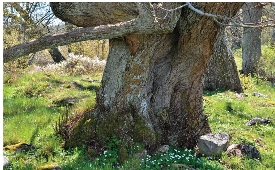
Fig. 7. Johannishus åsar. Här växer lunglaven på en gammal lind.

Den mycket negativa trend som var särskilt markant i skånska bokskogar