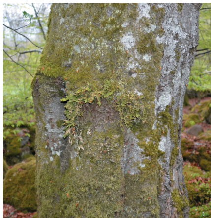
Fig. 3. Lunglavslokal där förutsättningarna inte längre är de bästa. Bokstam med Lobaria där stora delar av bälen bleknat och delar i mitten redan ramlat ner. (Tabell 1: lokal 13): Söndre Vång i Ivetofta socken, Skåne.

Årets resultat blev betydligt mer uppmuntrande än fjorårets. På de återbesökta 40 lokalerna fanns lunglaven kvar på 24, varav 19 återfanns av oss. På ytterligare fem lokaler finns