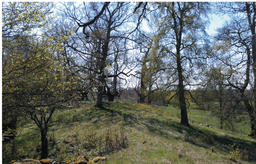
Fig. 6. Johannishus åsar i Hjortsberga socken i Blekinge (Tabell 1: lokal 35). En av få förekomster i öppet landskap.

kustbandet, finns fler lokaler och på de allra rikaste kan man finna flera tiotal träd och fertila exemplar, enligt Hemberg. De befinner sig emellertid utanför undersökningsområdet.