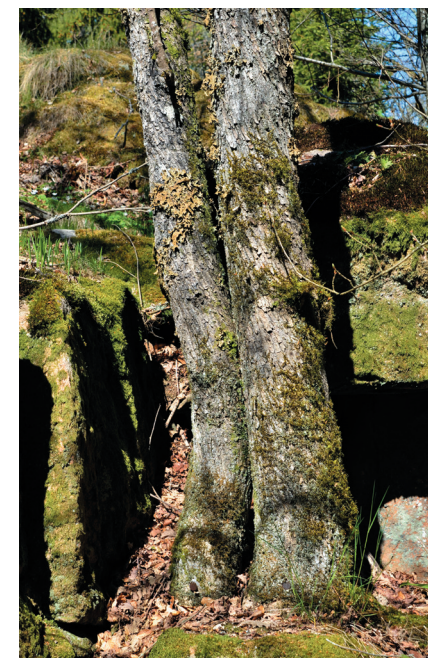
Fig. 5. Typisk ståndort för lunglav, ovanför kanten av ett brant stup. Dessa exemplar växer på lönn på Skallahultsåsen (Tabell 1: lokal 37), Nättraby socken i Blekinge.

Lunglaven håller ställningarna ganska väl i Blekinge, ett intryck som även