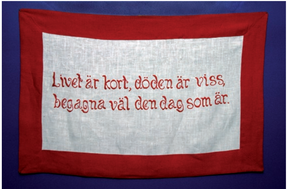
Makt över människan, Malmö museer 2006.