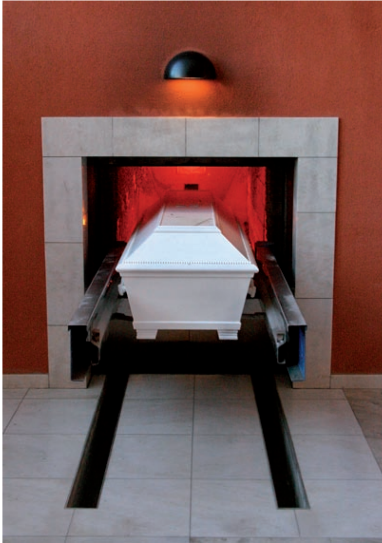
Krematorium, Lund 2005.