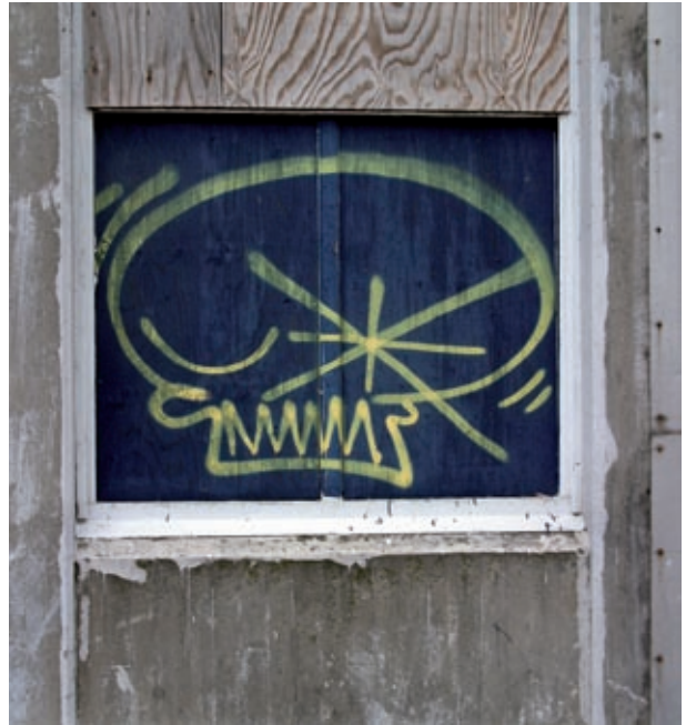
Gravsten och graffiti, Malmö 2006.