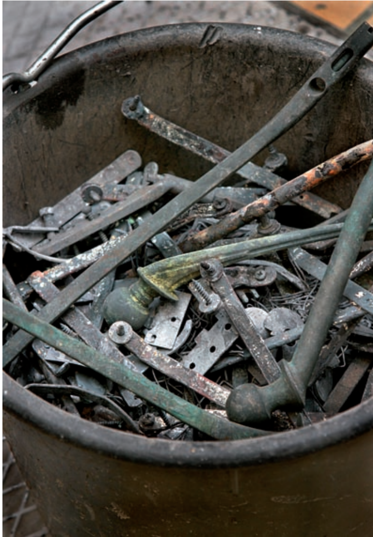
Krematorium, Lund 2005.