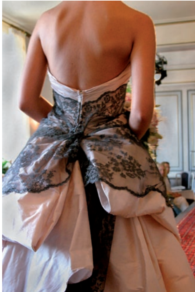
Bröllopsmessa, Lund 2004.