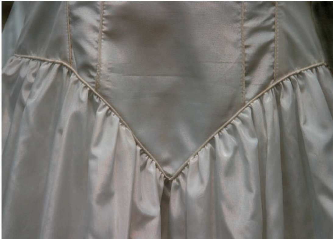
All världens brudar, Malmö museer 2004.