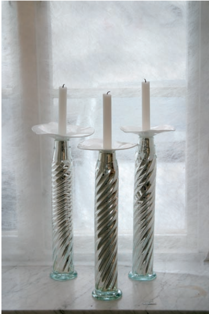
Sakralt, Skånekraft, Lund 2005.