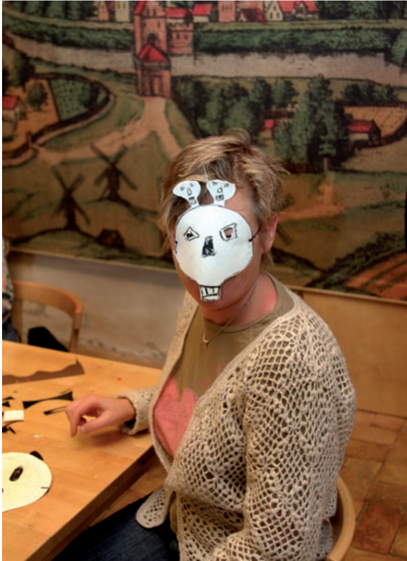
Dödsкульпyslande mamma, Malmö Stadsbibliotek 2006.