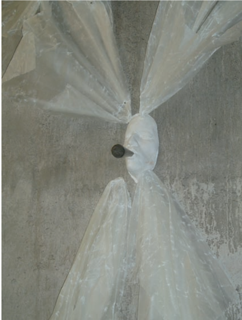
Der Engel Unterer Rand (detalj) Fraktale IV: Tod, Berlin 2005.