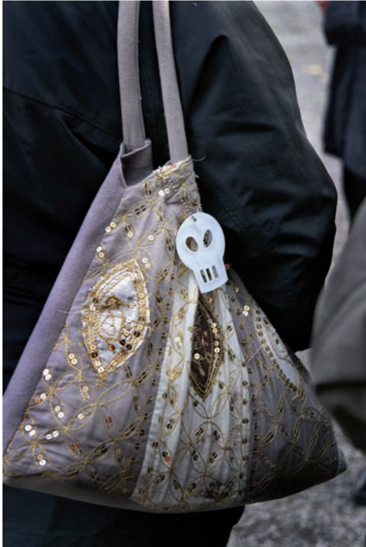
Kyrkogårdsvandring, Malmö 2006.