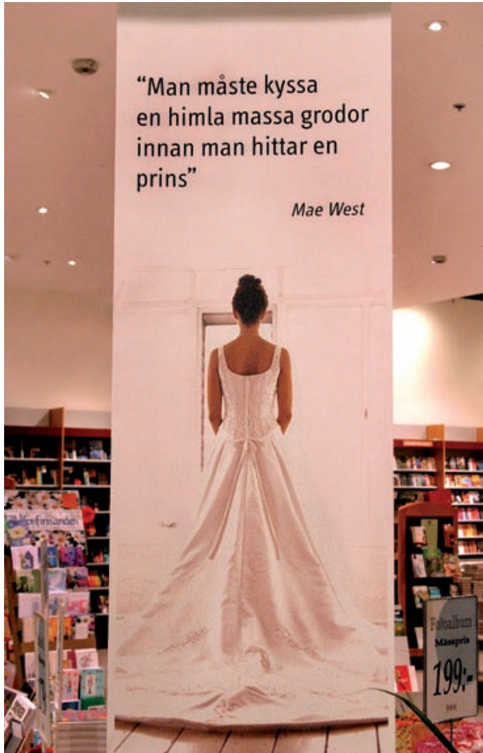
Center Syd, Löddeköpinge 2004.