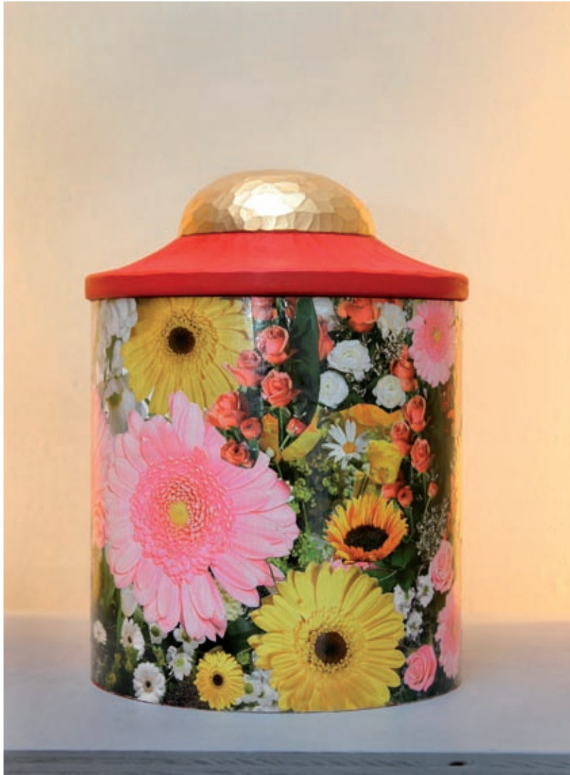
Sakral, Skånekraft, Lund 2005.