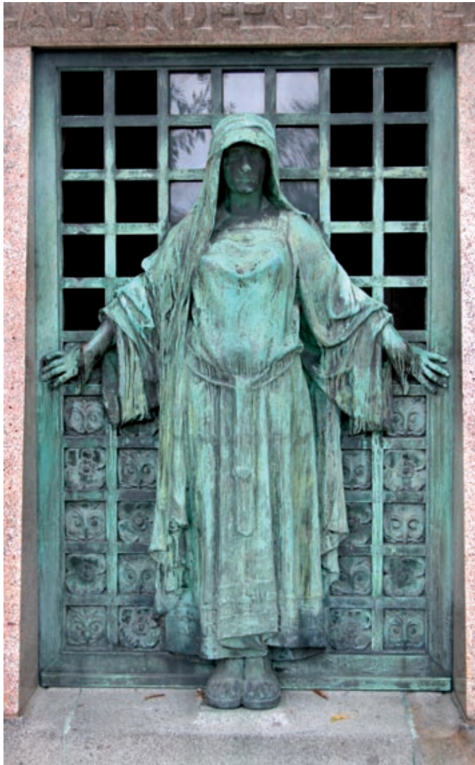
Père Lachaise kyrkogården, Paris 2005.