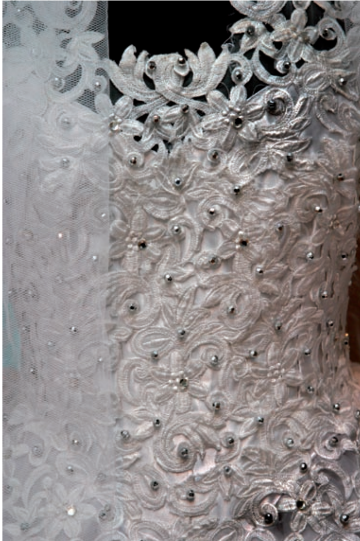
All världens brudar, Malmö museer 2004.