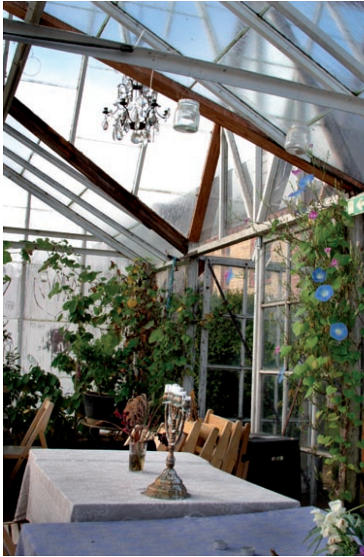
Mandelmans trädgårdar, Rörium 2005.