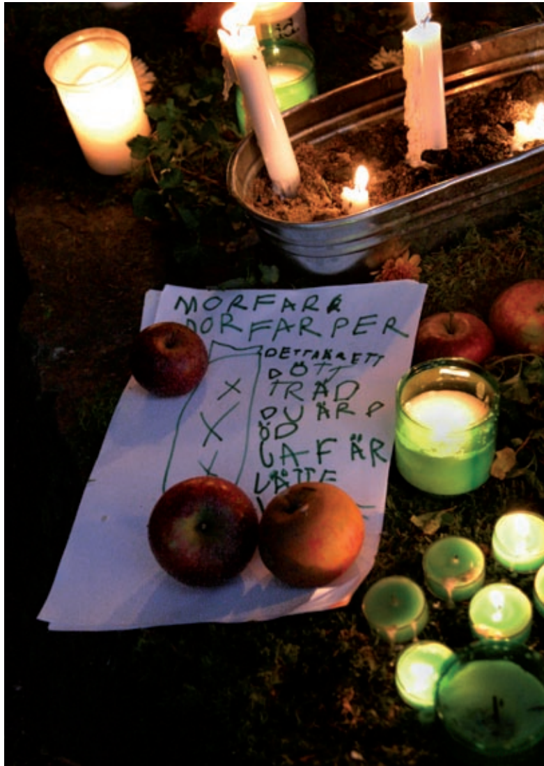
Altare i Slottsparken, Malmö 2006.