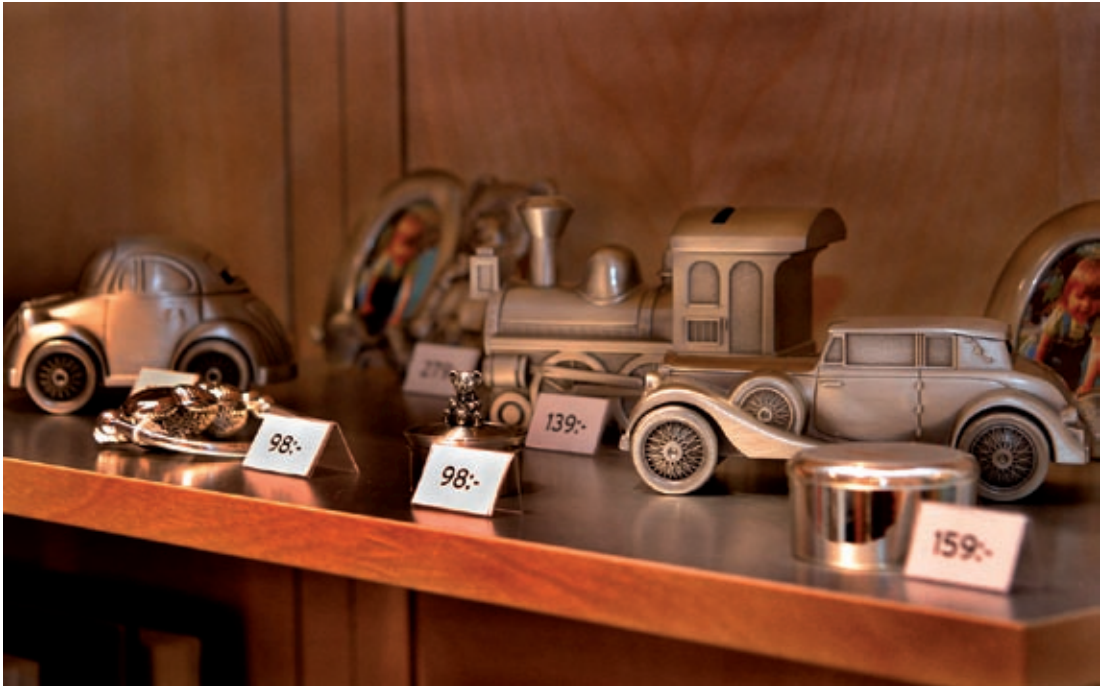
Guldfynd, Lund 2004.