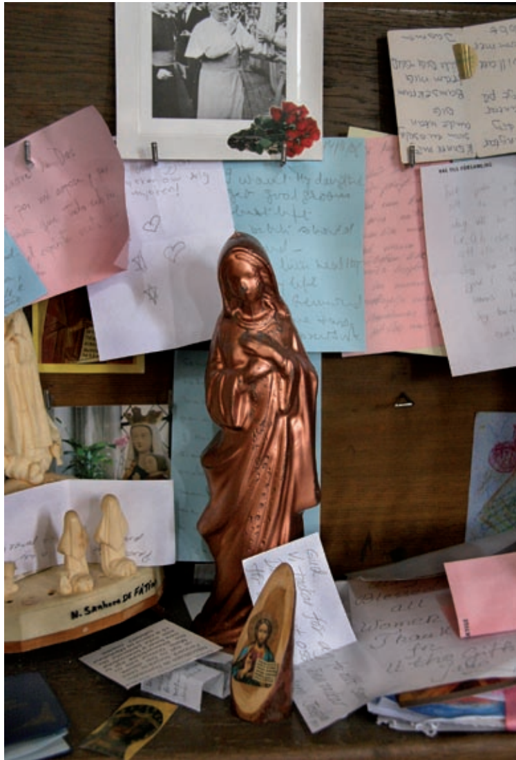
Sankt Petri kyrka, Malmö 2006.