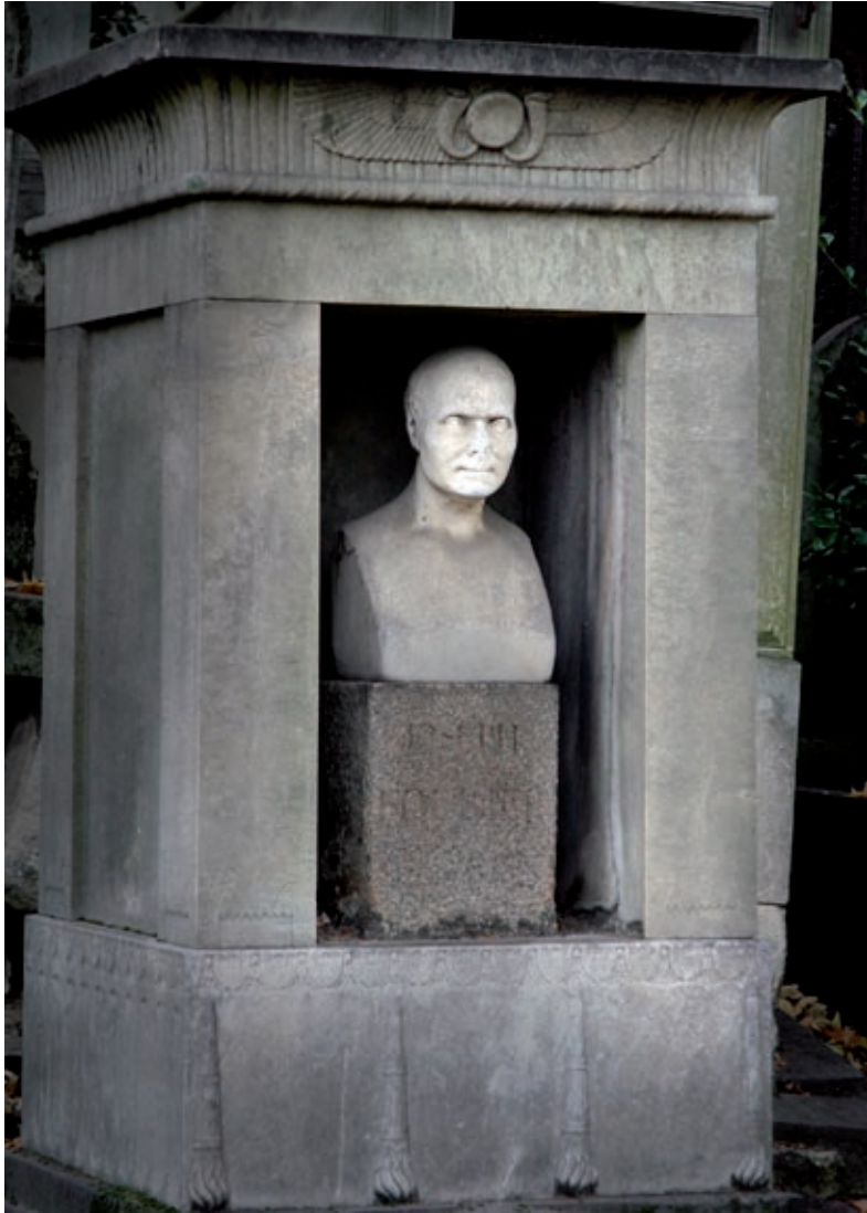
Père Lachaise-kyrkogården, Paris 2005.