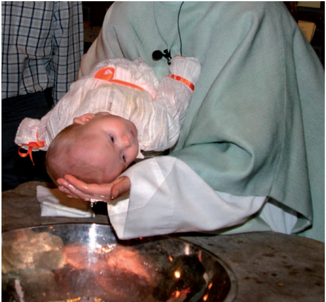
Barndop, Lund 2005.