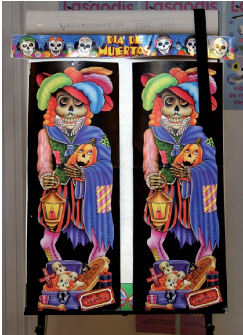
Dödskulpyssel, Malmö stadsbibliotek 2006.