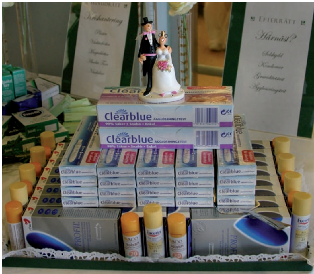
Center Syd, Löddeköpinge 2004.