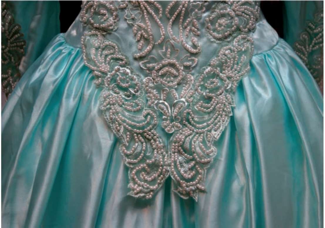
All världens brudar, Malmö museer 2004.