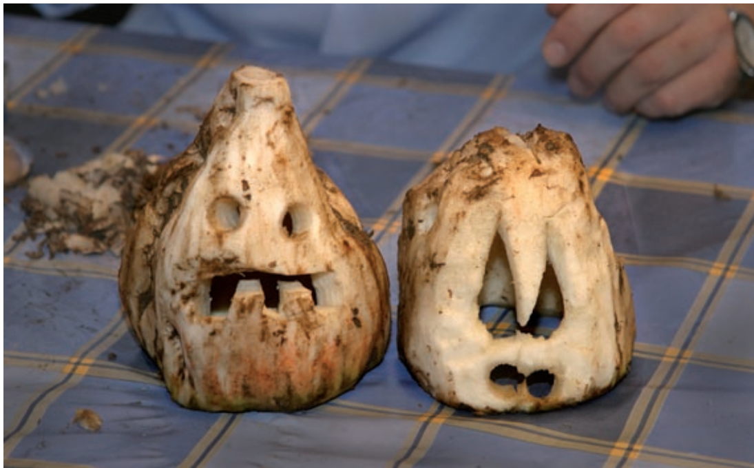
Skånska betlyktor, Malmö museer 2006.

Lyktor tillverkas av sockerbetor på Malmö museum. En gammal skånsk motsvarighet till de amerikanska lyktorna av pumpa.