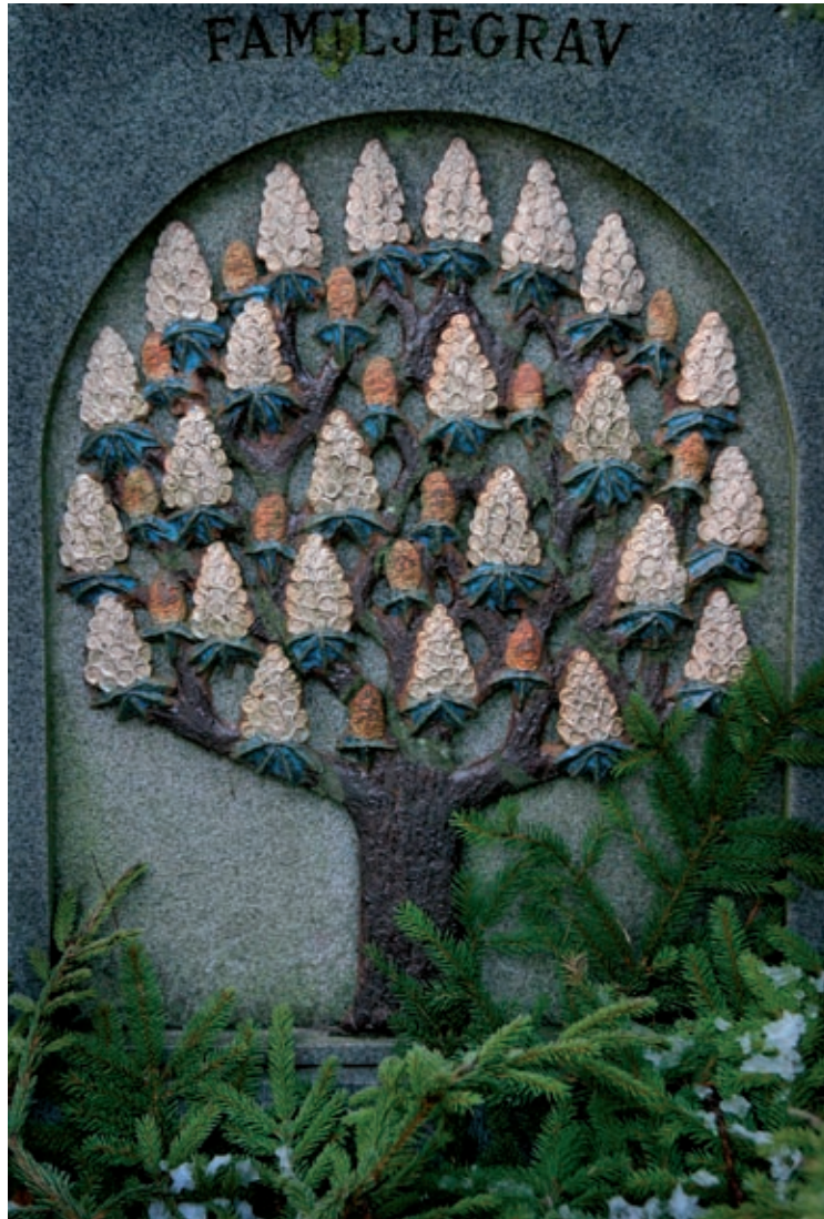
Norra kyrkogården, Lund 2005.