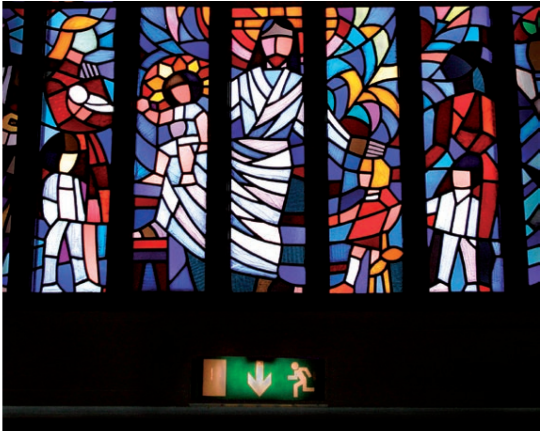
Petersgårdens kyrka, Lund 2005.