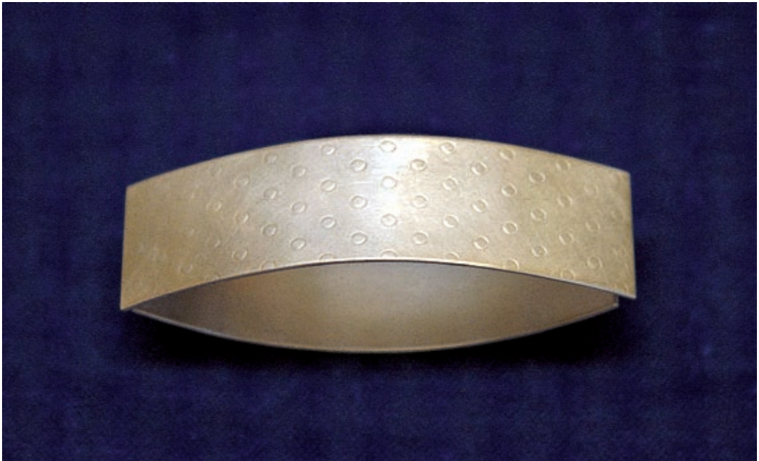
Chrisis silver och smycken, Lund 2004.