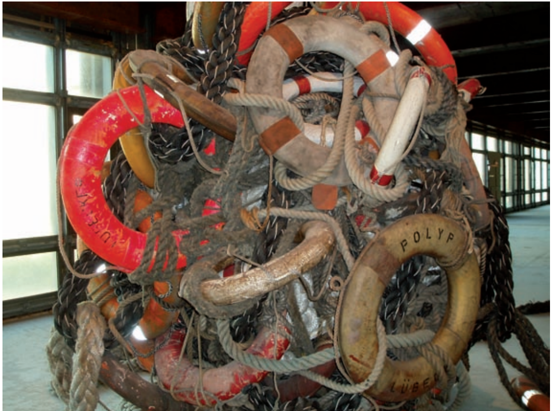
Seelenfänger (detalj). Fraktale IV: Tod, Berlin 2005.