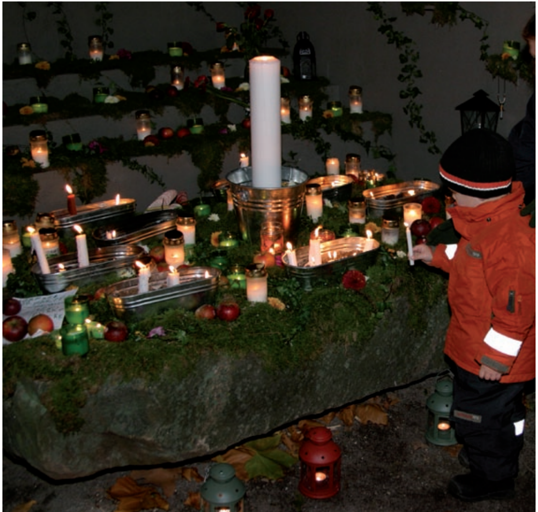
Altare i Slottsparken, Malmö 2006.