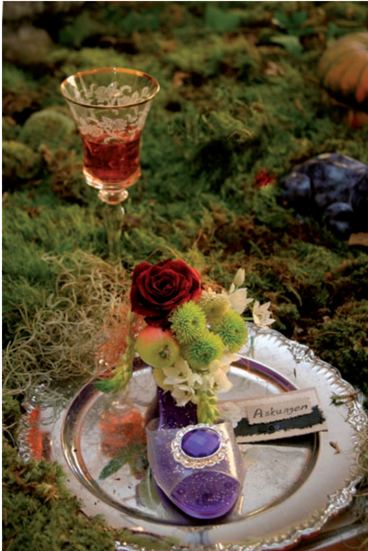
Bröllopsmessa, Lund 2004.