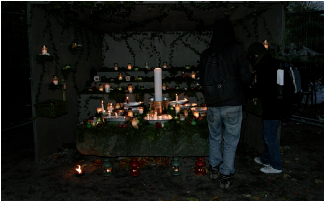
Altare i Slottsparken, Malmö 2006.

Den aktivitet som uppskattades mest av Malmöborna, var ett altare som skapades i ett hörn av den stora Slottsparken. Hit till ”De dödas altare” som öppnade i skymningen klockan 16 strömmade människor. Man gick förbi på väg hem från jobbet, tog en sväng dit på kvällen innan altaret stängde klockan 20. Man placerade sina ljus och mindes sina döda helt utan konfessionella eller andra krav. En lågmäld och lättillgänglig men också stämningsskapande och vardagsvacker aktivitet.