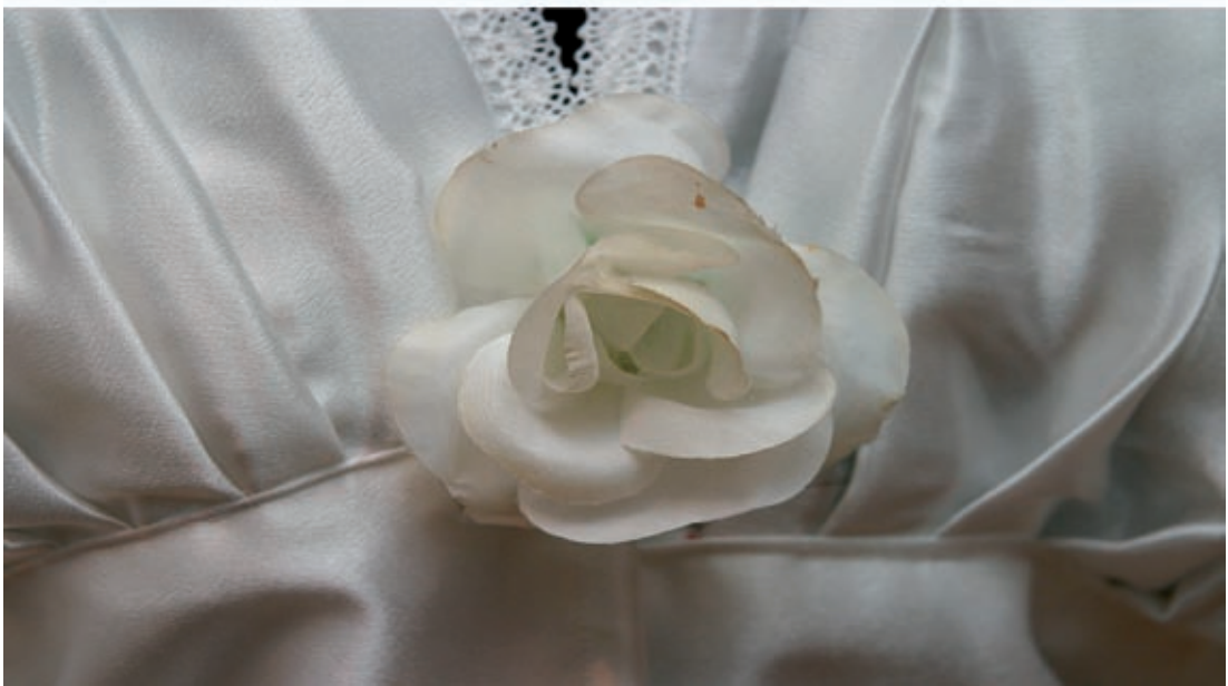
All världens brudar, Malmö museer 2004.