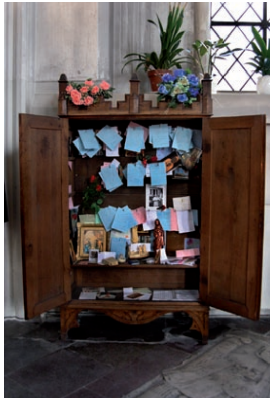
Sankt Petri kyrka, Malmö 2006.

I S:t Petri kyrka kunde man lämna små lappar med hälsningar och tankar till döda nära och kära.