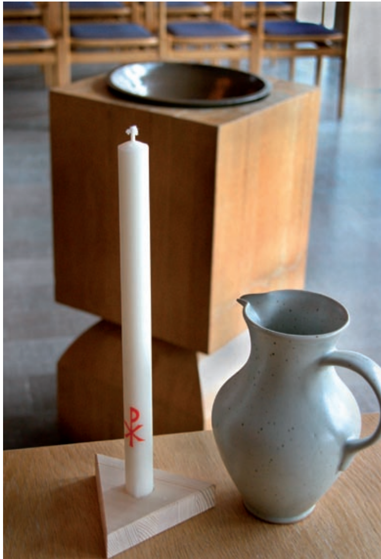
Petersgårdens kyrka, Lund 2005.