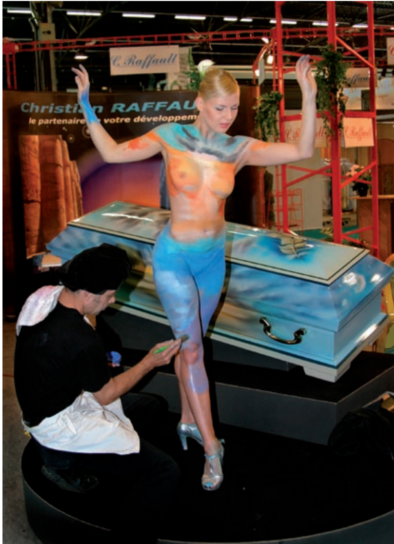
Begravningsmässan, Paris 2005.