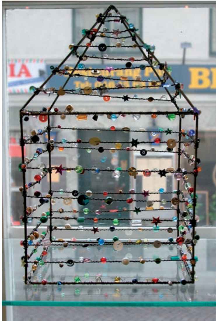
Sakralt, Skånekraft, Lund 2005.