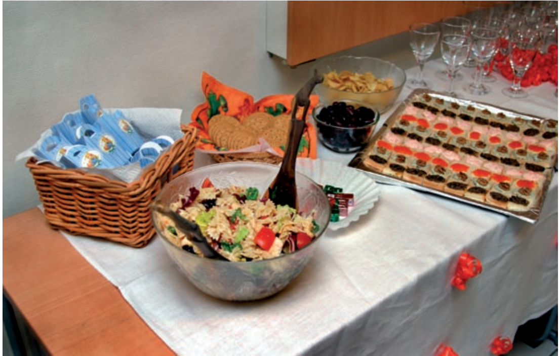
Lund 2005.