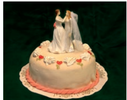
Tårta på tårta: Gunnars konditori, Helsingborg, begravningsmuseet i Ljungby, Center Syd, Löddeköpinge 2005.