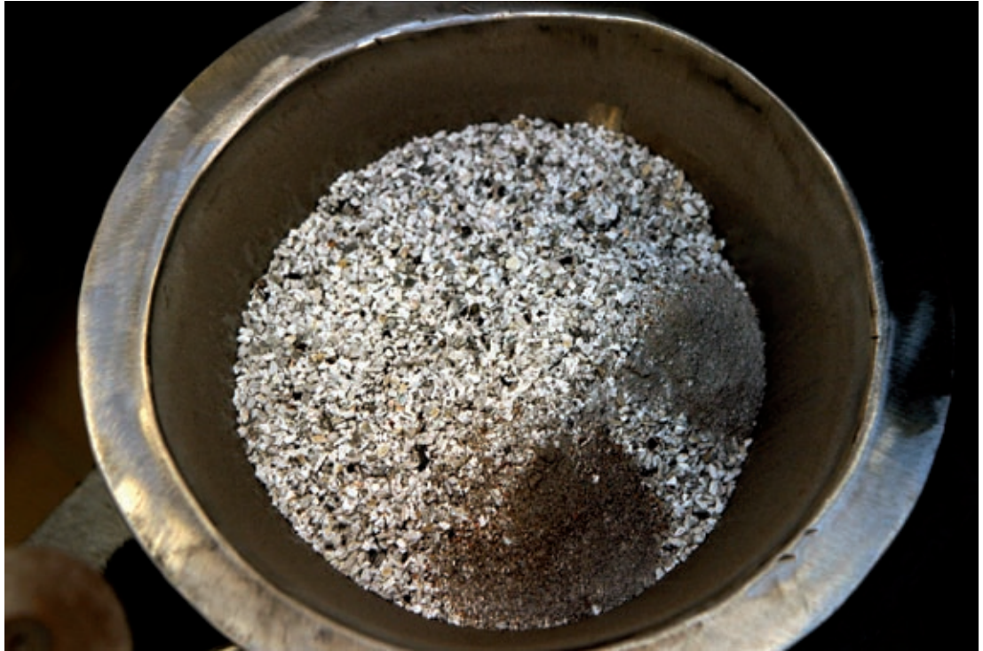
Krematorium, Lund 2005.