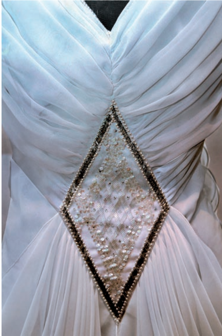
All världens brudar, Malmö museer 2004.