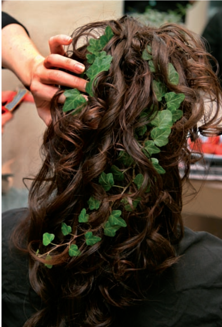
Frisörsalongen Stråh, Lund 2004.