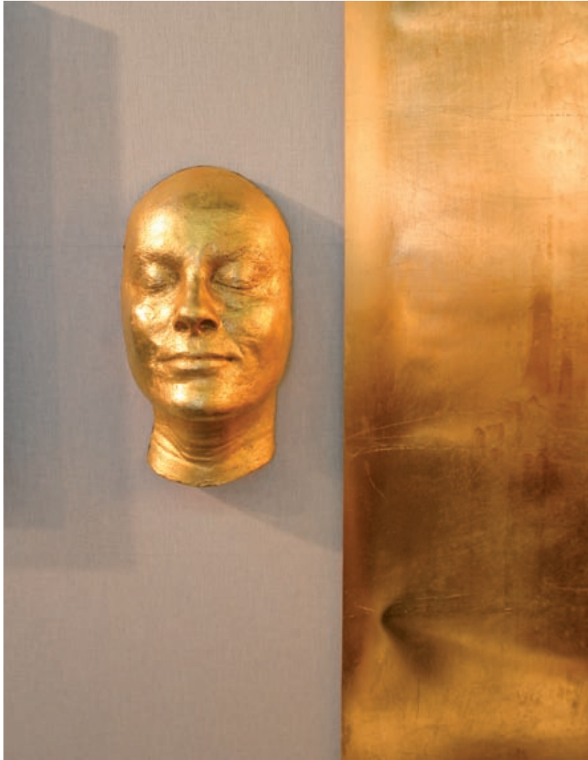
Begravningsmässan, Paris 2005. Foto: Susanne Ewert