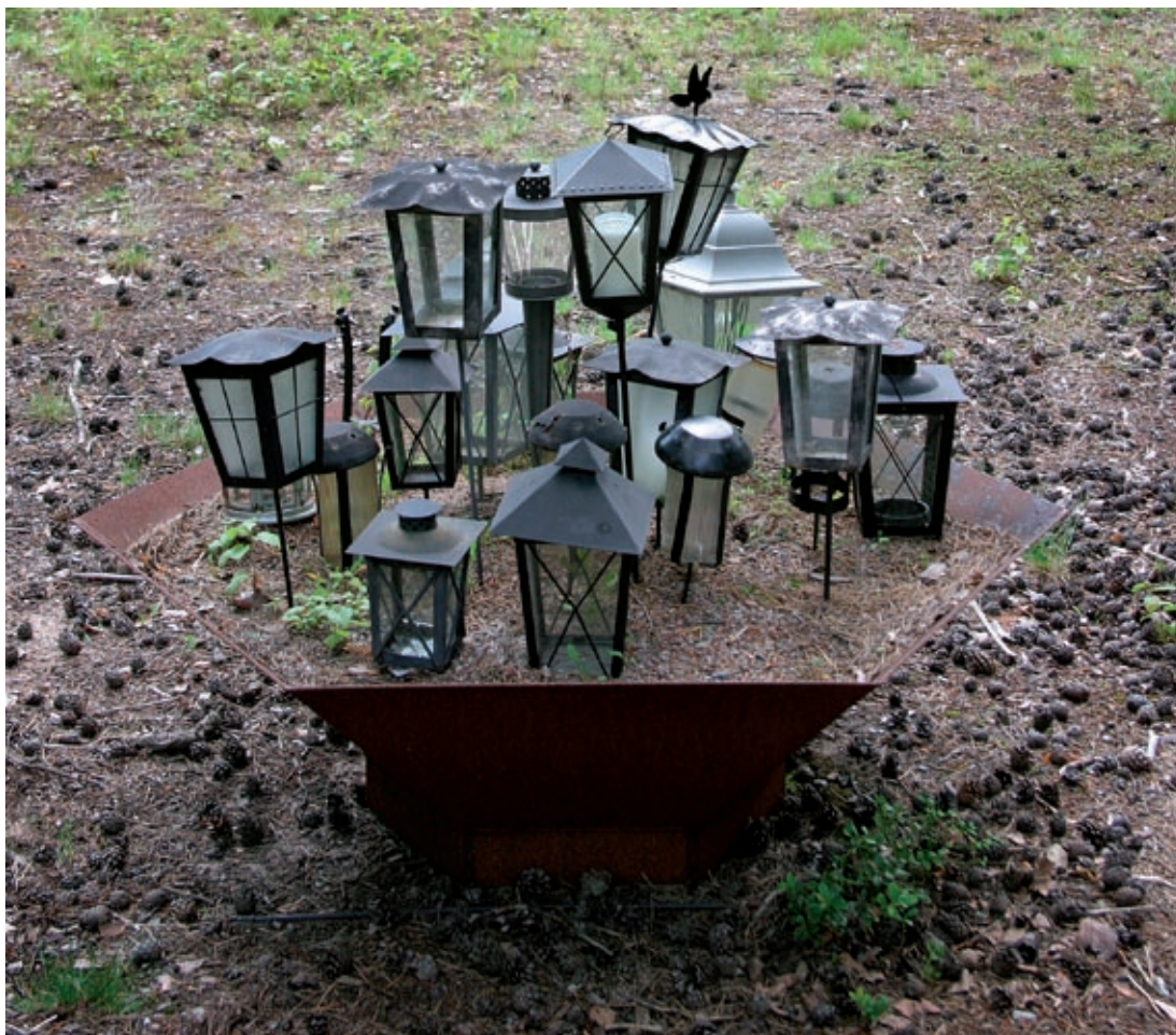
Strandkyrkogården, Stockholm 2005.