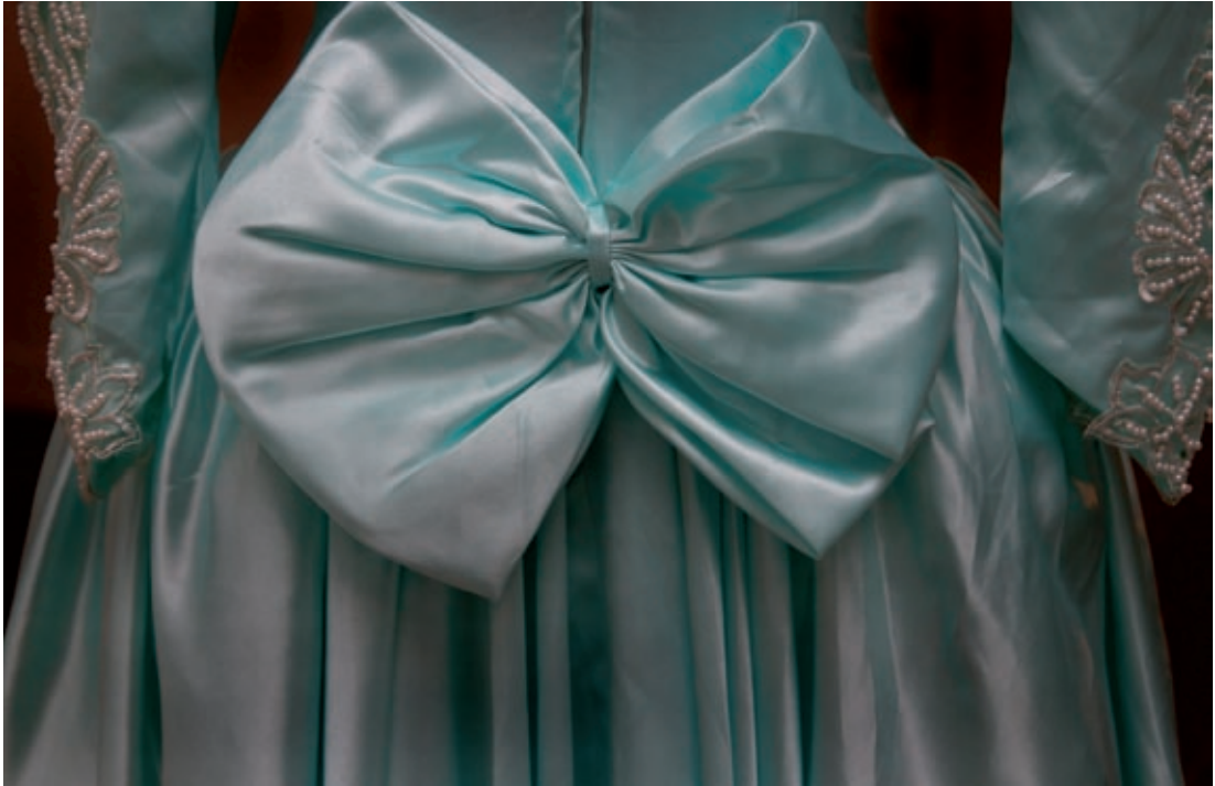
All världens brudar, Malmö museer 2004.