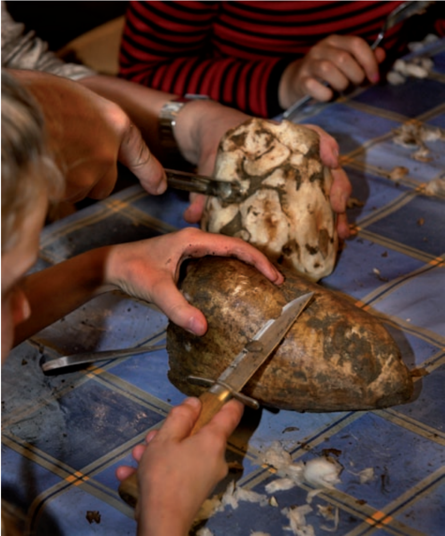
Skånska betlyktor, Malmö museer 2006.