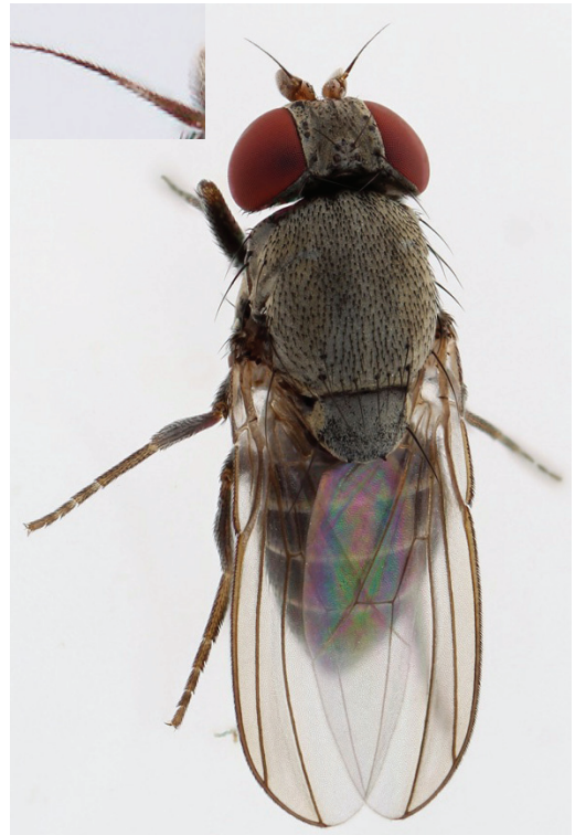
Figur 2. Hona av Cacoxenus indagator . Arten kännetecknas bl.a. av ljusgrå mellankropp med tät sittande småborst på ryggen och gråsvart bakkropp med ljusare band i bakkanten av tergiterna. Antennborstet (infälld förstoring) saknar längre hår.

När flugans ägg kläckts äter larverna upp bicellens näringsförråd och utvecklas till aduler, vilka kläcks nästa år. De nykläckta flugorna lyckas