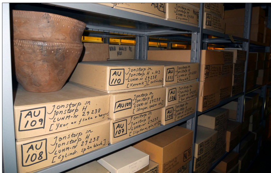
Jonstorks-material inför framtida forskningsfrågor. Historiska museets magasin, Lund.