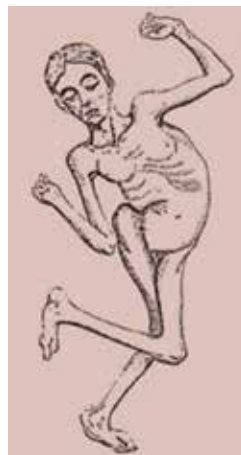
Figur 1. Exempel på deformiteter vid CP, beskrivna år 1871. Tyvärr ser vi fortfarande personer som utvecklat dessa komplikationer. Från: Brodhurst B. The deformities of the human body. A system of orthopaedic surgery. London; 1871.

I CPUP kontrolleras barnet av sin sjukgymnast och arbetsterapeut 1–2 gånger per år. Barnets motoriska funktion, rörel-