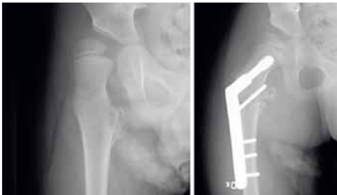
Figur 2. 5-årig pojke med CP. Röntgen visar lateralisering av caput i höger höft. Efter operation med variserande femurosteotomi.