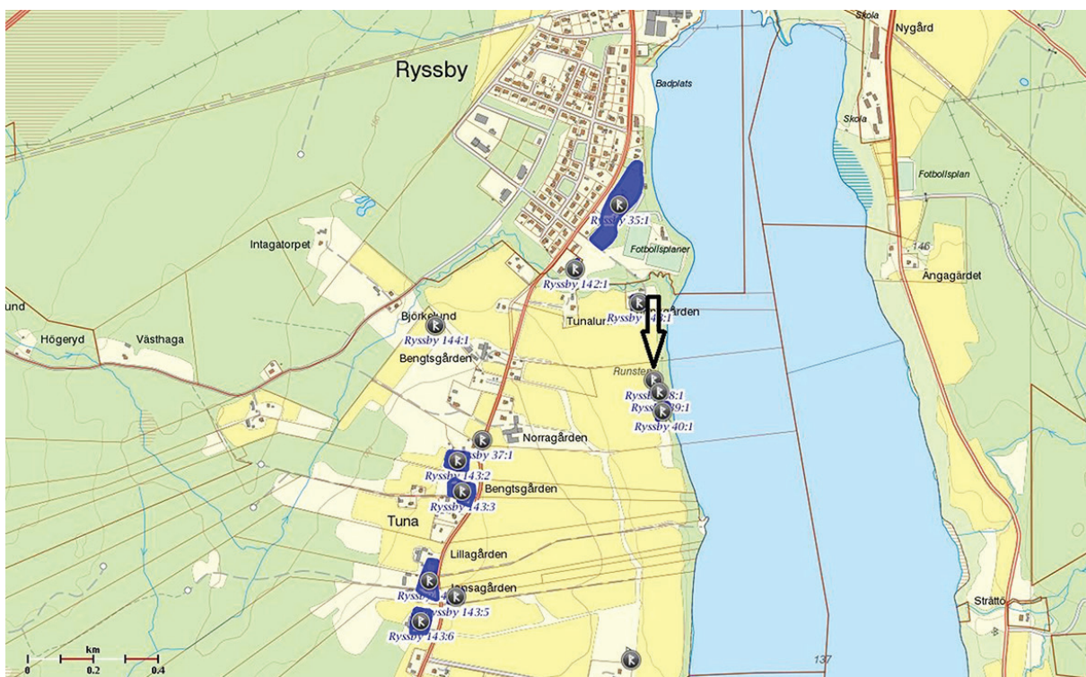
Fig. 1. Fornlämningssmiljön kring Tuna by, Ryssby socken. Pilen markerar läget för runstenen Sm 42, som är registrerad som RAÄ 38:1 i fornminnesregistret.

Runstenen i Tuna by (Sm 42) står i en öppen hagmark i anslutning till åkermark cirka femtiofem meter från Ryssbysjöns strand på dess västra sida (fig 1). Texten omtalar att den är rest över Assur som var kung Haralds skeppsman. Inskriften lyder ”tumi x risit : stin : thansi : iftir x asur : bruthur x sin x than : ar : uar : skibari :hrhls : ku I nuks : ”, i nusvensk översättning: ” Tumme reste denna sten efter Assur, sin broder, som var skeppsman åt kung Harald ”. (Gustavsson 2008, s. 203). Vilken kung Harald som avses är oklart även om flera alternativ diskuterats (se nedan).