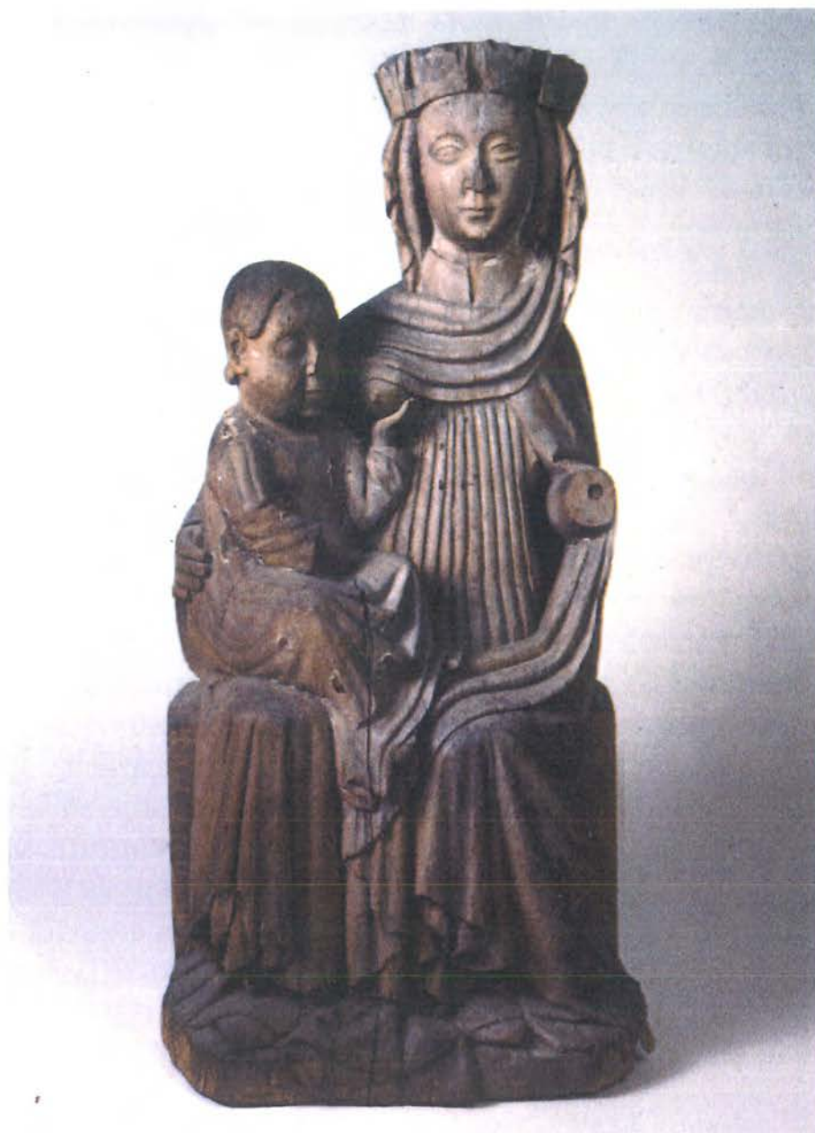
Tronande Madonna från Fjellie kyrka.

rat med ganska stort huvud och med runda kinder, ögonen har släta rundlar och munnen är rak och sluten. Håret sitter som en slät hjälm på hjässan.