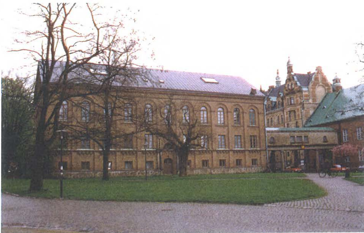
Museibygnaden vid Krafts torg med övergången till Domkyrkomuseet.