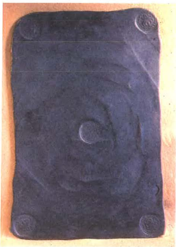
8 daler silvermynt 1663.

För att rätt förstå vårt lands penninghistoria från första delen av Gustav II Adolfs regering måste man ta hänsyn till Älvsborgs lösen. Vid freden i Knäred med Danmark år 1613 bestämdes det att Sverige skulle betala en lösen om 1 miljon riksdaler för att återfå Älvsborg, vårt "andningshål mot väster", som det så träffande har sagts. Beloppet skulle erläggas på sex år. Summan var oerhörd efter den tidens förhållanden, när kronans årliga inkomster inte uppgick till detta belopp. Genom stora extraskatter men framför allt med hjälp av kopparproduktionen, vilken starkt drevs på under dessa år, erlades beloppet. Det skedde dock till priset av skuldsättning till Nederländerna. Skulden måste betalas i riksdalermynt och dess erläggande i reda penningar beredde ibland regeringen svårigheter.