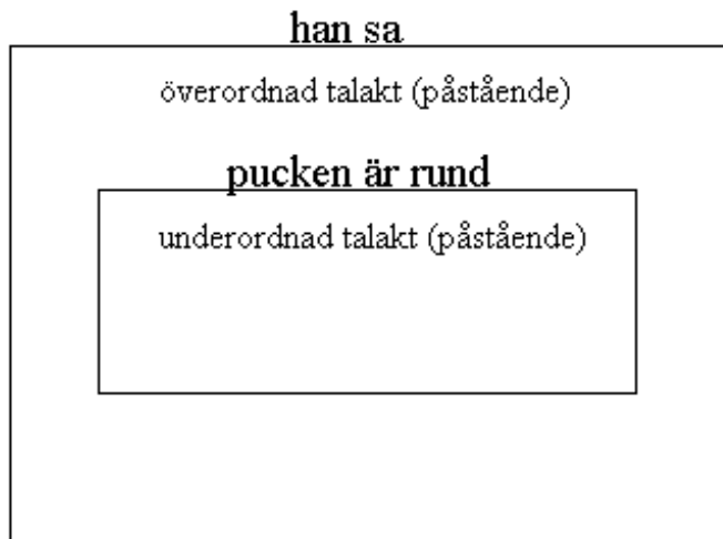
Figur 2. Han sa, pucken är rund.

Då anföringssatsen är finalt placerad verkar det kanske, vid första anblick, vara så att den talakt som utförs i den anförda satsen är överordnad. En förklaring till det ligger förmodligen i just det faktum att den då föregår anföringssatsen. Åhöraren hör först den anförda satsen, vilken ju, som självständigt yttrande, är en semantisk och syntaktisk huvudsats. Därefter hör hon eller han anföringssatsen. Det skulle med andra ord kunna vara så att man på sätt och vis lurats av följden mellan de satser (och talakter) som ingår i meningen. Men om man enligt samma mönster som i (124) samordnar en direkt anföring vars anföringssats är finalt placerad med en deklarativ huvudsats, märker man att det ligger närmast till hands att analysera även finalt placerade anföringssatser som semantiskt överordnade. Jämför exempelmening (125).