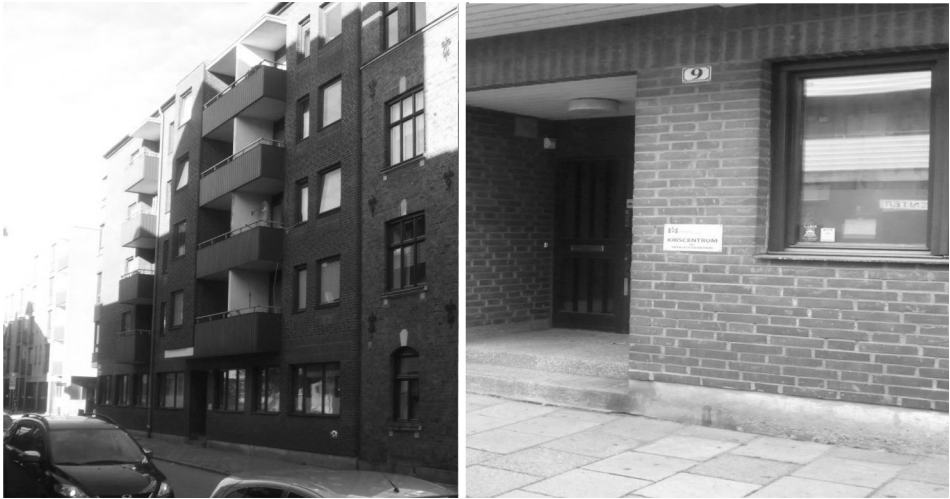
Bild 4 Kriscentrum för barn och ungdomar i Malmö

I Göteborg inryms Barnhuset i ett eget hus, som tidigare varit en skola för funktionshindrade barn. Det är ett stort nyrenoverat tegelhus, som ger intryck av en gammal folkskola. Det ligger i ett bostadsområde omgivet av grönområden, villor och hyreshus. Det ligger intill Bryggan som är ett utredningshem för barn och unga. Försöksverksamheten med ett Barnhus inrymdes inledningsvis i Bryggans lokaler.