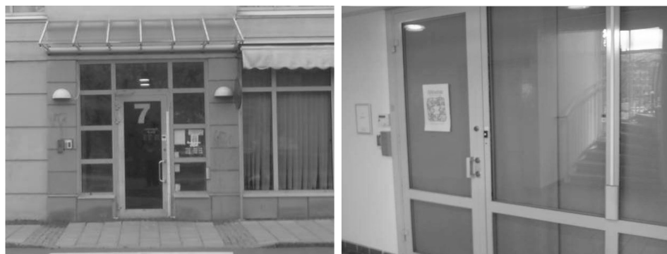
Bild 11 och 12 Stödcentrum för barn och unga i Sundsvall

I Sundsvall inryms Stödcentrum för barn och unga på första våningen i ett centralt beläget kontorshus. I trapphuset och på entrédörren finns skyltar som visar vägen.