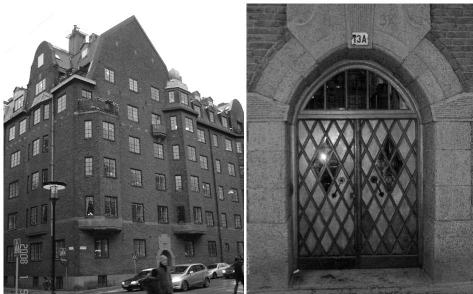
Bild 9 och 10 Barncentrum i Stockholm

gäster som finns innanför porten. På dörren till ingången till lägenheten finns en skylt som visar att Barncentrum inryms där.