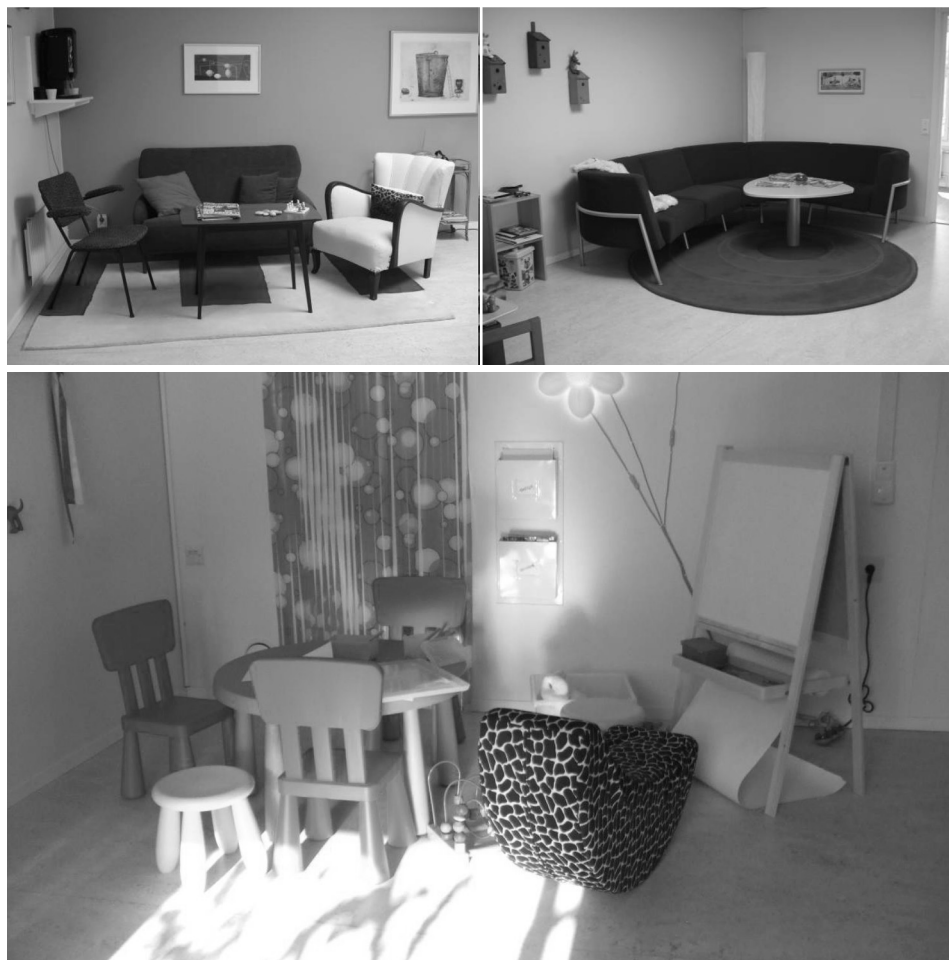
Bild 1, 2 och 3 Interiörer från Barnhuset i Linköping och Barncentrum i Stockholm

Barnhusen ligger alla i "vanliga" hus och lägenheter med hemlik miljö. Alla lokaler- na är renoverade nyligen eller ganska nyligen. De är målade i ljusa färger och inredda med nya möbler i klara färger och med mjuka former. Det finns mycket leksaker, mjukisdjur, tidningar och spel. På flera ställen finns olika väntrum för de minsta bar- nen och för tonåringarna. Väggarna är prydda med konst och textilier i klara färger.