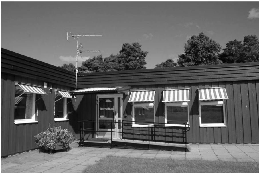
Bild 6 Barnhuset i Linköping

I Linköping inryms Barnhuset i ett rött enplans trähus beläget på lasarettområdet. Det har tidigare använts som daghem. Utvändigt på huset finns en tydlig skylt med texten "Barnhus".