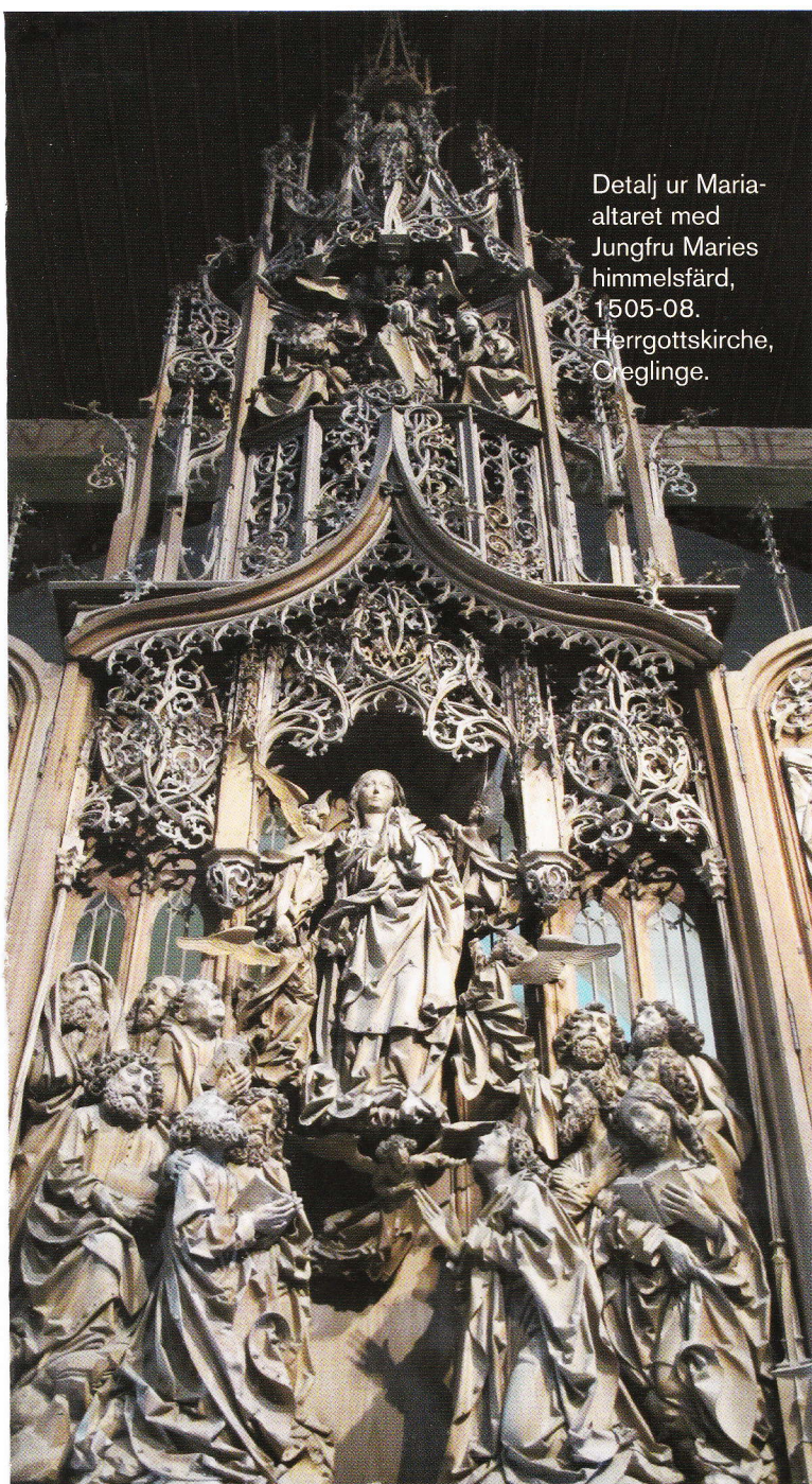
Detalj ur Maria-altaret med Jungfru Marias himmelsfärd, 1505-08. Herrgottskirche, Creglinge.