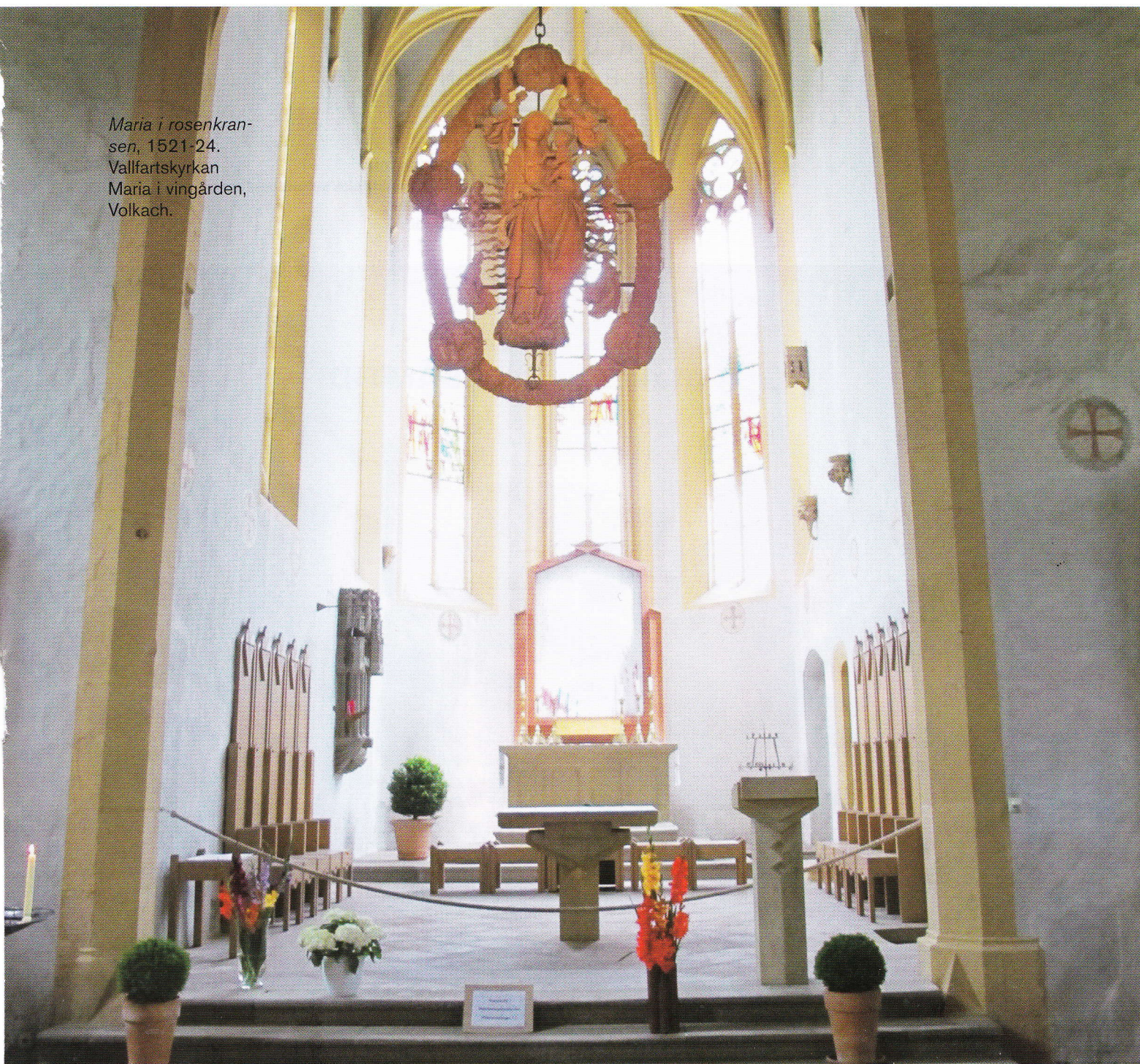
Maria i rosenkransen, 1521-24. Vallfartskyrkan Maria i vingården, Volkach.

och även gjorde politisk karriär. 1504 valdes han in i stadsrådet och var 1521-24 Würzburgs borgmästare. 1525 begick han dock ett ödesdigert misstag, när han i det s.k. bondeupproret ställde sig på böndernas sida mot furstbiskopen.