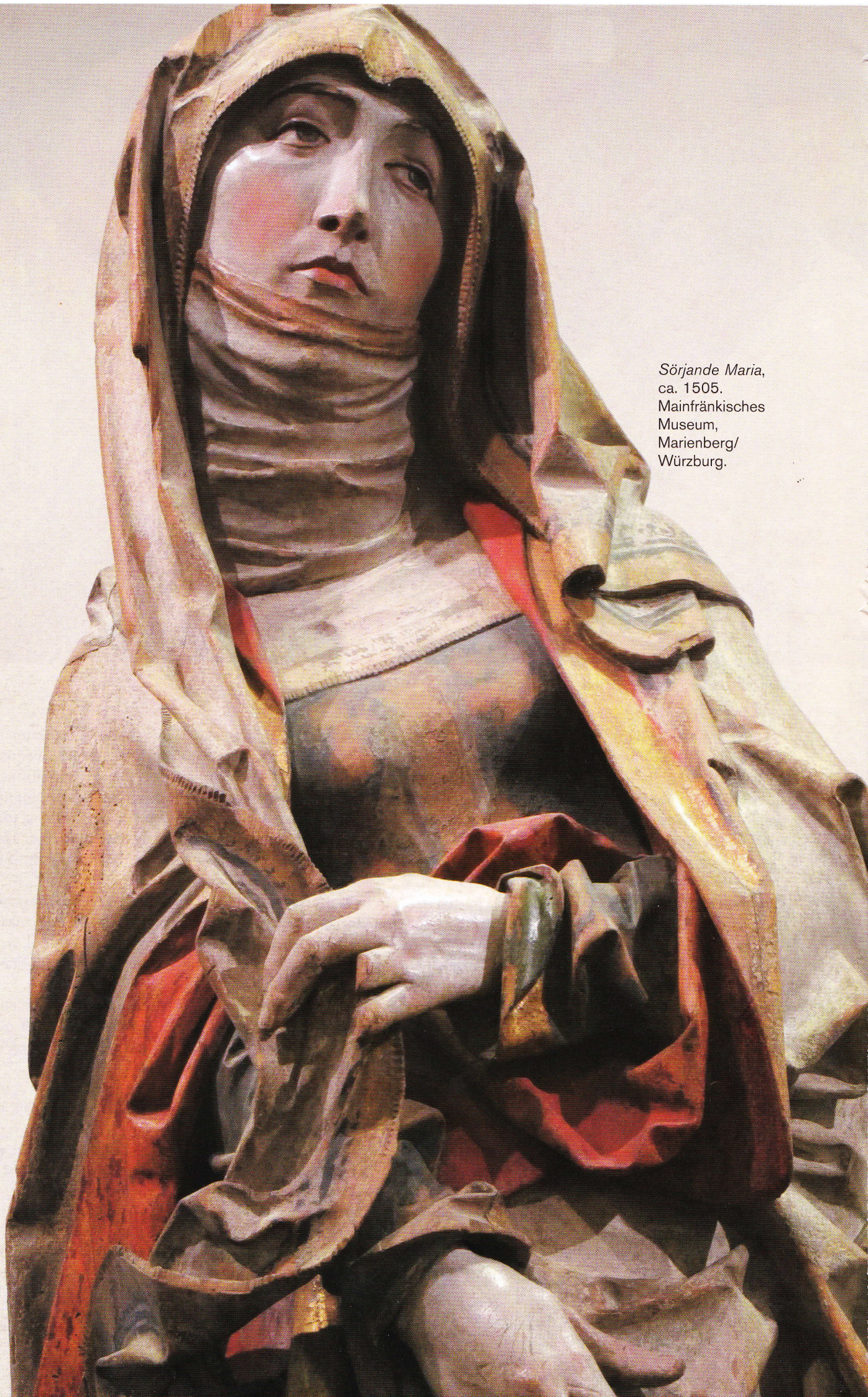
Sörjande Maria, ca. 1505. Mainfränkisches Museum, Marienberg/ Würzburg.