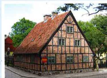
Studentkasernen där mordet ägde rum 1829 kallas än i dag "Syndens hus".

DESTO RIKLIGARE VAR Landéns skulder. I bouppteckningen finns inte bara en obetald hyra till hyresvärdin – att bo inneboende i privathem var länge den vanligaste formen av studentboende – utan även till tvätterskor och matlagerskor och en "uppassare". Detta speglar att även fattiga studenter vid denna tid i mycket liten utsträckning utförde någon form av eget husligt arbete.