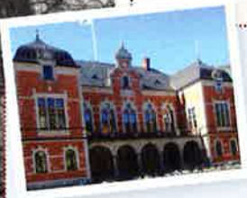
NATIONERNAS matriklar över studenterna kan vara en guldgruva. Här Norrlands nations pam- piga byggnad i Uppsala.