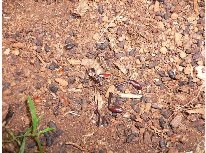
Figur 4. Mulm i ihåliga träd modifieras av läderbaggen Osmoderma eremita , vars spillning är en viktig komponent; de mörka ekollonformade partiklarna.

Wood mould from a hollow oak at Strömsrum with frass of Osmoderma eremita .